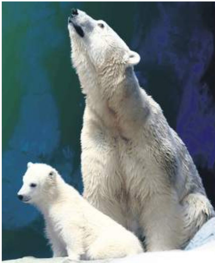
Nur é o primeiro filhote de urso polar a nascer na América do Sul

O percurso do visitante é pensado como uma viagem por ecossistemas. No Mundo Marinho, tanques que reproduzem manguezais, praias arenosas, costões rochosos, recifes e oceanos aproximam o público de tubarões, raias e pinguins. No setor Amazônia, vivenciam-se exemplares emblemáticos do bioma: peixe-boi-amazônico, pirarucus e pirararas dividem