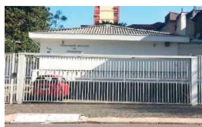
Consultas são pela Prefeitura na rua Diogo de Faria, 839

A Prefeitura realiza tratamento homeopático em 12 equipamentos, como Unidades Básicas de Saúde (UBSSs), Ambulatórios de Especialidades (AEs) e hospitais, em todas as regiões, que contam com 17 médicos homeopatas. Em 2024, foram realizadas 12.465 consultas homeopáticas na rede municipal. Na Vila Clementino as consultas com médicos homeopatas podem ser realizadas na rua Diogo de Faria 839. No mesmo local o paciente também pode retirar o medicamento prescrito. O acesso a uma consulta de homeopatia na rede municipal de saúde é feito a partir da solicitação do cidadão em sua UBS de referência. Os pacientes também têm acesso aos medicamentos