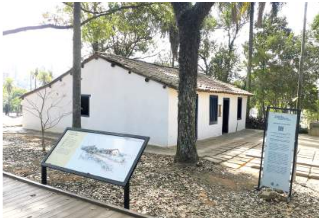
Construção a pau-a-pique é alvo constante de pesquisas arqueológicas e estudos acadêmicos

Hoje incorporada ao Museu da Cidade de São Paulo, a Casa do Grito funciona como espaço de reflexão sobre memória, representação e patrimônio. Sua relevância não está apenas no imaginário ligado à cena da