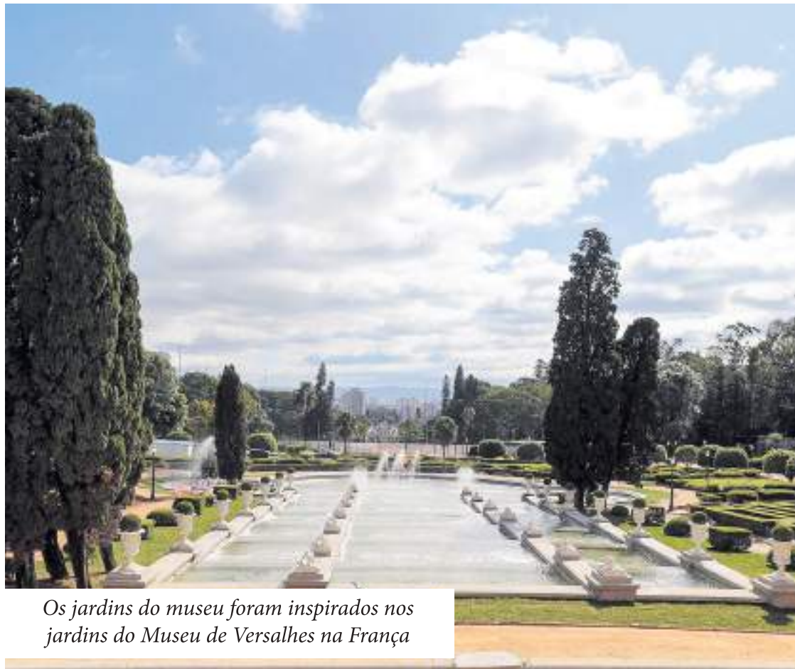
Os jardins do museu foram inspirados nos jardins do Museu de Versalhes na França

O Zoológico, por sua vez, articula pesquisa, educação, conservação e lazer. Estruturado em