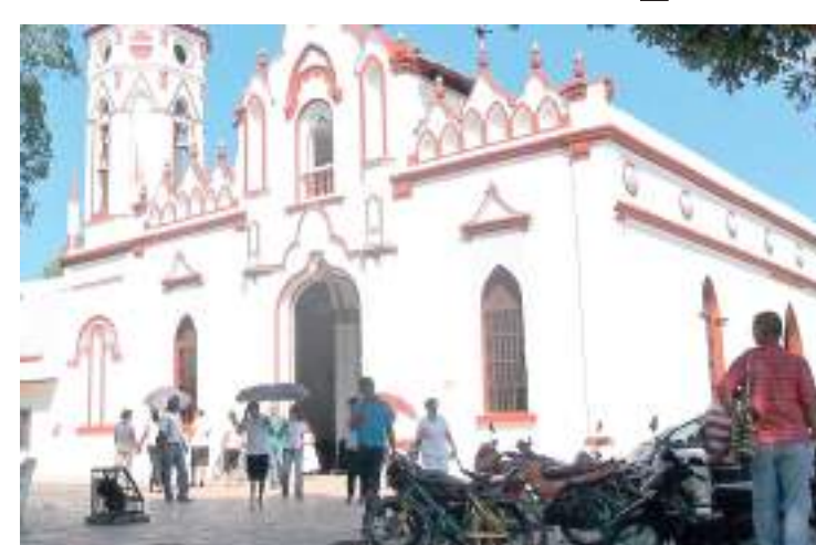
Aracataca, cidade natal do escritor, berço de inspirações

radas que serviram de base para a fictícia Macondo, revisitam a casa onde ele nasceu – hoje transformada em museu – e sentem de perto o ambiente que alimentou sua imaginação. Já em Cartagena, o cenário vivo de “O Amor nos Tempos do Cólera”, a arquitetura colonial, as muralhas seculares, as cores vibrantes e o ritmo pulsante da cidade evocam as atmosferas mais intensas de sua obra. O diferencial do roteiro não está apenas no cenário, mas na proposta de transformar leitura em vivência. O especialista Francisco Escorsim acompanha o grupo em todas as etapas, promovendo mediações literárias que conectam passagens dos livros aos lugares visitados. Essa dinâmica cria um diálogo constante entre a ficção e a realidade, permitindo aos participantes experimentar a literatura de forma sensorial. Reflexões sobre o tempo, a memória, o amor e a solidão surgem naturalmente diante das paisagens que deram origem a essas ideias. É como se cada