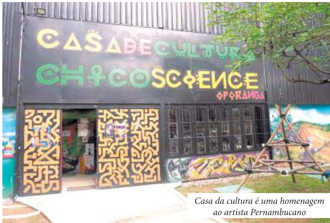
Casa da cultura é uma homenagem ao artista Pernambucano

o espaço se mantém como um exemplo de política pública voltada para a cultura, aproximando a comunidade de diferentes manifestações artísticas.