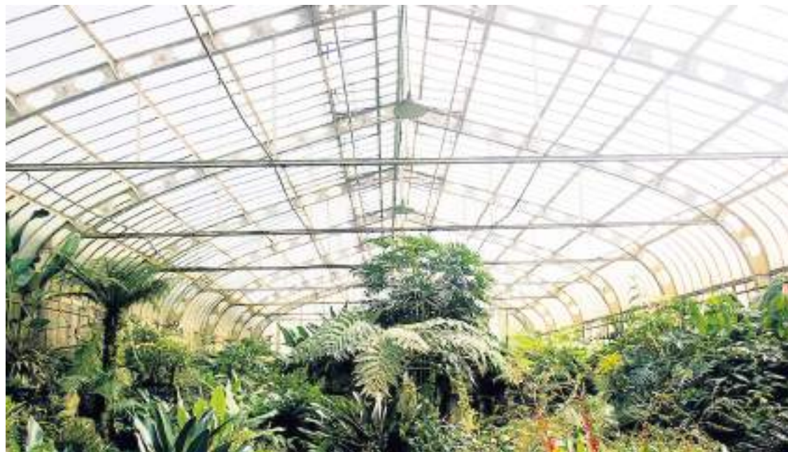
Entre as estufas, orquidário mantém viva a tradição da coleção de orquídeas, bromélias e samambaias

A diversidade de ambientes transforma o jardim em laboratório vivo de conservação e educação ambiental. Projetos como o hidrofítotério, idealizado em 1947 para o cultivo de plantas aquáticas, ilustram a continuidade do trabalho técnico-científico desenvolvido ali