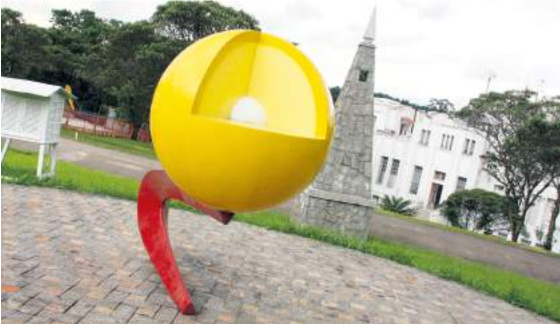
Exposições do local exercem um papel pedagógico fundamental

Em meio à correria paulistana, um refúgio de ciência e natureza convida crianças, jovens e adultos a experimentar a curiosidade: é o Parque de Ciência e Tecnologia da USP (CienTec). Instalado dentro do Parque Estadual das Fontes do Ipiranga, o CienTec ocupa parte de uma área de conservação de 141 hectares de Mata Atlântica e reúne história, educação e preservação ambiental em um único espaço acessível ao público.