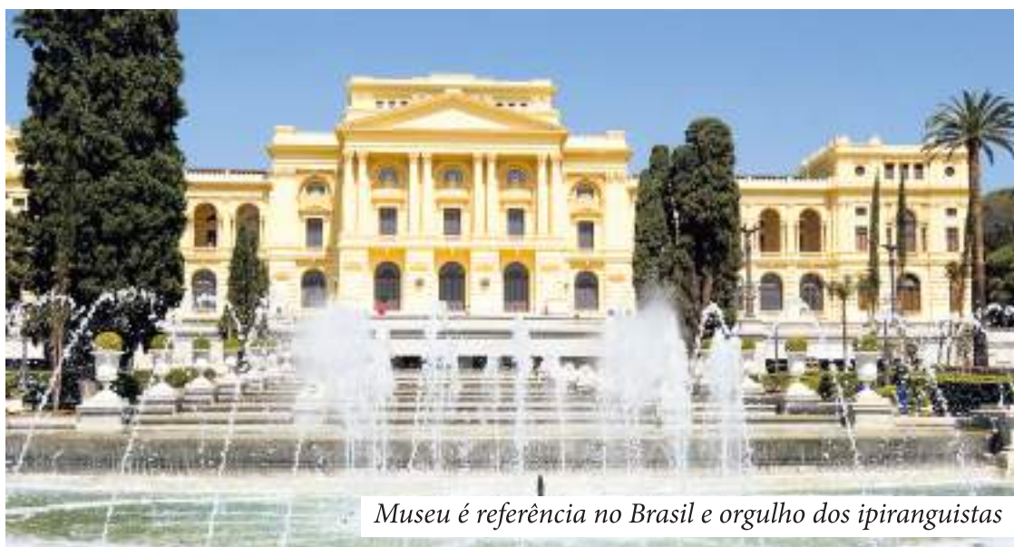
Museu é referência no Brasil e orgulho dos ipiranguistas

Quem hoje visita o Museu do Ipiranga tem a possibilidade de conhecer um pouco do nosso passado, costumes, cultura e história. Saber, por exemplo, o nome dos nossos principais rios e o Estado onde eles estão