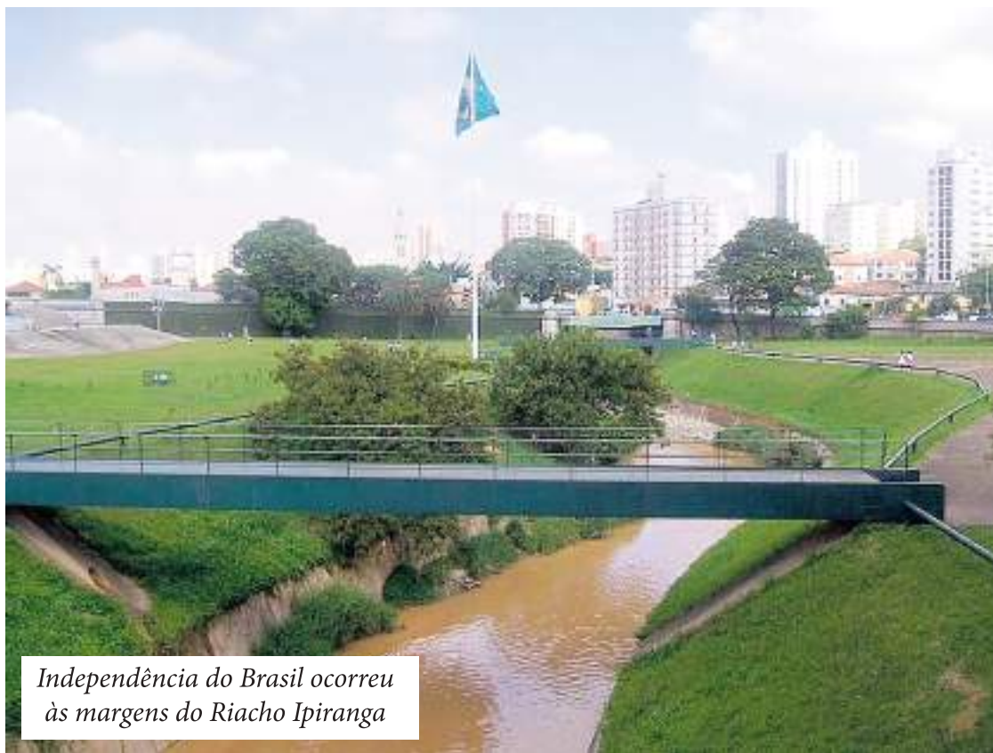
Independência do Brasil ocorreu às margens do Riacho Ipiranga

Apesar de sua extensão relativamente curta e largura limitada, o Riacho Ipiranga tem grande relevância histórica e cultural. Ele ficou eternizado como o local em que ocorreu o episódio simbólico que marcou a independência do Brasil. Por isso, o riacho é frequentemente lembrado na literatura, na pintura histórica e na