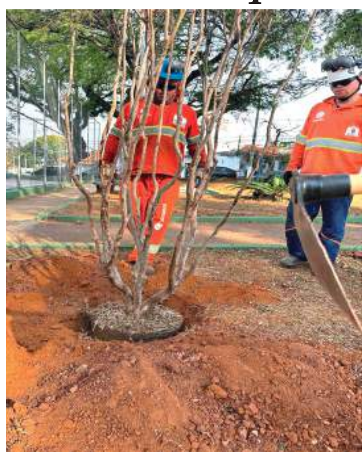
Praça Nova América ganhou duas jabuticabeiras e dois pau-brasil

A expectativa é que os exemplares cresçam fortes, frutifiquem e inspirem a todos a cuidar do meio ambiente, mantendo a cidade mais verde e acolhedora.