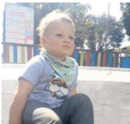
Praça é ambiente seguro para crianças

partilhamento. A área parcialmente cercada, com estrutura de madeira colorida, garante a