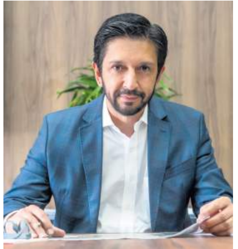
Ricardo Nunes, prefeito de São Paulo

O trabalho não para! A Prefeitura segue firme no propósito de acordar cedo e dormir tarde, sempre com uma única pergunta em mente: o que podemos fazer para melhorar a vida das pessoas?