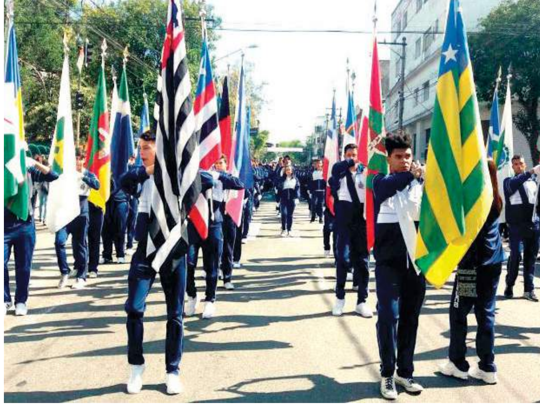
O Ipiranga completa 441 anos e a festa vai ser incrível. No domingo (28), a partir das 8h45, haverá o desfile cívico na Rua Silva Bueno, 2040, e a partir das 13h, o Ipiranga Fest com música, gastronomia, artesanato e muitas surpresas para toda a família. Tudo gratuito e cheio de diversão. Não fique de fora. Participe. PÁGINA 3