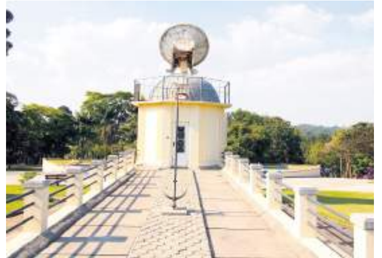
CienTec fica numa área de conservação da Mata Atlântica

A vocação ambiental do CienTec também se reflete na localização e na história do lugar. Entre 1932 e 1941 foram erguidas edificações de valor arqui-