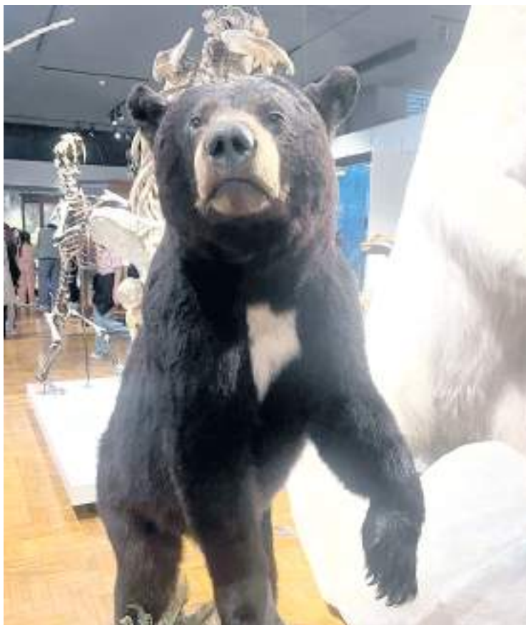
Animais empalhados e dinossauros são os favoritos das crianças

A trajetória do Museu remonta ao final do século XIX, quando coleções reunidas por Joaquim Sertório integraram o Museu Paulista. A partir da criação do Departamento de Zoologia, em 1939, o acervo ganhou um edi-