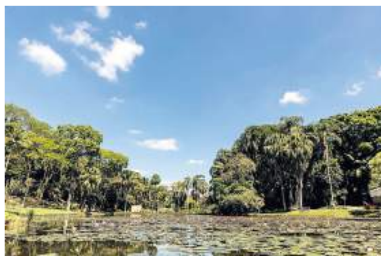
Lago das Ninfeias mantém uma microfauna que vai de peixes a aves