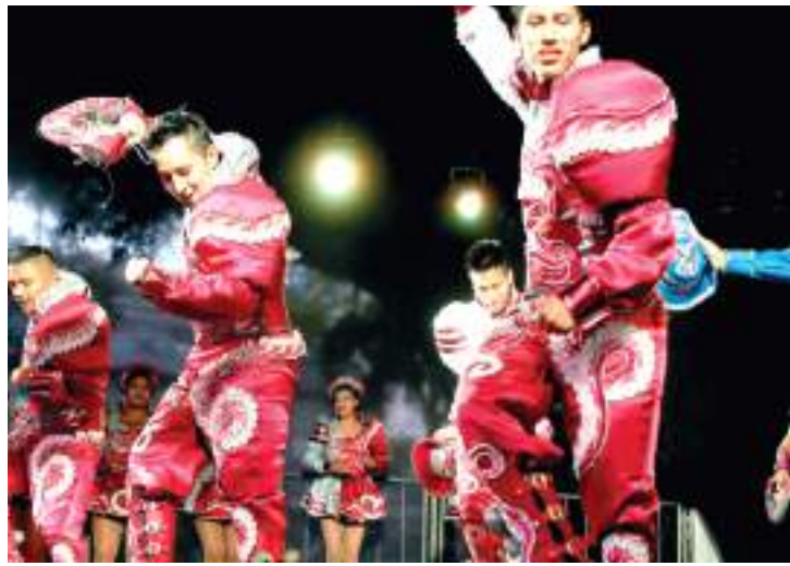
Entrada do evento é 1kg de alimento não perecível, exceto sal

Outro destaque está no palco montado nos jardins do Museu, que será ocupado por grupos de música e dança de diferentes países. A cada dia, cerca de 17