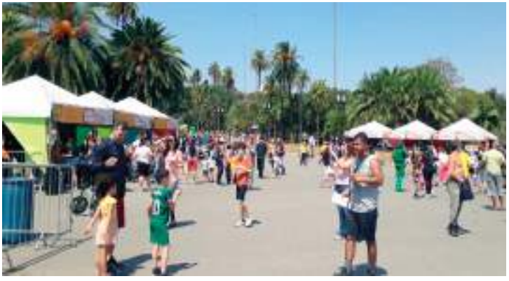
Além dos brinquedos, teve pipoca, água e algodão doce de graça

O público também acompanhou apresentações de marionetes, contação de histórias e o show do Mágico Tralha e sua banda. O ponto alto foi o es-