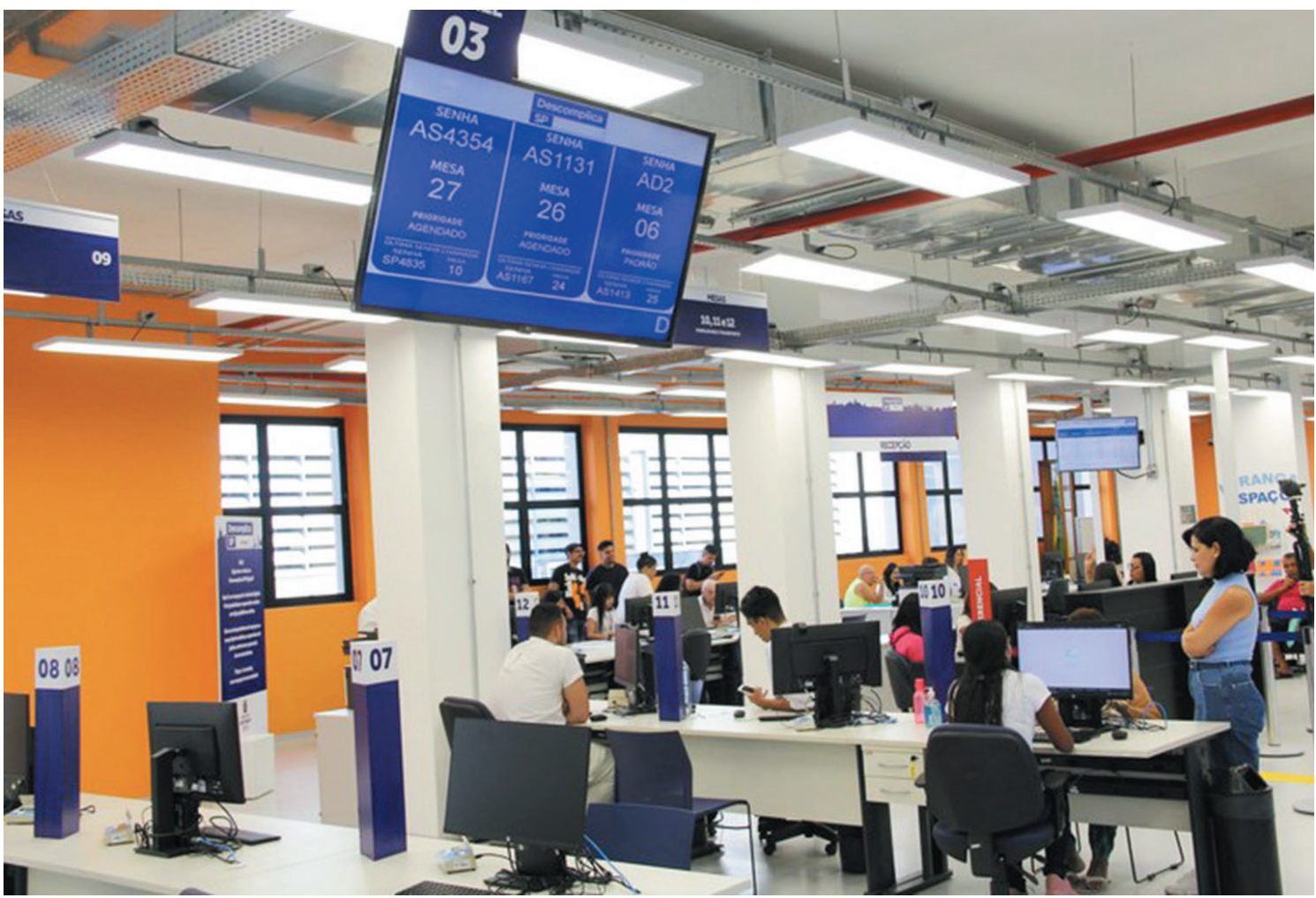
O Ipiranga ganhou, oficialmente, nessa quarta-feira (01), uma unidade do Descomplica SP, localizada no prédio da GCM, que fica na Rua Breno Ferraz do Amaral, 425, na Vila Firmiano Pinto, próximo ao antigo incinerador. Essa será a 11ª do programa, que tem atingido altos índices de satisfação da população. PÁGINA 3