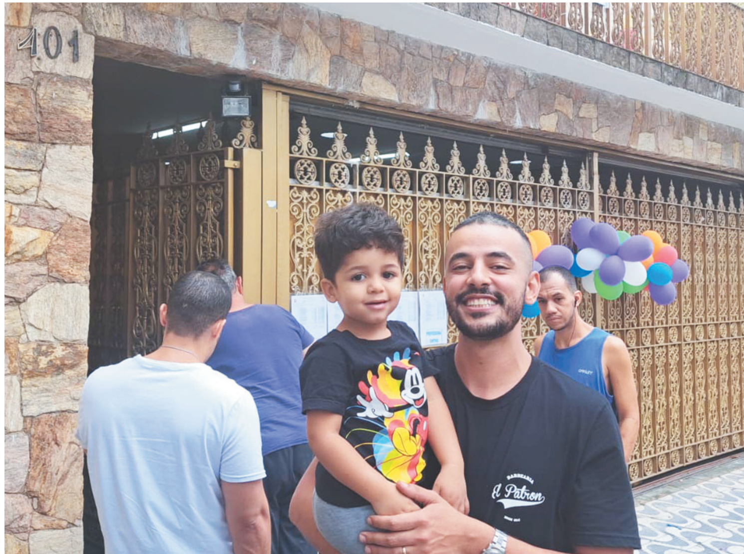
“Alívio”. “Alegria”. “Gratidão”. “Emoção”. Estes foram os principais sentimentos destacados pelos pais dos ex-alunos do Catarina Laboure, ao busca-los em sua “nova casa” – o CEI Ivette Atallah – no primeiro dia de aula. PÁGINA 3