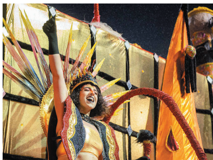
Humildade e trabalho devem trilhar bom caminho à Escola

“Esse ano nosso enredo é festa! Nós vamos falar das festas regionais do nosso amado Brasil, com um samba-enredo muito animado, que tem dois refrãos bem