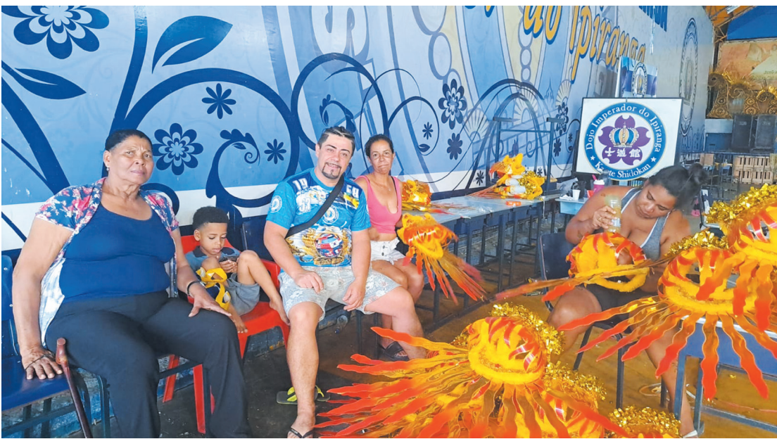
A expectativa dos representantes da escola é de confiança para subir ao Grupo de Acesso 1