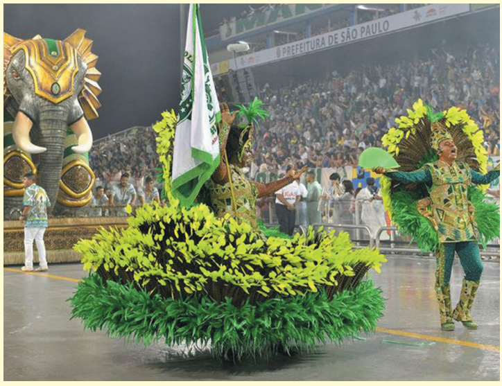
Vídeos serão lançados na ordem dos desfiles no Anhembi

Os 22 sambas-enredo das escolas do carnaval paulistano serão disponibilizados na Língua Brasileira de Sinais (Libras). A primeira tradução divulgada foi a da atual campeã do grupo especial, a Mancha Verde. A 7ª edição do Samba com as Mãos é uma parceria entre a Secretaria Municipal da Pessoa com Deficiência e a Liga Independente das Escolas de Samba de São Paulo (Liga-SP).