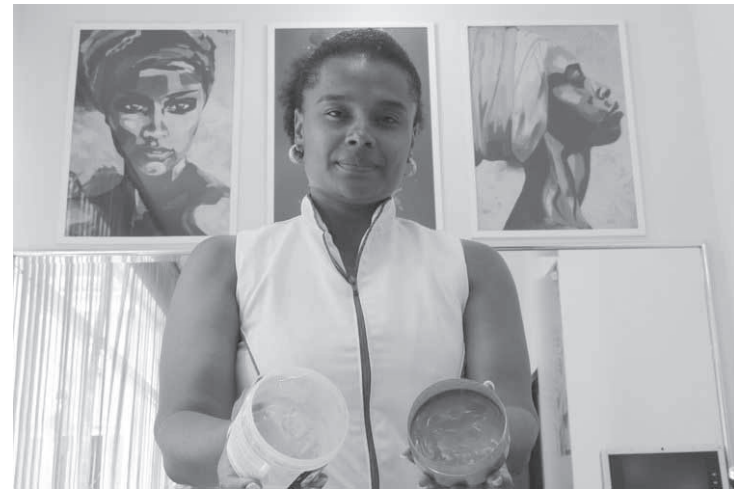
Produto é um cosmético usado para fixação de penteados

A Anvisa explica que a interdição das pomadas é uma medida cautelar que visa proteger a saúde da população e que permanece vigente enquanto são realizados testes, provas,