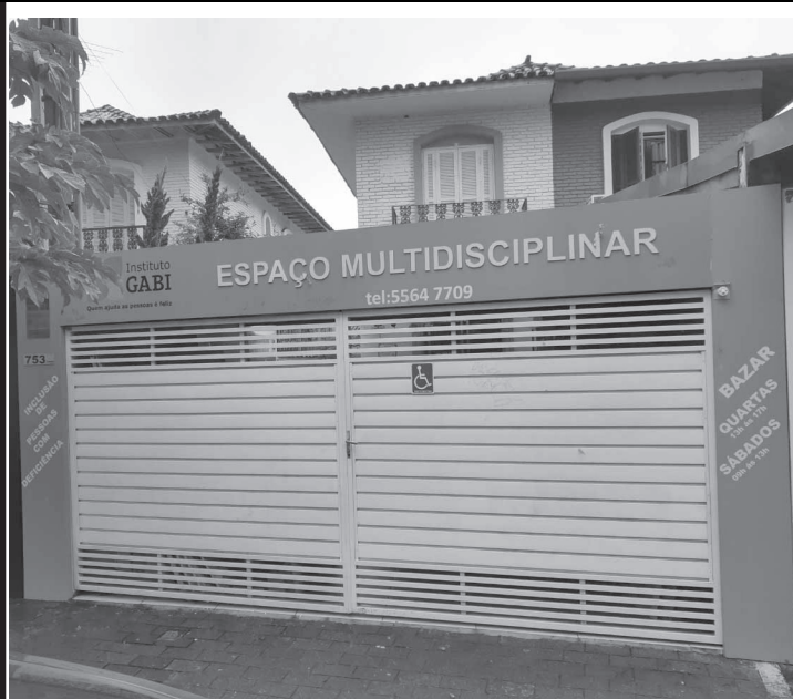
Local atende 36 pessoas, em maioria, deficientes no trabalho

O Instituto Gabi, comemora no dia 4 de fevereiro 22 anos de atuação no atendimento de pessoas portadoras de deficiência, principalmente portadores de síndrome de Down. Nesse período, o instituto promoveu a inclusão de pessoas com deficiência no mercado de trabalho, além de proporcionar melhora na qualidade de vida de outras dezenas de pessoas.