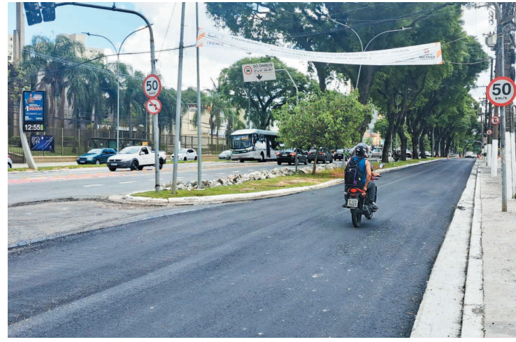
O contrato global da obra ficará vigente até o dia 21/03/2023 de recapeamento completos. Ainda segundo a empresa, 60% das obras de guia e sarjeta do segundo trecho da Dom Pedro I – pista central (ida) ainda entre as ruas

De acordo com informações da Fremix, o primeiro trecho a ser recapeado, foi a na pista lateral da avenida (ida) entre as ruas Tabor e General Eugênio de Melo e já teve 100% dos serviços de guia e sarjeta, que estavam danificadas, e já foram aplicados a primeira camada