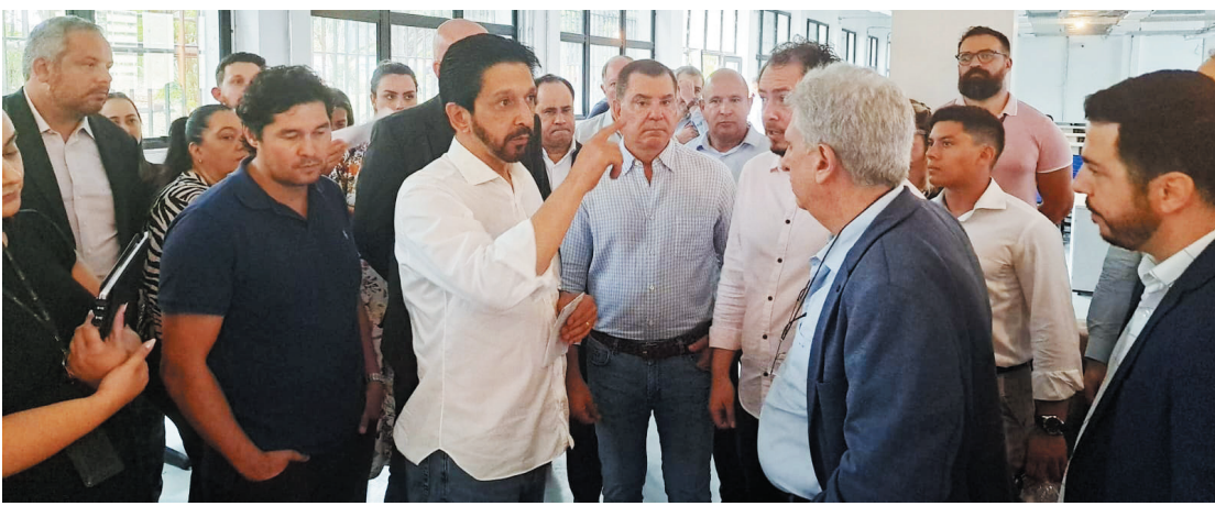
Unidade deverá ser inaugurada no final de fevereiro ou começo de março, segundo Ricardo