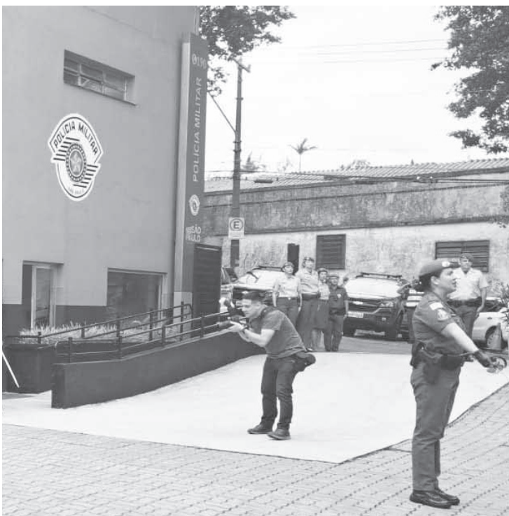
661 ocorrências foram atendidas no Batalhão com a Operação

Ainda segundo Thomazelli, na Operação, foram utilizados o efetivo que trabalha diuturnamente nas ruas e o efetivo administrativo, através de ações planejadas com inteligência. “Assim, nós identificamos os locais de maior incidência criminal, maior fluxo de pessoas e colocamos essas operações