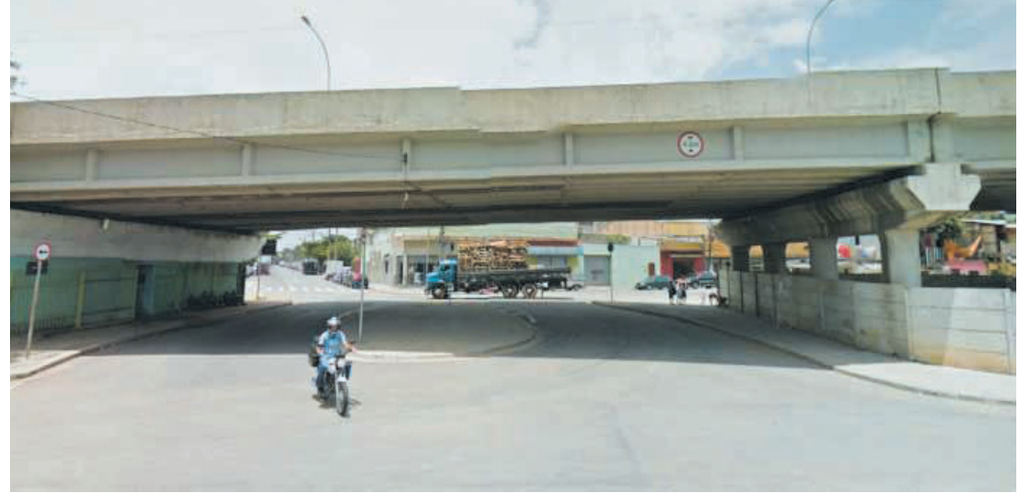
O Viaduto Imigrantes, localizado no Ipiranga, também está incluído nas obras previstas

As equipes da Prefeitura de São Paulo realizam periodicamente inspeções visuais nessas estruturas, fornecendo análise