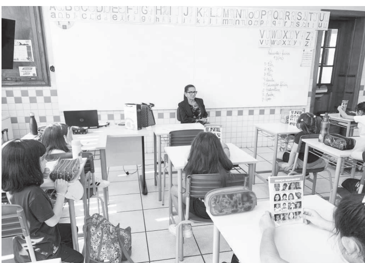
Mais de um terço dos desaparecidos no país têm até 17 anos