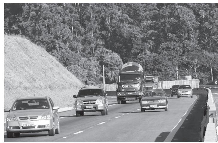
Operação visa garantir a segurança dos motoristas e pedestres

A Operação Estrada será implantada durante os feriados prolongados de Natal – de 21 a 26 de dezembro – e de Ano Novo – de 28 de dezembro de 2022 a 2 de janeiro de 2023.