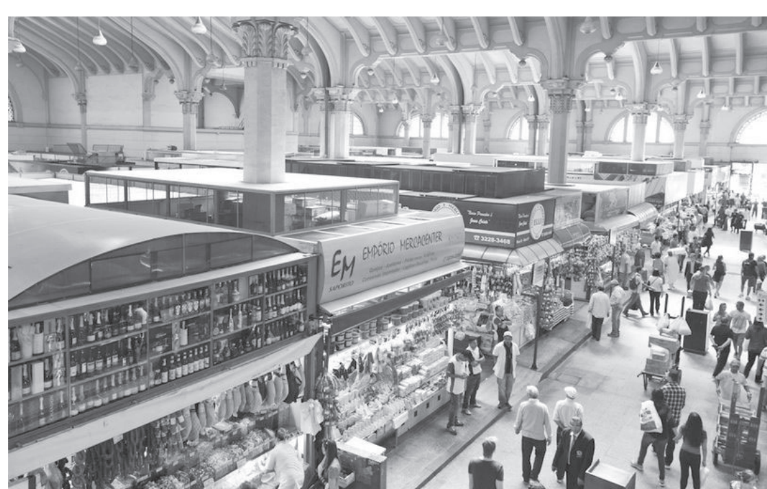
Horários adotados pela Prefeitura envolvem ambientes de lazer, saúde e transporte público

A imunização contra a Covid-19 está disponível para crianças de seis meses a 2 anos, 11 meses e 29 dias com comorbidades, deficiência permanente, imunossuprimidos e indígenas, além de crianças a partir de 3 anos, adolescentes e adultos. Para primeira dose adicional (DA1),