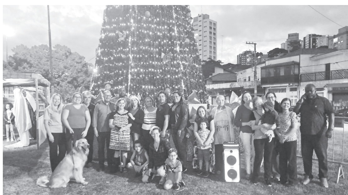
A decoração e iluminação de Natal estarão à disposição do público até o dia 6 de janeiro de 2023