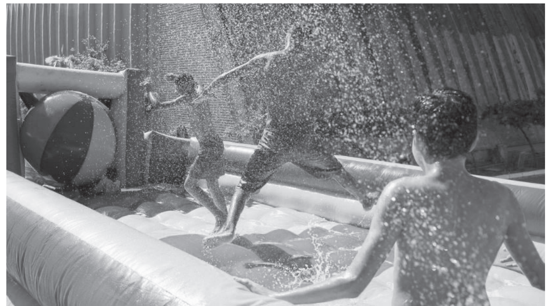
Além das atividades recreativas, as crianças e adolescentes receberão três refeições diárias

As inscrições podem ser feitas a partir desta terça-feira (1), até 30 de novembro presencialmente, nos polos de interesse, mediante