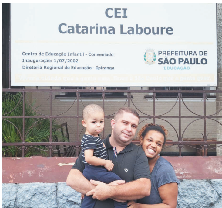
A medida preocupa os familiares dos 170 alunos do CEI

Essa “desculpa” não agradou muitas famílias que, apesar de reconhecerem o extraordinário trabalho desenvolvido pelas freiras, lembram que a contratação de pedagogas especializadas no atendimento de crianças, seria suficiente para que a Catarina Laboure não encerrasse suas atividades. Por outro lado, muitas famílias ficaram indignadas ao tomarem conhecimento que o prédio onde funciona a CEI já foi alugado e que o locatário tem pretensões de ocupar o edifício no dia 20 de janeiro de 2023 e o pior, no contrato, já existe uma cláusula dando prioridade de compra para a empresa locadora. “Isso é uma vergonha. Essa negociação já vinha acontecendo há muito tempo e, com certeza, o prédio já foi vendido. Essa história de que será alugar temporariamente é uma enganação”, disse a mãe de uma criança que vai perder a vaga na CEI e prefere não se identificar com receio de que sua filha seja prejudicada. “Trabalho aqui perto da Catarina. Deixo mi-