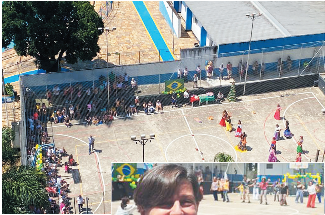
Práticas corporais da medicina chinesa e apresentação de ginástica rítmica foram duas de diversas atividades realizadas no local