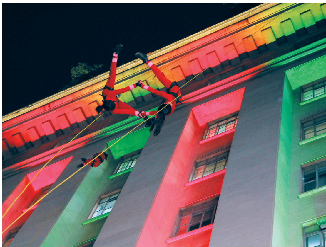
Com o tema "Encanto no Coração Paulistano", as atividades estarão por toda parte