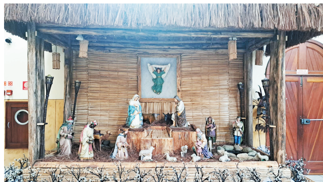
Desta vez, o cenário foi montado na lateral direita da Paróquia e estará à disposição até janeiro

O tradicional presépio com as imagens de Maria e José, mãe e pai adotivo de Jesus, os três reis magos, anjos, pastores, ovelhas, boi, camelo e