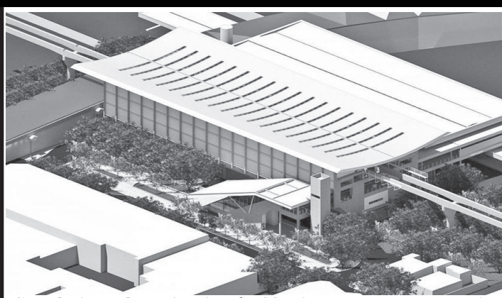
Consórcio terá o valor de R$ 488 mi para executar o serviço

O Consórcio Expresso Ipiranga, formado pela Alya Construtora e a Coesa Construção e Montagens, foi o vencedor para a construção da Estação Ipiranga, da Linha-15 Prata com o valor de R$ 448 milhões para executar o serviço, que também inclui as vias elevadas até a Vila Prudente. Os demais participantes foram o Consórcio ESB (Engenheiros Engenharia, S.A. Paulista de Construções e Comércio e a Benito Roggio e Hijos) estabeleceu um valor de R$ 449,8 milhões. Já o Consórcio Construtor Linha 15 -Prata (Heleno & Fonseca Construtiva e Nova Engenix) propôs um preço de R$ 507 milhões e por fim o AGIS Consórcio Linha