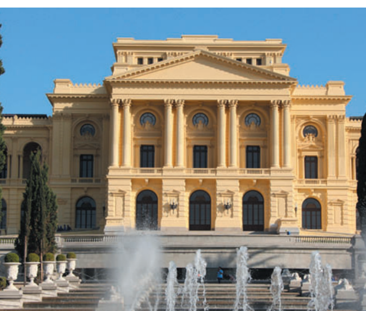
A partir de 18/11 estarão disponíveis os ingressos para as duas semanas seguintes

A medida busca reduzir as chances de contágio de Covid-19, uma vez que, a evolução da pandemia é dinâmica e, as orientações sobre novos procedimentos, serão atualizadas sempre que necessário.