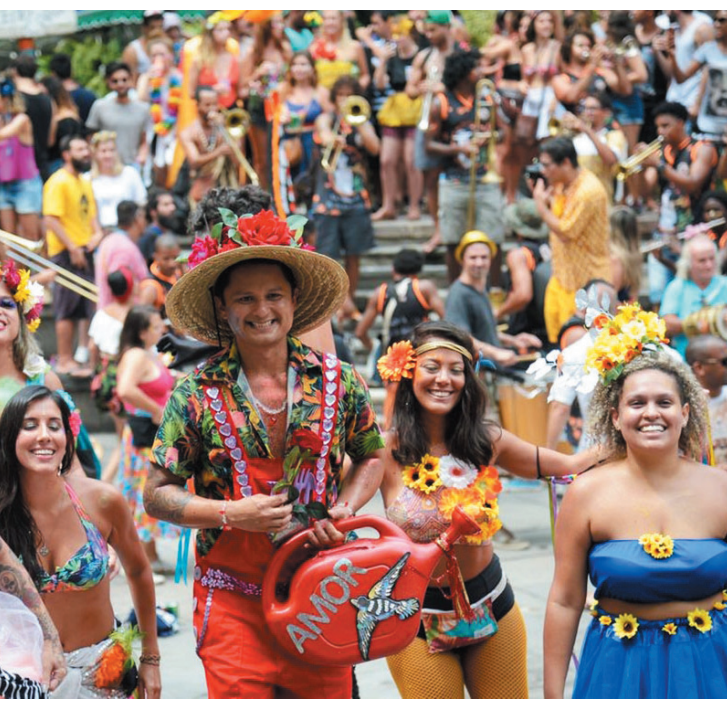
A Secretaria Municipal de Cultura (SMC), abriu inscrições para os blocos interessados em desfilarem no Carnaval de Rua 2023. Os responsáveis devem se inscrever até o dia 20 de novembro. PÁGINA 6