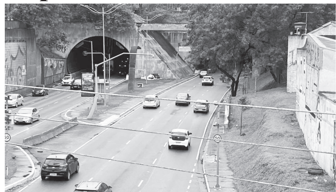
O complexo está situado na região da subprefeitura Jabaquara e é um importante conjunto de vias

A Secretaria Municipal das Subprefeituras (SMSUB), coordena o maior Programa de Conservação e Manutenção da Malha