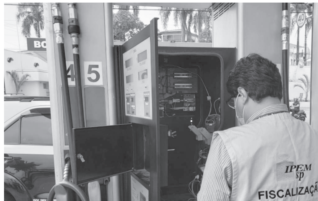
Os postos autuados têm até dez dias para apresentar defesa ao Instituto de Pesos e Medidas de SP

As fraudes e irregularidades foram detectadas no Trevo Serviços Automotivos localizado na Av. Padre Arlindo Vieira, 160, na Saúde, erros foram detectados nas 10 bombas medidoras de combustíveis verificadas pelos fiscais do Ipem-SP. As principais irregularidades foram erro de até 397 ml a cada 20 litros fornecidos em prejuízo ao consumidor, violação dos pontos de selagem dos instrumentos que permitiam acesso a parte eletrônica das bombas, corpo estranho instalado na bomba medidora, inclusive, com alterações em suas características, ficando em desacordo com a portaria de aprovação de modelo e localização de