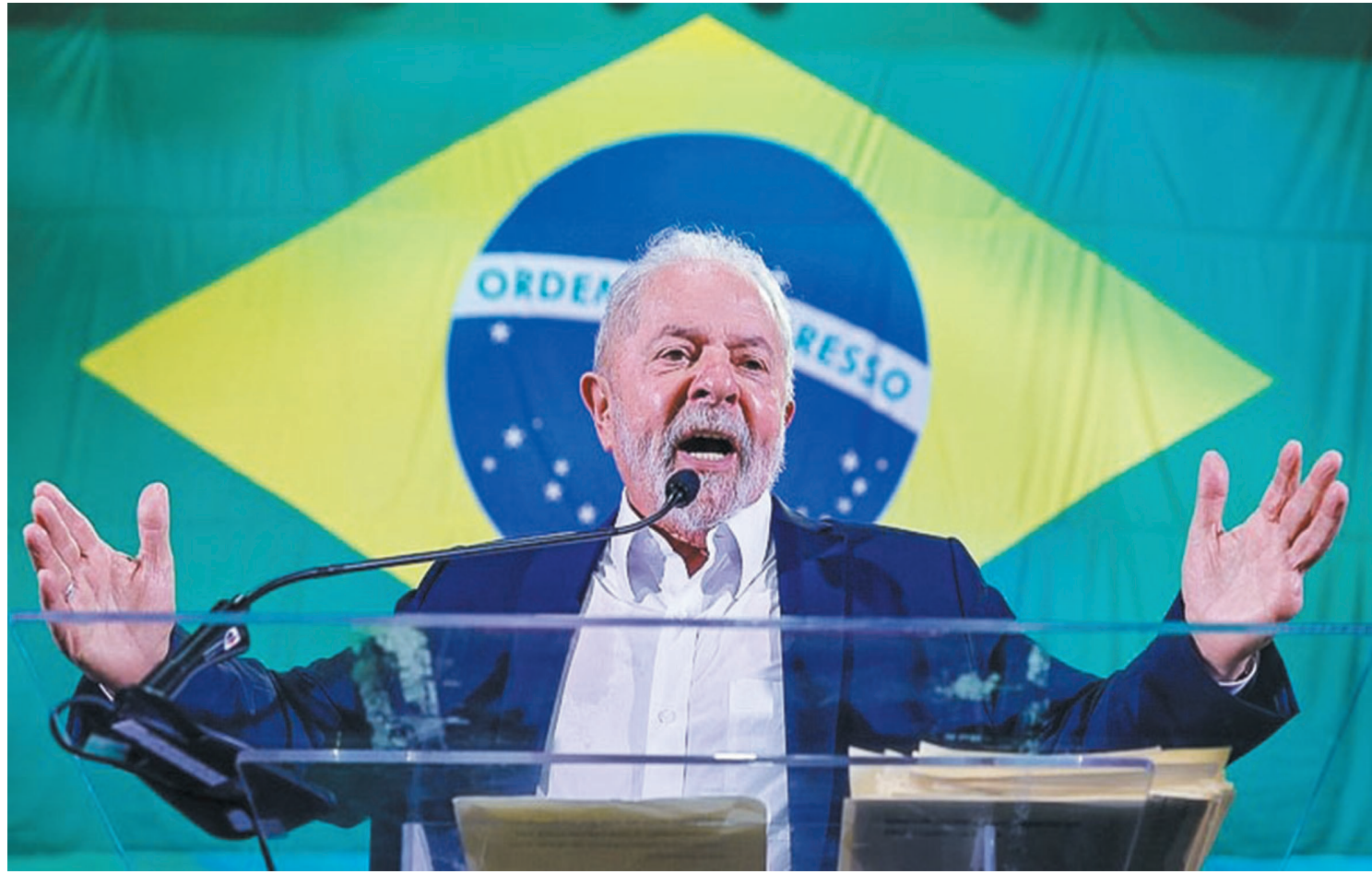
O presidente eleito, Luís Inácio Lula da Silva (PT), ganhou a eleição na região do Ipiranga e Cursorsino, derrotando o presidente Jair Bolsonaro (PL) que tentava continuar no cargo e seguindo a tendência dos paulistanos que deram uma significativa contribuição ao candidato petista para que ele conseguisse seu terceiro mandato para dirigir o Brasil. PÁGINA 3