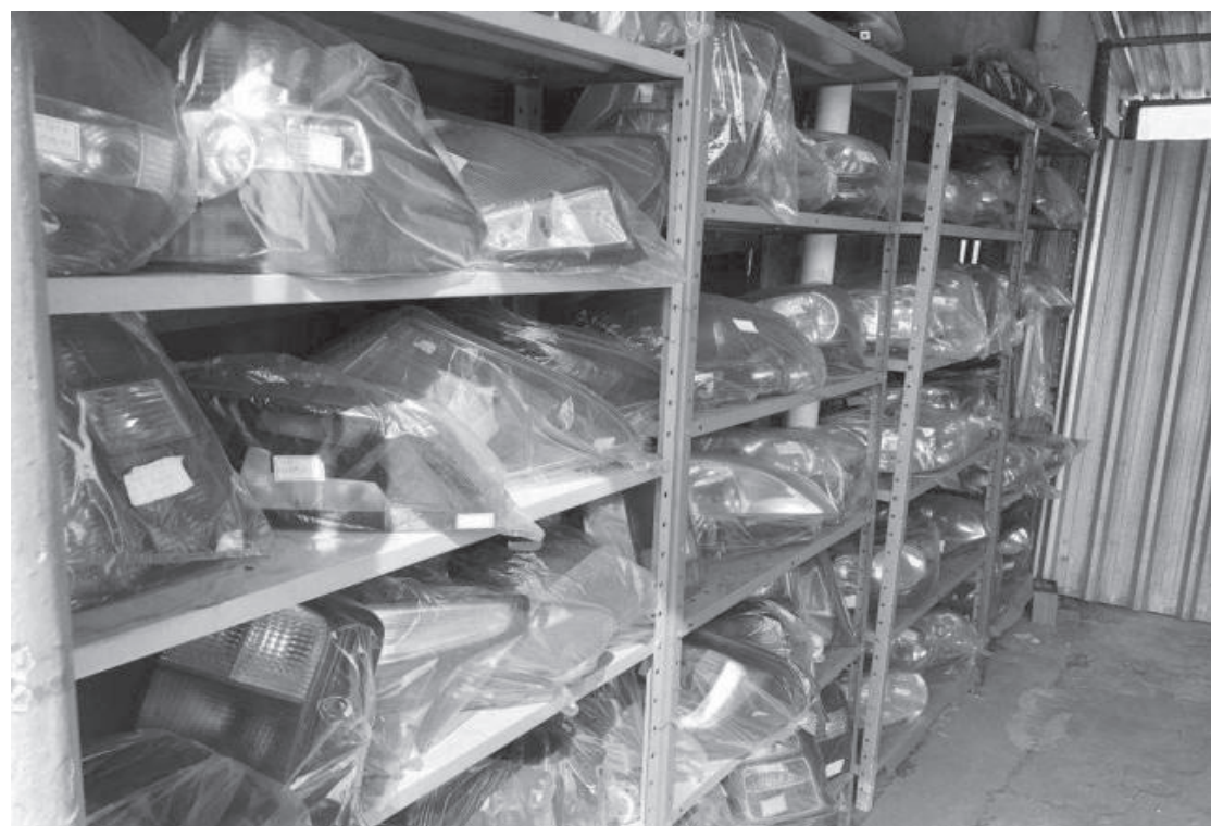
Os estabelecimentos receberam multas administrativas com valores entre R$ 2 e 8 mil

O órgão de trânsito reforça a importância de os cidadãos realizarem a consulta dos locais credenciados no portal do Detran.SP antes de efetuar qualquer serviço. A busca pode ser realizada em www.detran.sp.gov.br na aba de "Credenciados". Caso a empresa não seja encontrada durante a pesquisa, o procedimento não deve ser realizado naquele empreendimento. Além disso, é de absoluta importância exigir, sempre, a nota fiscal do serviço que foi realizado.