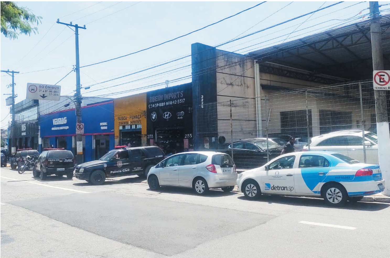
O Detran de São Paulo coordenou uma operação em conjunto com a Polícia Civil em três desmontes não credenciados e oito credenciados junto ao órgão de trânsito, que funcionavam na avenida Cursorsino, região da Saúde. A ação ocorreu nesta quinta-feira (27). PÁGINA 3