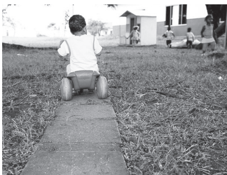
O limite de idade estabelecido pela Lei é 18 anos, podendo ser estendido

As crianças e jovens que serão beneficiadas precisam estar matriculados em uma instituição de ensino na Capital e inscritos no Cadastro Único