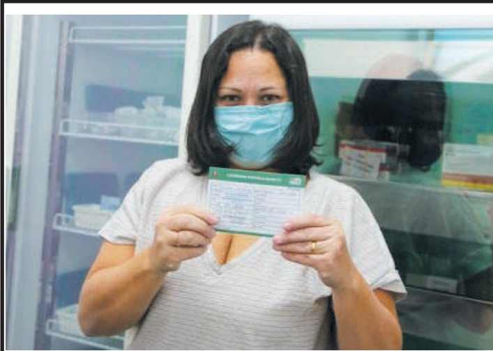
Servidores estaduais vão apresentar comprovante de vacina

Os mais de 570 mil servidores público estaduais de São Paulo estão obrigados a apresentar comprovante de vacinação completa contra a COVID-19. A medida é obrigatória para os profissionais da ativa em órgãos de administração direta e indireta do Estado de São Paulo e deve ser cumprida até o próximo domingo (9).