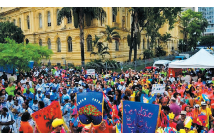
As bandas estão autorizadas a fazer carnaval de rua

Mesmo anunciando que a decisão final a respeito da realização do Carnaval em São Paulo esse ano só sairá em meados de fevereiro, a Prefeitura anunciou, no final do ano passado a aprovação final dos desfiles para o Carnaval de Rua 2022. Estão autorizados 696 desfiles, o maior número na história da capital.