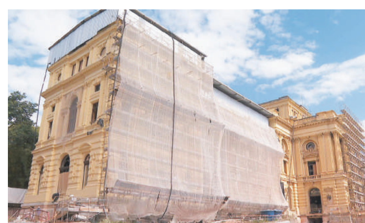
A restauração da fachada do Museu chega ao final

Atualmente, quem passa em frente ao Museu pode observar o avanço das obras. Na facha-