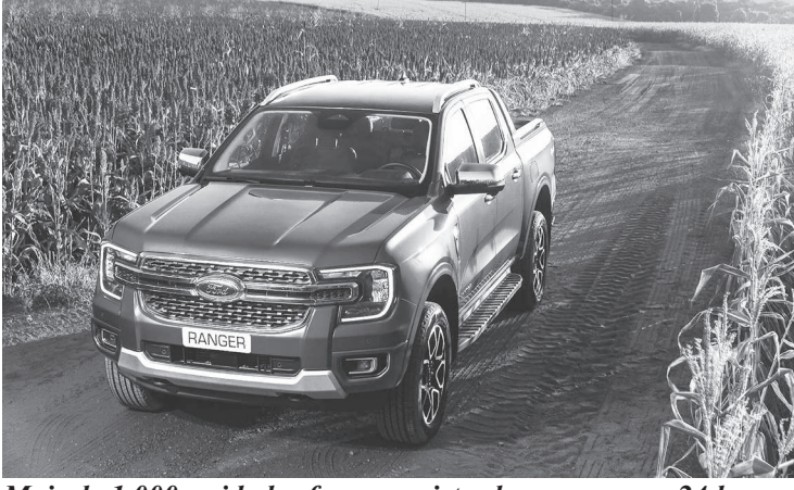
Mais de 1.000 unidades foram registradas em apenas 24 horas

segmento, com acesso sem fio para Android Auto e Apple CarPlay e carregador por indução, entre outros equipamentos. A Ranger Limited oferece ainda um kit opcional de equipamentos com painel de instrumentos digital de 12,4", rodas de liga leve de 20" e um pacote de tecnologias de assistência exclusivas, que incluem piloto automático adaptativo com stop & go, assistente de frenagem de ré, monitoramento de ponto cego com cobertura de reboque e câmeras 360°, entre outras.