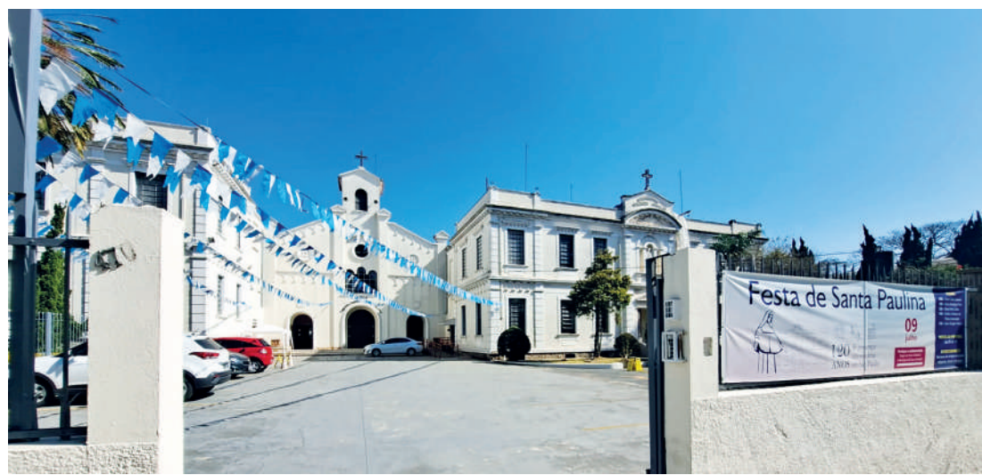
Missa Religiosa contará com a presença de Dom Odilo Scherer na data do festejo da Santa

A Congregação cresce nos estados de Santa Catarina e São Paulo. Em 1909, as Irmãs assumem a missão evangeliza-