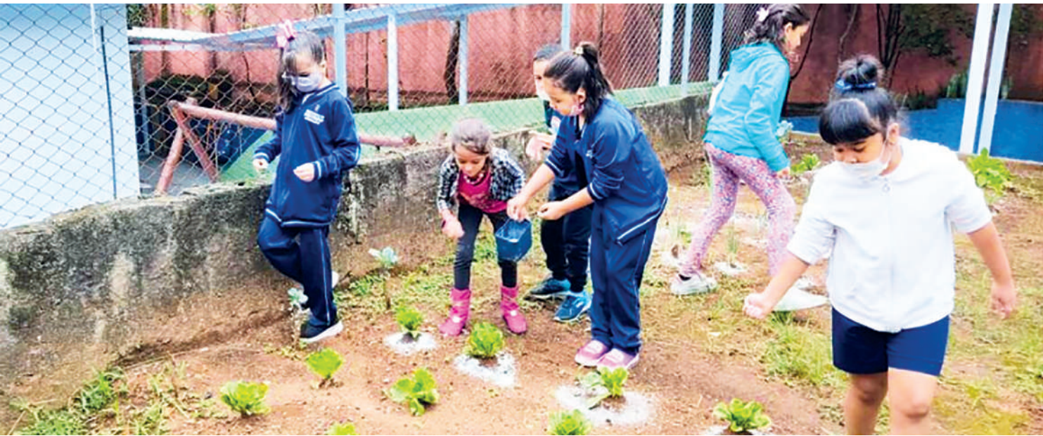
Espaço, cuidado por alunos e professores, é trabalhado sob diferentes abordagens, contempladas pelo projeto pedagógico da escola

Na horta cultivada na Escola Municipal Professora Sylvia Martin Pires podem ser colhidos temperos, verduras, legumes, frutas e muito aprendizado. O espaço, cuidado por professores e estudantes é trabalhado sob diferentes abordagens, contempladas pelo projeto pedagógico da escola, que fica na Vila Moraes.