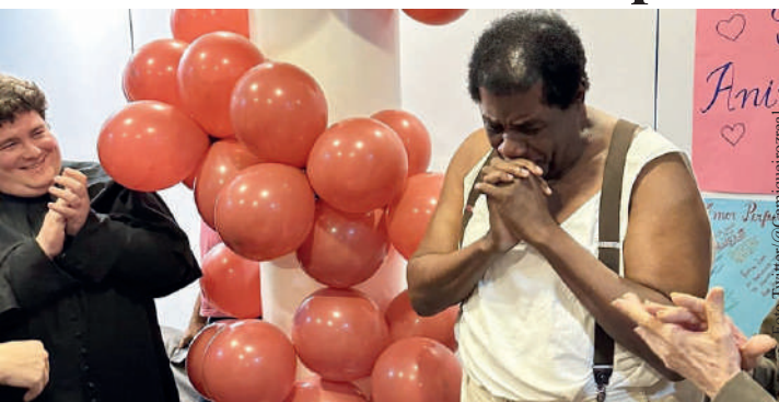
A festa contou com balões vermelhos e mimos dos colegas

Cantor de soul e amigo de Tim Maia na época em que ambos moraram nos Estados Unidos, Tony ganhou o Festival Internacional da Canção em 1970 ao cantar a música “BR 3”