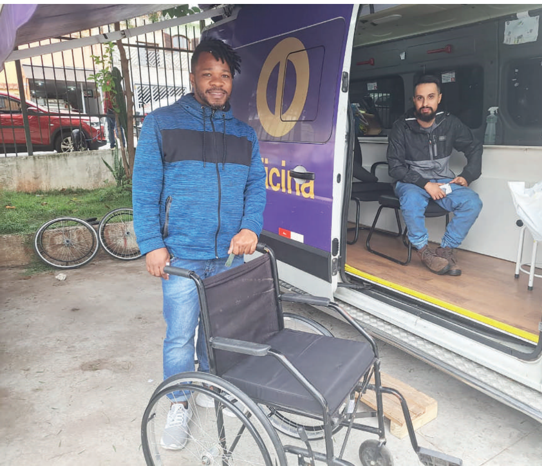
Ação acontece duas vezes por mês, na calçada do Hospital Dia Flávio Gianotti, no Ipiranga

Um serviço considerado de utilidade pública e que beneficia, principalmente, pessoas de baixa renda é o Paraoficina Móvel, iniciativa da prefeitura de São Paulo. Nesta terça-feira (30), esse serviço é inteiramente gratuito, uma van da Paraoficina Móvel, com conta com serviços gratuitos de manutenção e reparo em cadeiras de rodas