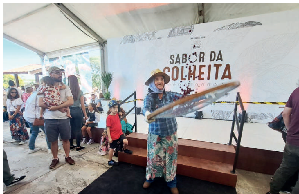
Mulher com roupa típica de cafeicultora encenou como fazer para abanar o café

Cerca de dois mil pés de café são cultivados no Instituto Biológico em sistema orgânico. Fundado em 1928 para estudar a broca do café, praga que assolava as plantações paulistas, o IB sempre teve a cultura em seus objetos de pesquisa. Daí a importância da implementação de seu cafezal, cerca de 28 anos após a fundação do Instituto, e que até hoje serve para a condução de estudos relacionados a pragas e doenças.