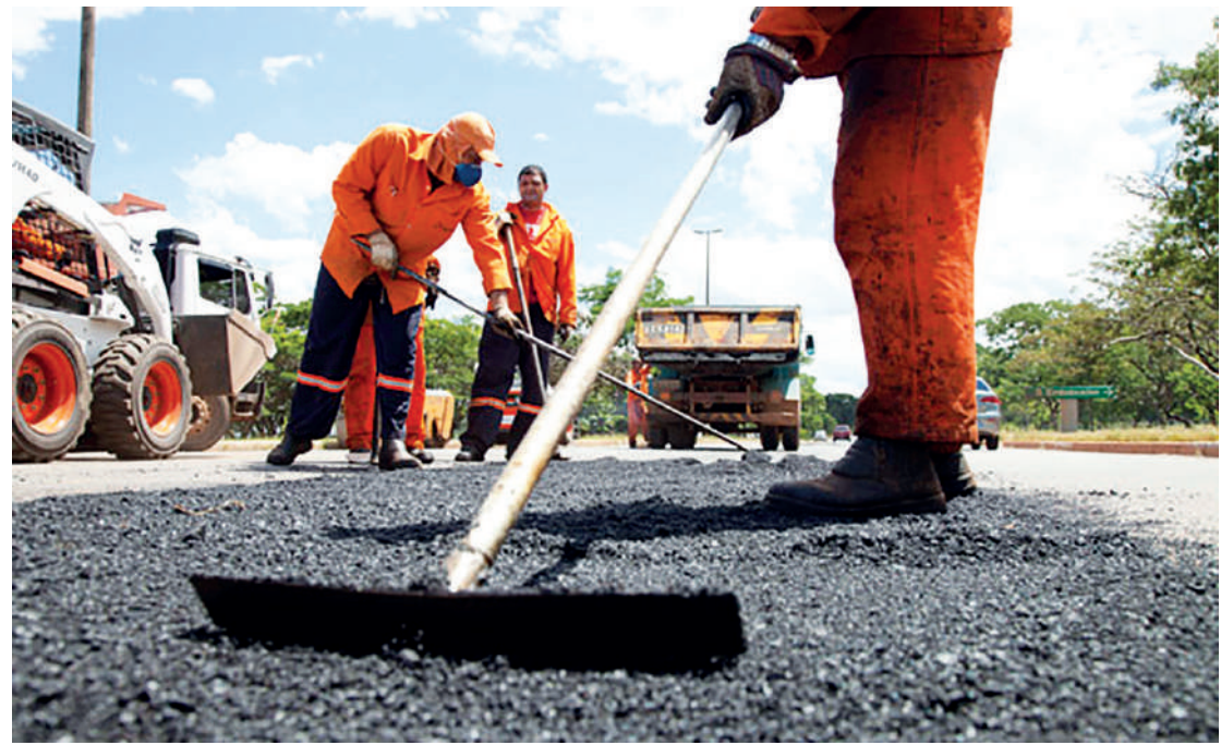
Serviço será realizado em 7 dias e não deverá abranger locais recapados recentemente

Ao final do sétimo dia (12), o objetivo é que as equipes se encontrem e finalizem toda a região. “É um trabalho inusitado. Uma ação inovadora. Aqui no Ipiranga, nós nunca tivemos – pelo menos que eu tenha conhecimento – mais do que três equipes trabalhando. Teremos 25, trabalhando 24 horas por dia, 7 dias consecuti-