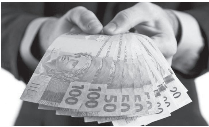
Consumidor também foi alavancado pelos recursos do FGTS

O saque emergencial do Fundo de Garantia por Tempo de Serviço (FGTS) e a antecipação do pagamento do décimo terceiro salário para aposentados e pensionistas do Instituto Nacional do Seguro Social (INSS) contribuíram para a alta, em maio, da Intenção de Consumo das Famílias (ICF). O indicador da Federação do Comércio de Bens, Serviços e Turismo do Estado de São Paulo (FecomercioSP) subiu 4,1% e registrou 80 pontos. Embora ainda indique insatisfação, pois está abaixo dos 100 pontos numa escala que vai de 0 a 200, este é o maior patamar do ICF desde abril de 2020 (98,8). Na comparação anual, o crescimento foi de 18,9%. As sete variáveis que compõem o indicador registraram crescimento no mês, mas os itens Emprego Atual e Perspectiva Profissional se destacaram, crescendo 5,1% e 6,5%