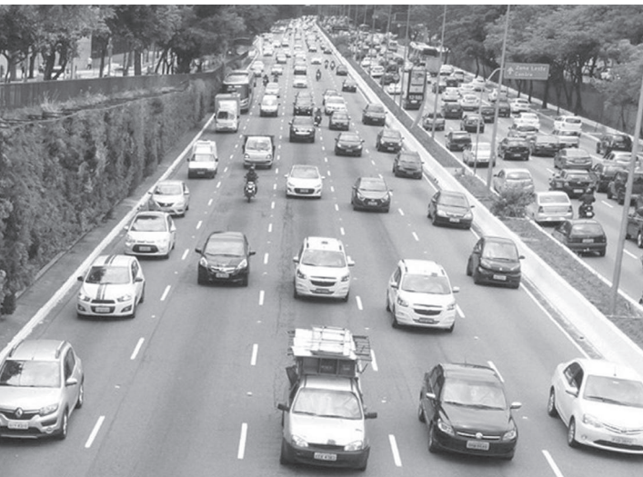
A Prefeitura também suspendeu o expediente na administração

O Rodízio Municipal de Veículos estará suspenso tanto na quinta como na sexta-feira. A Prefeitura também suspendeu o expediente na administração Direta, Autárquica e Fundacional, na sexta-feira (17). O Decreto nº 61.428 foi publicado no Diário Oficial desta quarta-feira (15) e prevê a instituição de plantão, nos casos julgados necessários, a critério dos titulares dos órgãos.