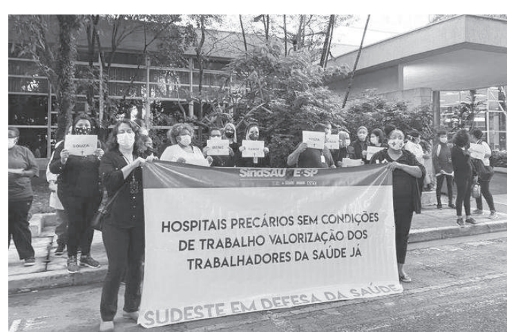
Moradores reclamam da falta de atendimento adequado no local

Moradores de Heliópolis, São João Clímaco e Vila Cariocae funcionários da Saúde, realizaram uma manifestação em frente ao Complexo Hospitalar de Heliópolis protestando pela superlotação e da falta de atendimento no pronto-socorro. A unidade fechou as portas para pacientes e somente casos graves passaram a ser atendidos no local.