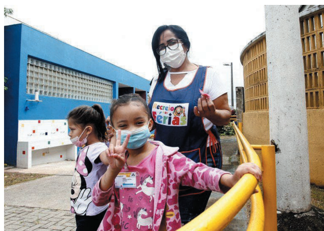
Retomada do projeto terá atividades culturais e educacionais em sua programação para às crianças

Os espaços seguirão todos os protocolos de prevenção contra a Covid-10, como uso de máscaras e aferição de temperatura. Nesta edição, que será chamada de “Recreio nas Férias: um novo jeito de brincar!”, ainda por conta da pandemia, cada unidade irá organizar a sua rotina e dinâmica de atividades, priorizando as que possam ser realizadas de forma individual, mas mantendo o caráter lúdico, social e de pertencimento entre todos.