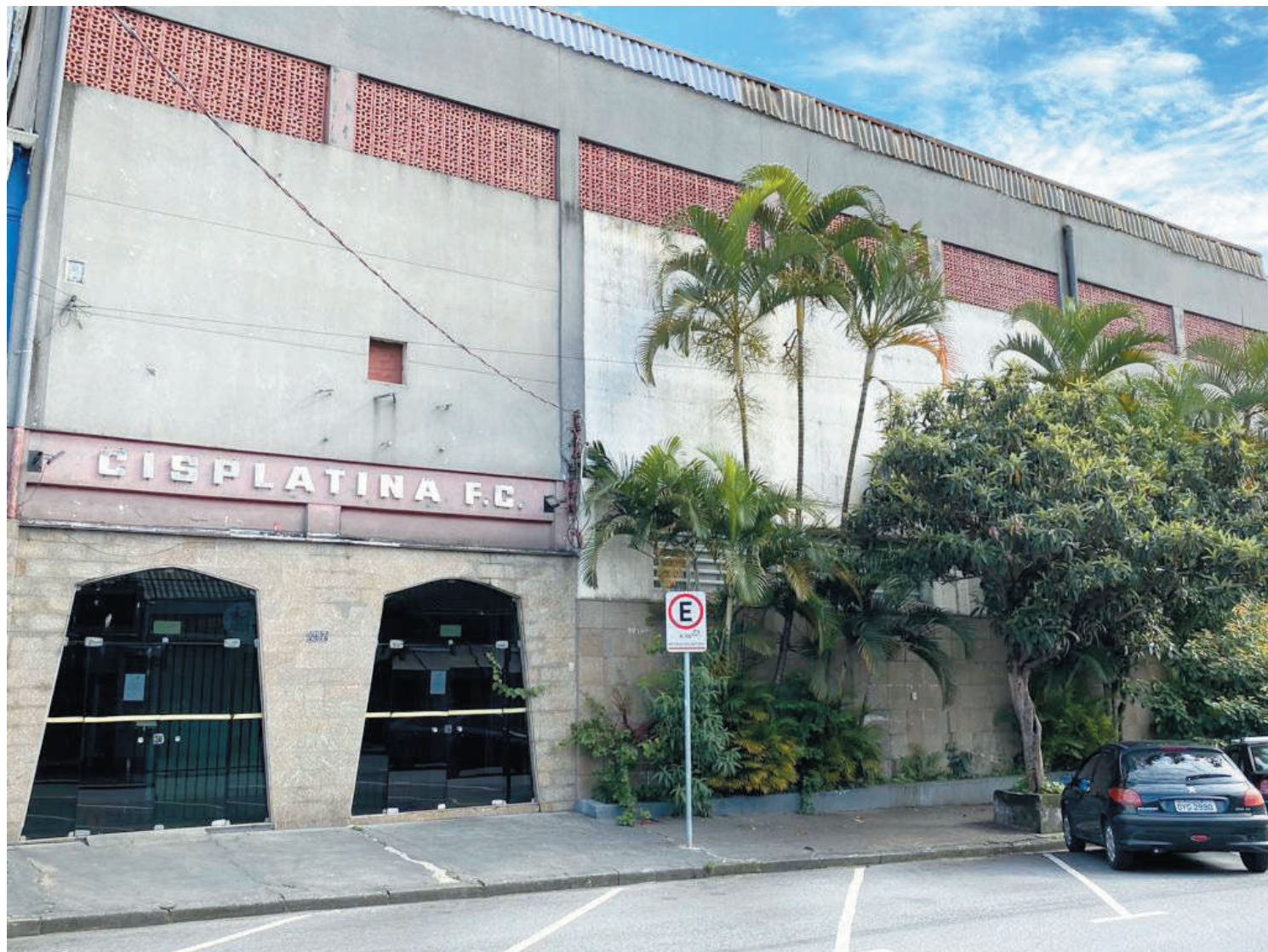
Tradicional agremiação do bairro muda de local após 93 anos. Clube estará na mesma rua, mas em um espaço menor ao anterior

Ao contrário do que muitos imaginam, o nome do clube não está ligado a existência da rua Cisplatina mas sim a Província Cisplatina, hoje um País chamado Uruguai, nosso vizinho. Um território pequeno mais com solo rico em minérios (prata, por exemplo), já fez parte do território brasileiro por quatro anos (1821-1825) quando o Brasil ainda era o Reino Unido de Portugal, Brasil e Algarves e posteriormente Império do Brasil, sob o comando de Dom