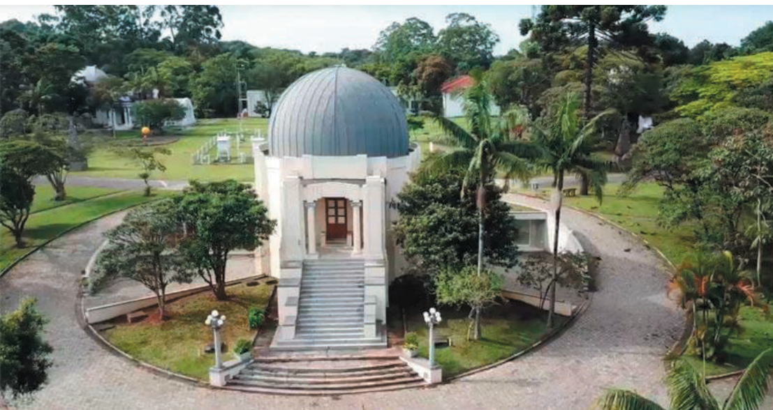
Local é composto por 120 hectares de mata nativa que podem servir como trilha aos visitantes

O Parque de Ciência e Tecnologia da USP (Cintec) reabriu para a visitação na Água Funda, capital paulistana. Além da reserva de 120 hectares de mata nativa, que pode ser aproveitada com um passeio na Trilha do Lago, os visitantes poderão se divertir e aprender na área externa do parque. Lugar agradável e bucólico, o Parque Cintec é uma boa opção de visita nesse período de férias.