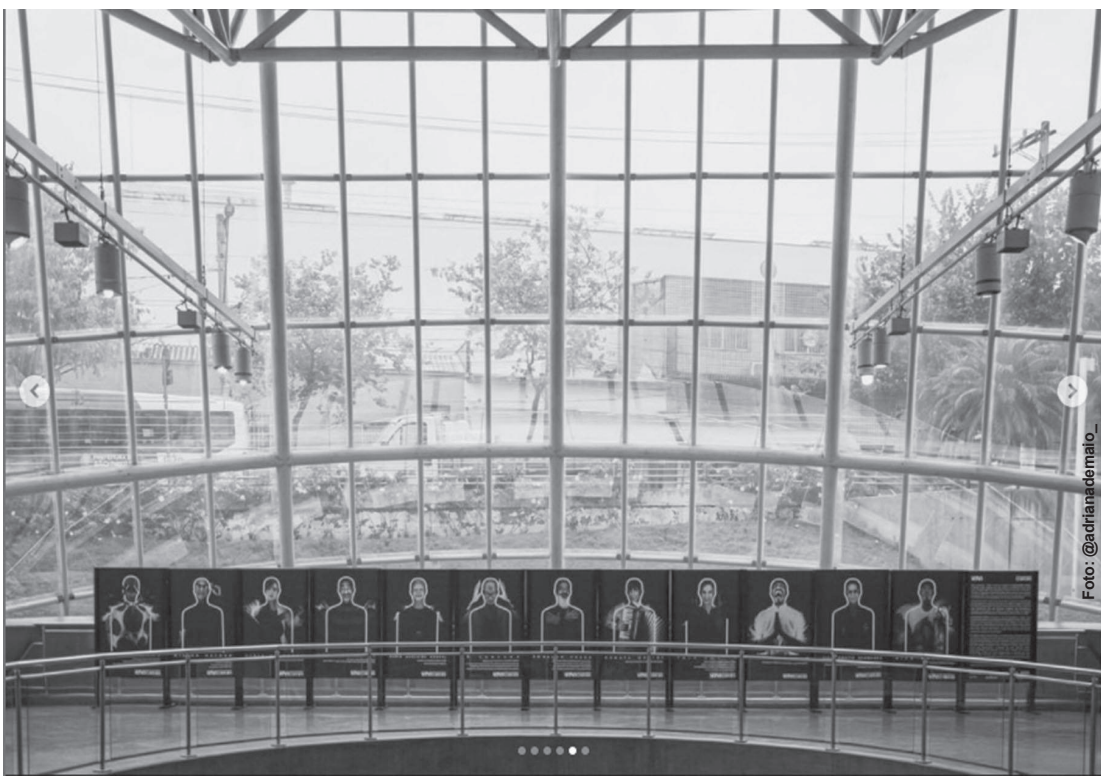
Mostra denominada UNI explica a luz dentro da fotografia revelando a iluminação da diversidade