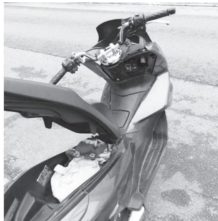
Jovem portava drogas e estava com veículo roubado na região

O excelente trabalho realizado pela Polícia Militar do Estado de São Paulo resultou, na madrugada de terça-feira (11), na apreensão do menor BGN, de 14 anos. BGN foi detido em Americanópolis, quase na divisa com Diadema, quando estava em uma moto PCX 150, roubada e com cerca de 200 trouxinhas de droga, entre maconha, cocaína e crack. A moto havia sido roubada na região de interlagos, na primeira quinzena de dezembro. A vítima, que não quis se identificar, relatou o momento de tensão vivido com o assalto. “Eu estava chegando em casa e fui abordado por três indivíduos que anunciaram o assalto, não tive reação nenhuma, na hora eu nem conseguia falar”, disse.