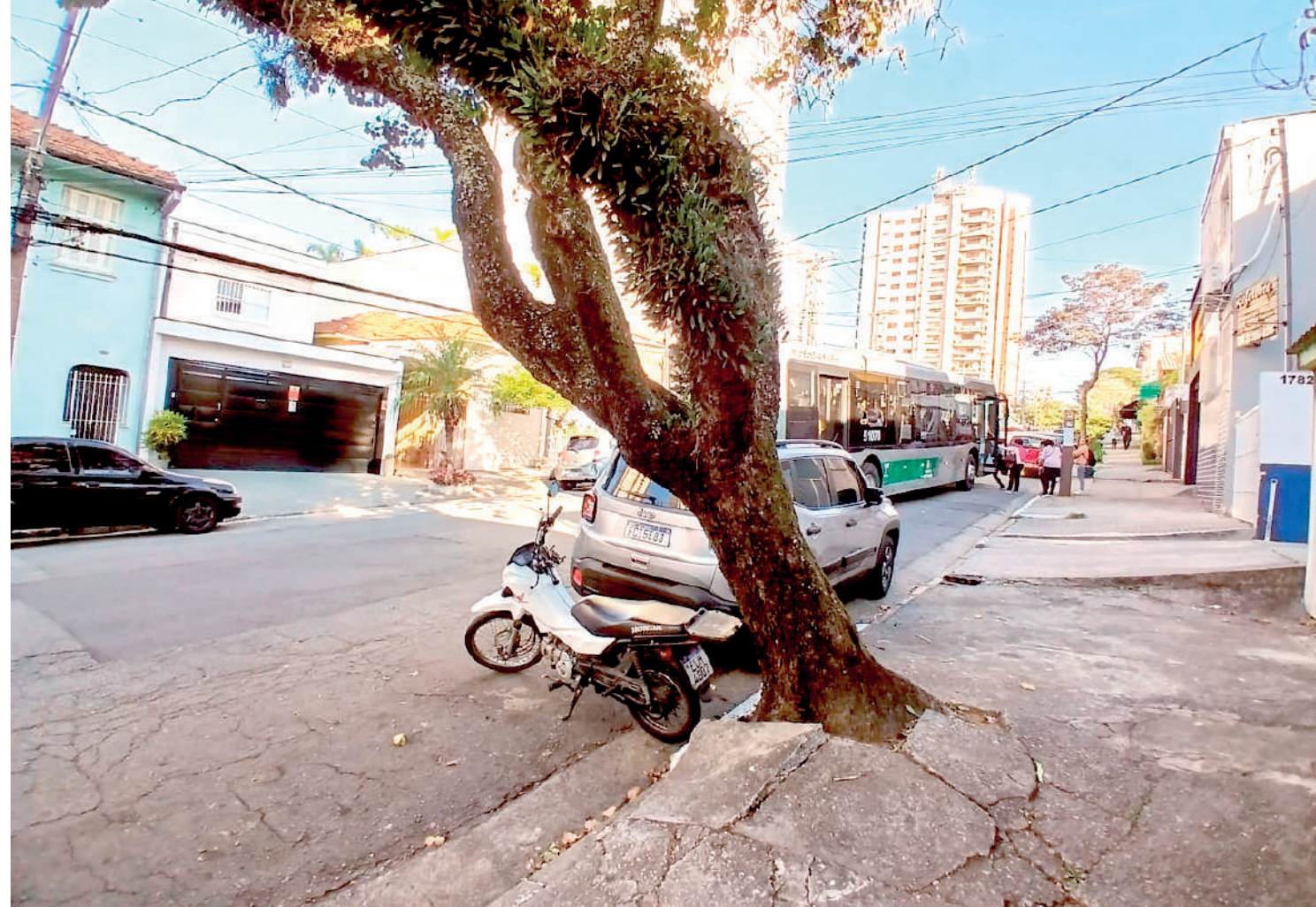
Uma árvore caindo na Rua Costa Aguiar tem atormentado os vizinhos. A árvore, que fica na calçada do número 1.778, “está cada vez mais tombada”, de acordo com as pessoas ouvidas pela reportagem. A situação, preocupa, inclusive, pedestres e motoristas que trafegam pelo local. PÁGINA 4