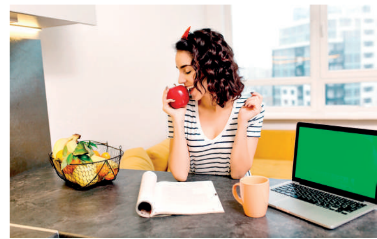
Alimentação é mais poderosa linha de defesa contra os radicais livres

Um dos processos mais prejudiciais ao organismo, relacionado ao consumo de açúcar, é a glicação. Trata-se de uma reação química em que moléculas de glicose se ligam a proteínas saudáveis, resultando na formação de AGEs (Produtos Finais de Glicação Avançada). Esses compostos comprometem a estrutura das proteínas, tornando-as menos eficazes em