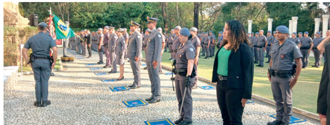
Cerimônia reuniu policiais militares da região nos jardins do histórico Palácio dos Cedros

Uma grande festa realizada no histórico Palácio dos Cedros celebrou os 50 anos do Comando de Policiamento de Área Metropolitana Dois, que está localizado na 17ª Delegacia, e é responsável por promover a segurança do Ipiranga e adjacências.