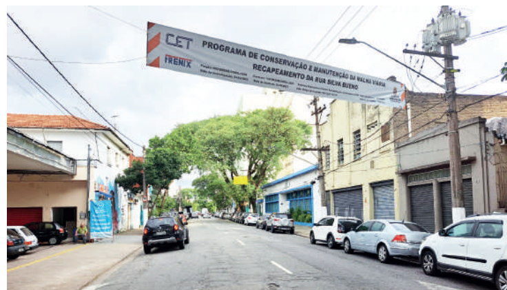
Serviços deveriam ter começado no dia 20 de abril

A Prefeitura deu início ao recalpeamento da rua Silva Bueno, uma das principais vias de acesso ao bairro e também a principal rua comercial do Ipiranga. O recalpeamento da Silva Bueno faz parte do programa da Prefeitura para recalpear as principais vias da cidade, com investimento de aproximadamente 1 bilhão. Acontece que, de acordo com as faixas colocadas ao longo da via, os serviços deveriam começar no dia 20 de abril, mas apenas nesta quarta-feira (9) é que guias, sarjetas e calçadas começaram a ser realizados em um pequeno trecho da via.