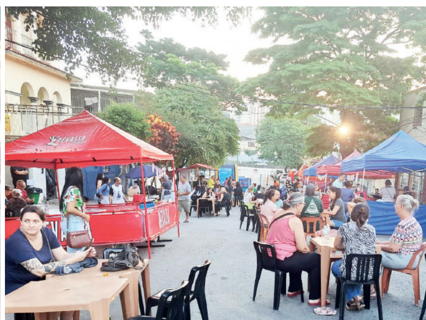
Festejos foram os primeiros oficiais após o Santo ter se tornado o segundo padroeiro oficial da Igreja, em setembro de 2022

Centenas de fiéis e devotos compareceram à Paróquia Nossa Senhora das Dores, que fica na Rua Tabor, 283, para comemorar a festa de São Peregrino, que aconteceu no último final de semana (6 e 7/05), com alegria, fé animação e emoção.