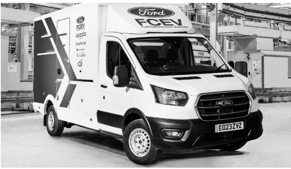
Líder do mercado de vans, a Ford se uniu a outras empresas líderes em tecnologia automotiva

A Ford está testando no Reino Unido uma nova versão da van elétrica E-Transit que usa eletricidade gerada por células de combustível de hidrogênio, em vez de bateria convencional. Essa tecnologia tem potencial para atender, principalmente, veículos comerciais maiores e mais pesados, em aplicações que requerem maior autonomia e uso intensivo de energia, com emissões zero.