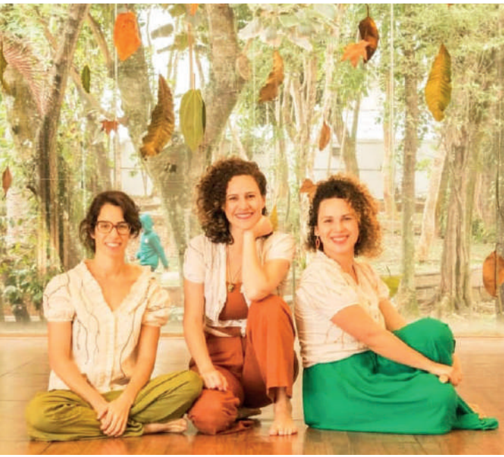
A programação começa às 11h, com "Sensibilizações Dançadas: Voo, Pausa e Revoada" Já às 14h é a vez da apresentação "Revoada"

Nesse domingo o Sesc Ipiranga esta com uma programação voltada para as crianças. Serão duas atividades lúdicas com o grupo Coletivo Corpo Aberto.