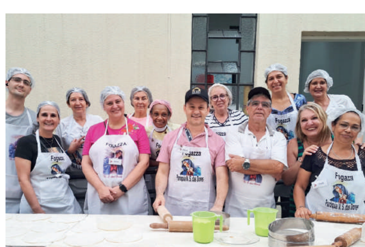
Voluntários (foto) da tradicional barraca da Fogazza