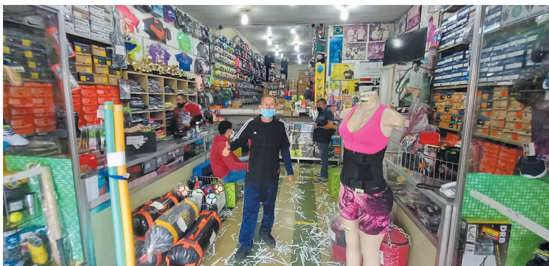
Os comerciantes da região estão entusiasmados com o crescimento das vendas

Após um longo período de turbulência, no qual praticamente todas as lojas e varejos da região tiveram que permanecer fechados, ou com horário reduzido, por conta da pandemia do coronavírus, o comércio, enfim, começa a dar sinais de recuperação no segundo semestre de 2021. As lojas da área mais movimentada do Ipiranga, na rua Silva Bueno, registraram nessa semana um ritmo frenético de vendas visando o dia dos pais.