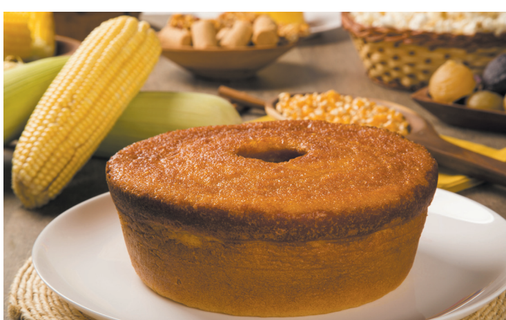
O Bolo de Fubá é sempre bem-vindo à mesa

Ingredientes: 1 copo de fubá mimoso; 1 copo de farinha de trigo; 1 copo de leite; 1 e 1/2 copos de açúcar; 1 xícara (chá) de óleo; 3 ovos; 1 colher (sopa) de fermento em pó; sementes de erva doce a gosto. Preparo: Bata os ingredientes no liquidificador, junte as sementes de erva doce e despeje a massa em forma untada e enfarinhada. Leve ao forno preaquecido (200º) e asse durante 35 minutos. Retire do forno. Espere esfriar e desenforme. Polvilhe com açúcar e sirva a seguir.