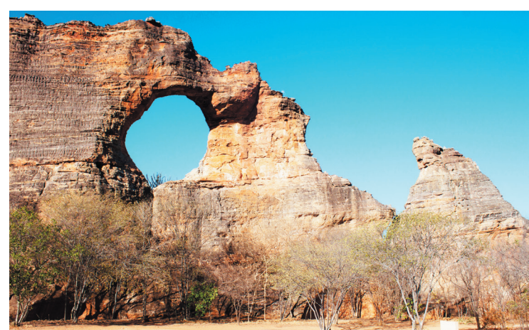
A região foi considerada como patrimônio cultural da humanidade

Em 1991 a UNESCO, pelo seu valor cultural, inscreveu o Parque Nacional na lista do Patrimônio Cultural da Humanidade. Em 2002 foi oficializado o pedido para que o mesmo fosse declarado Patrimônio Natural da Humanidade. Existe quatorze circuitos compostos por várias trilhas para acessar os sítios arqueológicos e lugares de interesse natural para visitar monumentos geológicos,