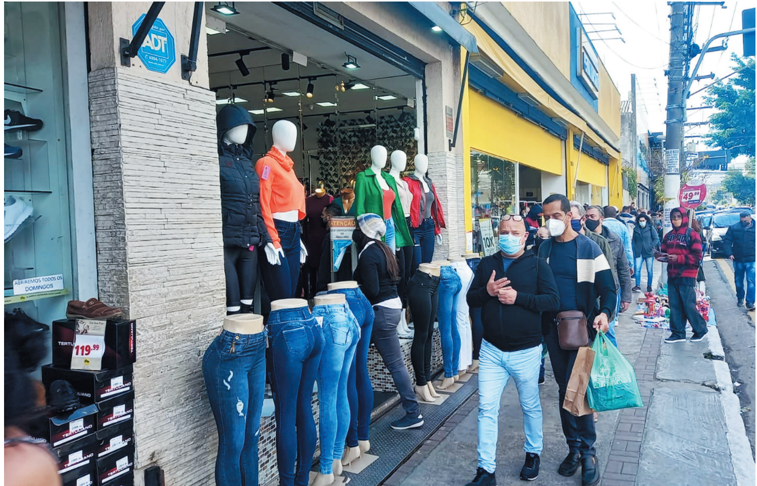
Comerciantes esperam que o movimento das vendas no Dia dos Pais supere 2020. PÁGINA 3