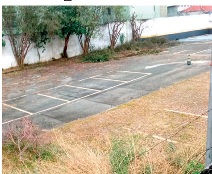
Problemas com local são denunciados desde o começo do ano

Mas, com a falta de zelo e de atenção da LB Bens, muitos moradores já desistiram de reclamar e vivem em constante medo. “O pessoal se cansa e fica com medo. Eu não consigo me conformar com uma coisa dessas. Não é certo”, expôs ainda, a fonte citada.