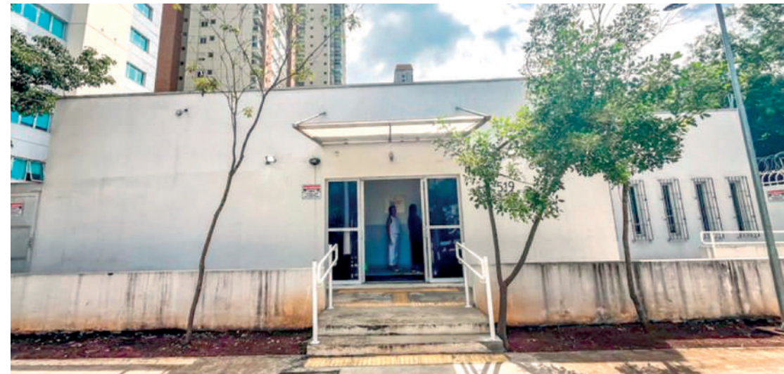
Está funcionando no Sacomã o Centro de Controle Populacional Animal (CCPA) para esterilizar cães e gatos. Instalado em imóvel cedido pela Prefeitura de São Paulo à ONG Ampara Animal para castrar cães e gatos gratuitamente. PÁGINA 4