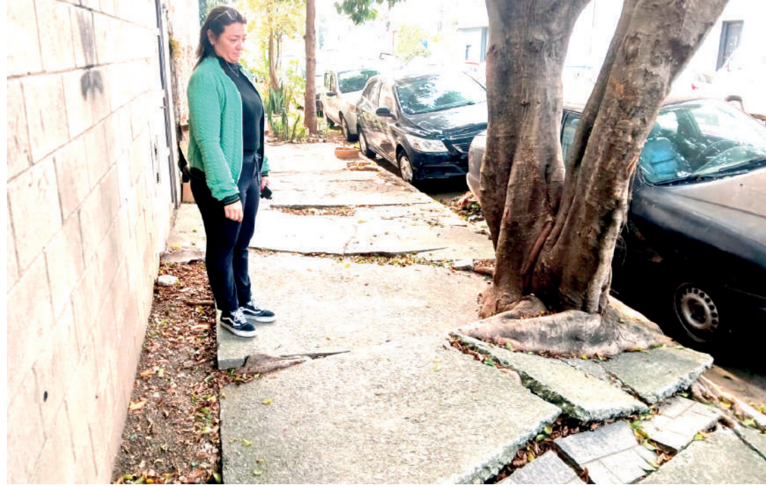
Após a reportagem sobre o drama da idosa com os galhos de uma árvore que estão invadindo sua residência na General Lecor, outras denúncias a respeito de espécies malculidadas ou que estão colocando em risco a vida das pessoas foram proferidas. PÁGINA 3