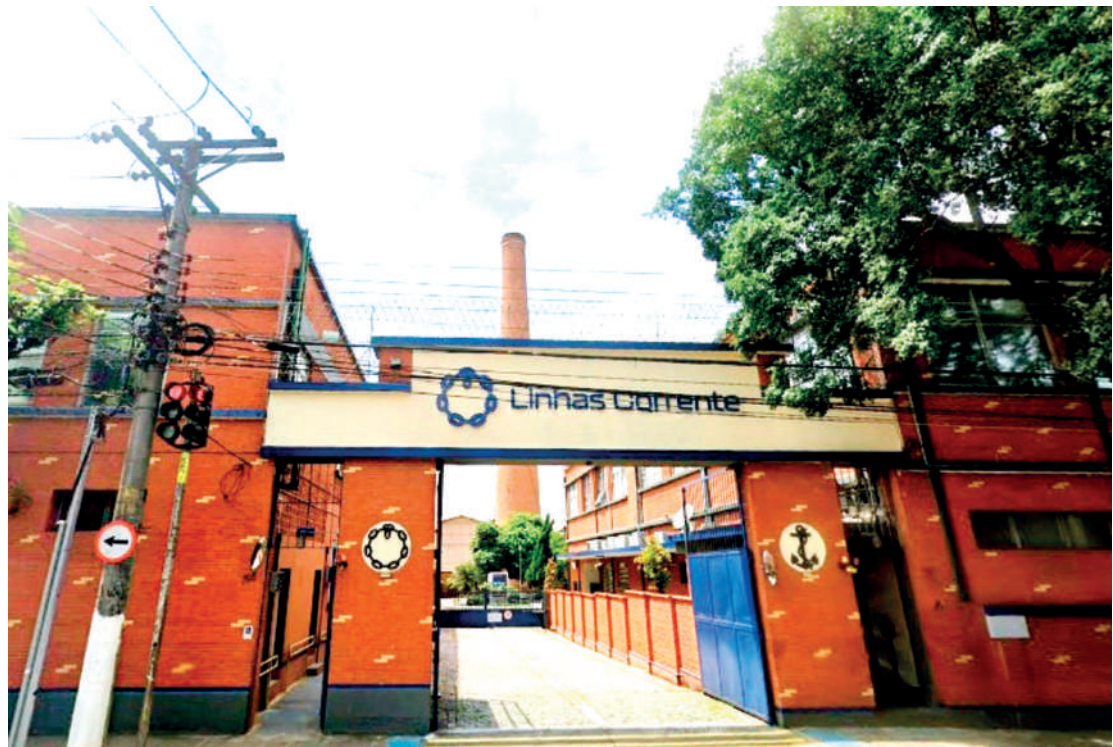
Laudo técnico apontou problemas estruturais na chaminé, que foi inaugurada em 1900 e demolida na semana passada. A Linhas Corrente permanecerá fechada até o fim das obras

Alta e facilmente vista por moradores e quem trafega no Ipiranga, a chaminé da tradicional e antiga empresa de fios e linhas, Linhas Corrente, localizada na Rua do Manifesto, foi demolida na quinta-feira (23). A ação pegou muitos de surpresa.