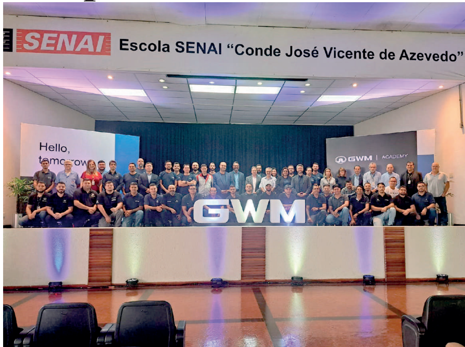
Parceria inédita entre a multinacional GWM e o Senai Ipiranga vai capacitar alunos da unidade e trabalhadores da rede para lidar com a manutenção de carros elétricos e híbridos PÁGINA 5

Infelizmente, a desigualdade no País ainda é estruturante. Chama a atenção o tratamento desigual que as instituições prestam às pessoas de status social diferente no Brasil, principalmente o tratamento policial como também no tratamento judicial. NOSSA OPINIÃO PÁGINA 2