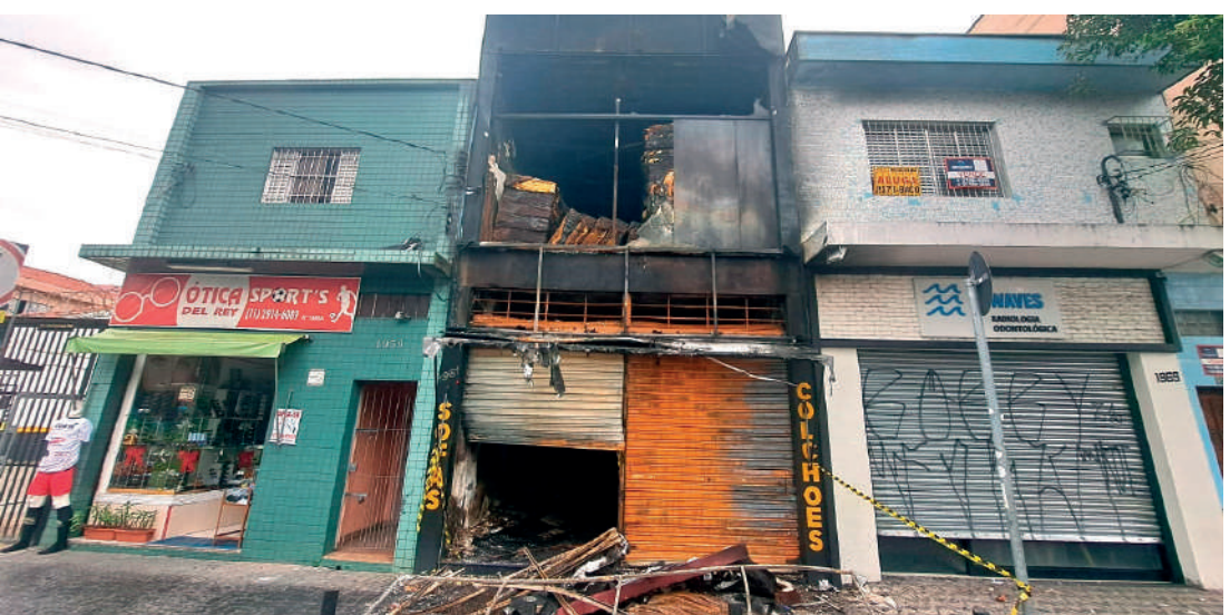
Imagens de segurança registraram o momento em que uma mulher acende um objeto inflamável

Na madrugada desta segunda-feira (27), a loja TopSONO, uma famosa e antiga loja de colchões na rua Lino Coutinho, entre a Rua Greenfeld e a Comandante Taylor, foi incendiada por uma moradora de rua que passava pelo local. Rapidamente, o fogo se alastrou e tomou conta do comércio.