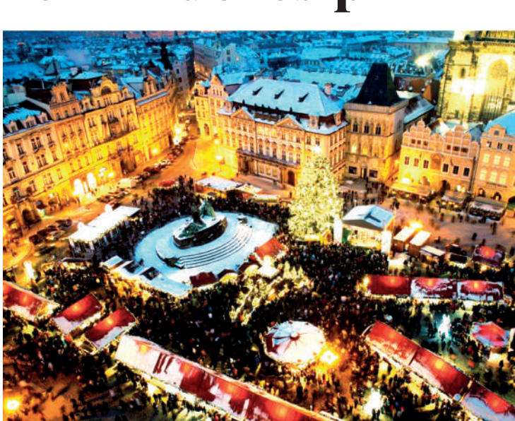
Rovaniemi, na Finlândia, é a terra do Papai Noel e das renas

Conhecida como a “Capital do Natal”, Colmar, na França, é como uma pintura que ganha vida durante o mês de dezembro. Suas ruas medievais se