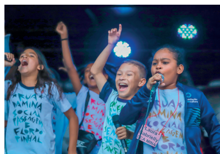
Crianças e adolescentes apresentam suas rimas e danças

Este é o ápice de um grande trabalho realizado nas oficinas socioculturais nos CCA's -