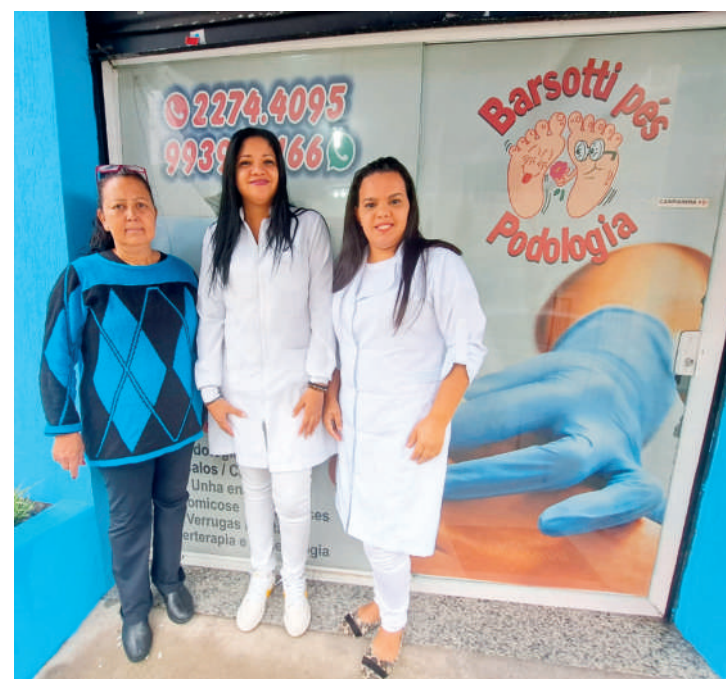
Unidade agora está localizada na rua Brigadeiro Jordão, 717