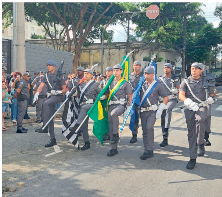
Comemorações aconteceram na rua 28 de Setembro na terça

No decorrer das festividades, policiais vencedores do Torneio