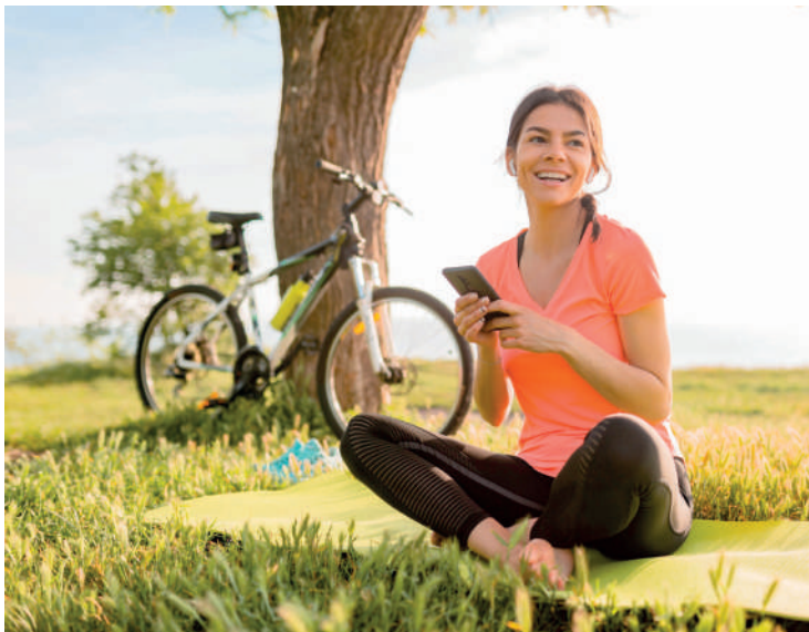
A jornada para um futuro mais saudável começa ao ar livre

O ato de escrever em um diário ajuda a organizar os pensamentos e tarefas, proporcionando uma