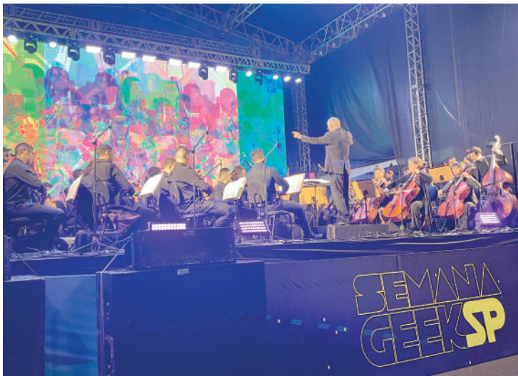
Orquestra Sinfônica de Heliópolis tocou trilhas de filmes famosos

a falta de uma grande plateia presente para admirá-los seria um mero detalhe, pois o importante era se apresentar em grande estilo e fazer aquilo que gostam.