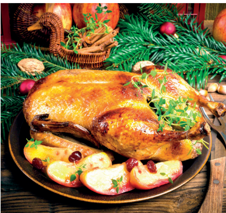
Pato assado e panetone com frutas são a combinação perfeita para o natal

Como fazer: dissolva 1 colher (chá) de açúcar e 6 tabletes de fermento biológico fresco em 1 xícara (chá) de água morna. Junte 1 xícara (chá) de farinha de trigo, misture bem e deixe crescer até dobrar de volume. Em separado, bata muito bem 4 ovos inteiros, com 12 colheres (sopa) de açúcar, adicione 3 colheres (sopa) bem cheias de manteiga, 1 colher (sopa) de banha; 1/2 litro de leite morno e 1 colher (café) de sal. Misture tudo ao fermento já crescido. Aos poucos, acrescente 1 quilo (aproximadamente) de farinha de trigo, sovando até abrir bolhas. Abra a massa com as mãos, junte 400 gr de frutas cristalizadas picadinhas, 250 gr de passas sem sementes e 100 gr de nozes picadas. Misture bem e coloque em formas untadas com manteiga e polvilhadas com farinha de trigo. Ponha a massa até a metade das formas escolhidas, deixando crescer até dobrar de volume. Faça um corte em cruz, pincele com gema e leve ao forno preaquecido (180º), por meia hora ou até dourar.