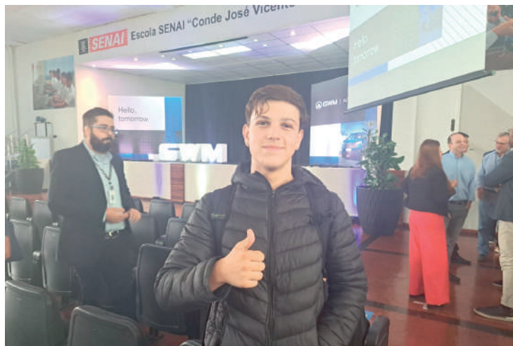
Parceria inédita entre GWM e unidade Ipiranga capacitará Enzo

“Com a chegada dos carros eletrificados, nós precisamos que as pessoas sejam capacitadas a trabalhar com esses veículos, então, o que estamos fazendo aqui é uma