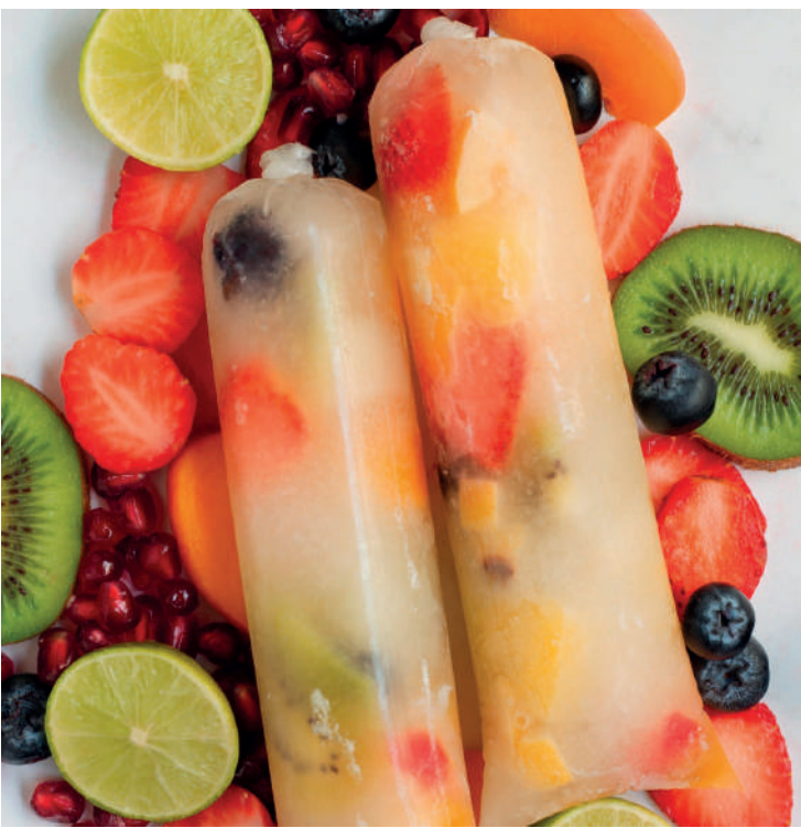
Temperaturas subindo! Que tal um geladinho para fazer em casa!

Ingredientes: 1 xícara (chá) de água de coco; meia xícara (chá) de suco de uva branco integral; 1 fatia grossa de abacaxi em pedaços pequenos; meia xícara (chá) de uvas roxas sem sementes; 1 kiwi picado; 6 morangos cortados ao meio. Preparo: Numa tigela, misture a água de coco e o suco de uvas. Reserve. Divida as frutas em porções à gosto e coloque nos saquinhos para geladinhos, preenchendo 2/3 da capacidade. Complete com a mistura de sucos. Amarre a ponta dos saquinhos e leve ao congelador. Sirva congelado.