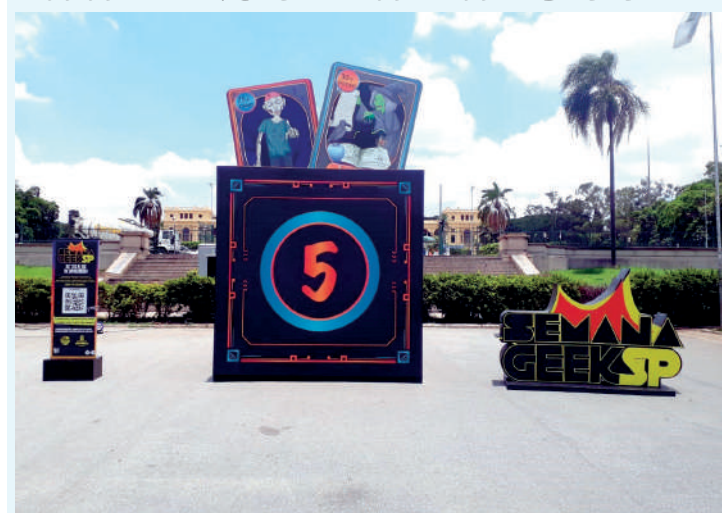
Palco Mundo Geek receberá Thiago Abravanel no sábado (25)

O Parque da Independência receberá, neste final de semana (25 e 26), o Palco Mundo Geek com grandes shows da primeira edição da Semana Geek. No sábado (25) e domingo (26), das 10h às 18h, haverá a apresentação do DJ Lucio de Souza. No sábado, também das 18h30 às 19h30, haverá apresentação do ator e cantor, Thiago Abravanel.