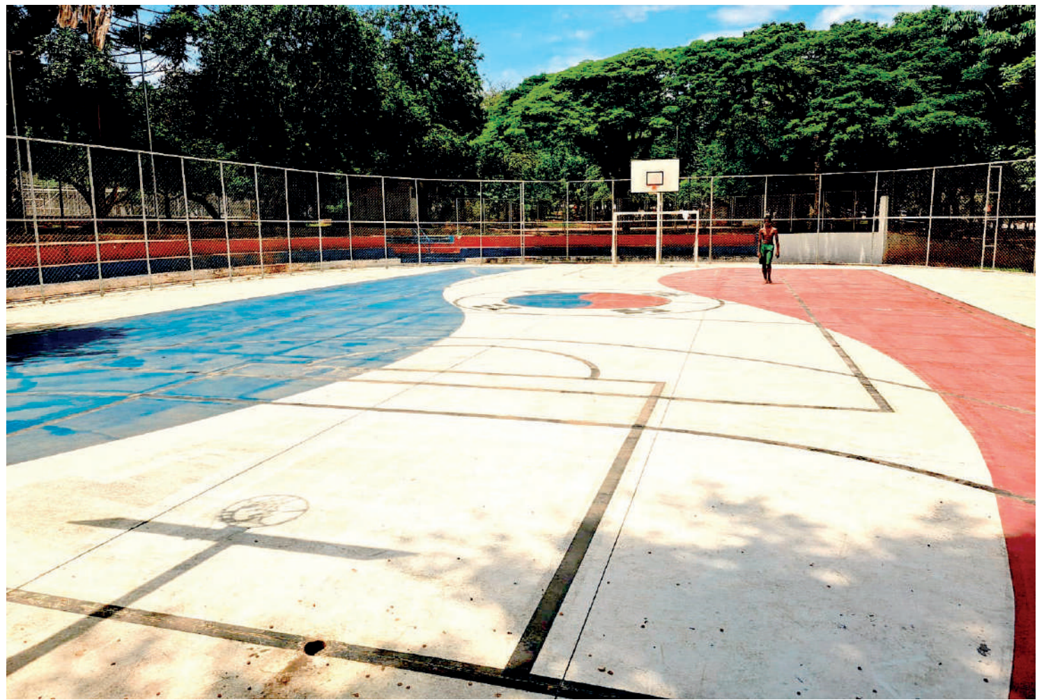
Um ano após receber uma pintura da Coréia do Sul, em homenagem à seleção que participou da Copa do Mundo de 2022, a quadra na Praça Flávio Xavier de Toledo continua praticamente intacta. PÁGINA 4