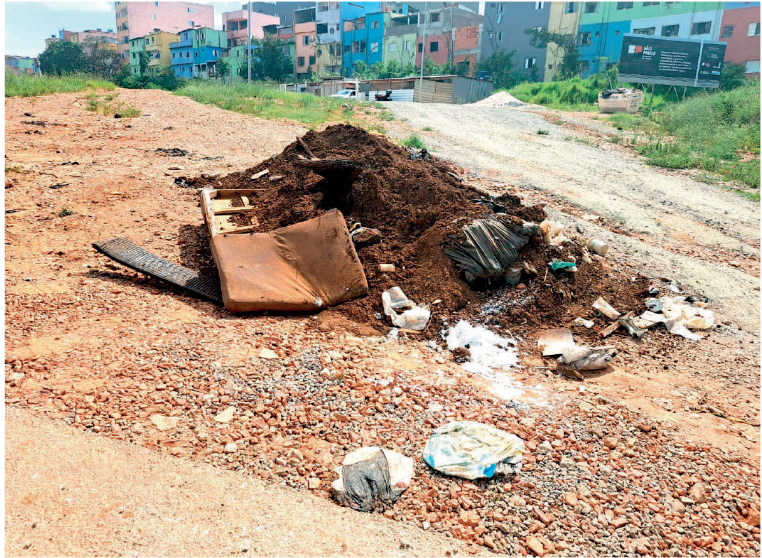
Vazio, com grama alta, obras por fazer, sujeira, pedregulhos e sem nenhuma equipe trabalhando. Assim encontra-se o local onde era para existir o Parque da Cidadania de Heliópolis, próximo à Almirante Delamare. PÁGINA 3

E que essa tragédia (não há outro nome para definir a morte por causa do calor de uma fã durante um show) sirva de exemplo. Os organizadores de eventos de grande porte precisam se preparar para oferecer ao público as condições necessárias diante do “novo normal” que estamos enfrentando: altas temperaturas e tempestades com rajadas de ventos a velocidades recorde. NOSSA OPINIÃO PÁGINA 2