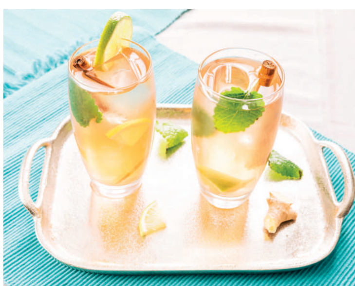
Opte por tomar um delicioso chá gelado de gengibre com hortelã

Além do gengibre, canela e pimenta, outros alimentos também prometem auxiliar na eliminação da gordura do organismo e são mais fáceis de ingerir do que a pimenta, por exemplo. Entre eles estão rabanete, nabo, couve-flor, repolho, abobrinha, chicória, agrião, espinafre, melancia, melão, limão, amora, salmão, sardinha fresca e semente de linhaça ou farinha de linhaça. E falando em linhaça, há quem reclame deste poderoso alimento, rico em Ômega 3, quanto à forma de ingestão. Uma boa maneira é acrescentar 1 colher (sopa) ao dia ao almoço, como se fosse farofa. A farinha de linhaça mistura-se muito bem ao arroz ou à salada.