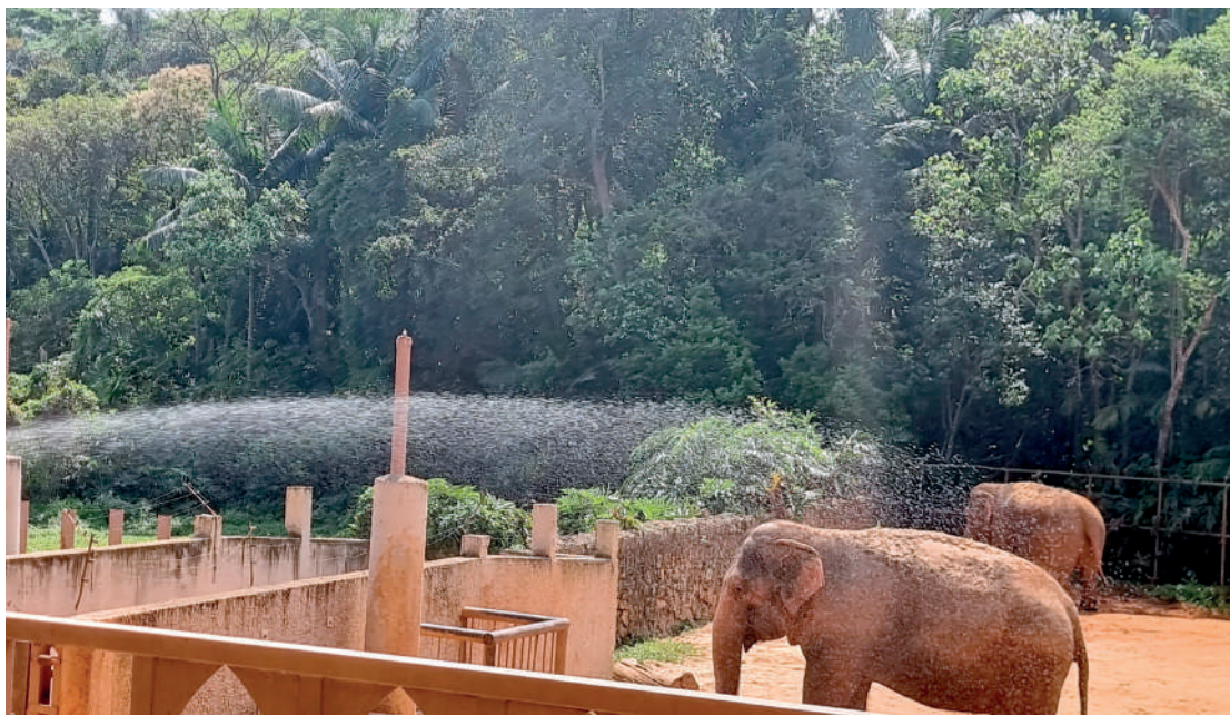
Elefante recebe banho de mangueira para se refrescar e se hidratar nos dias mais quentes do ano