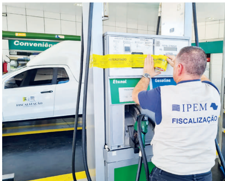
De janeiro a julho o Ipem-SP fiscalizou 4.321 postos em SP

Já no Moinho Velho, foi o Triplo X Auto Posto Ltda, localizado à avenida Presidente Tancredo Neves, nº 85, quem