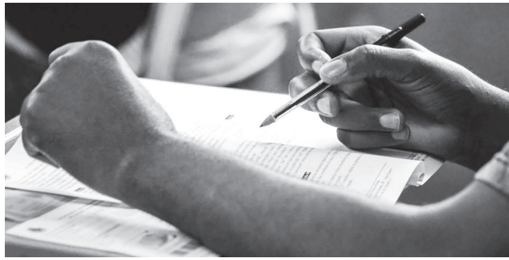
Os salários variam entre R$ 2.800,00 e R$ 8.500,00

A Prefeitura de São Paulo, por meio da Agência Reguladora de Serviços Públicos do Município de São Paulo – SP Regula, abre 150 vagas em concurso público para as carreiras de Analista de Regulação de Serviços Públicos, Fiscal de Serviços Públicos Municipais e Técnico em Fiscalização de Serviços Públicos. Os salários variam entre R$ 2.800,00 e R$ 8.500,00 e as inscrições devem ser feitas, exclusivamente pela internet, até o dia 20 de setembro.