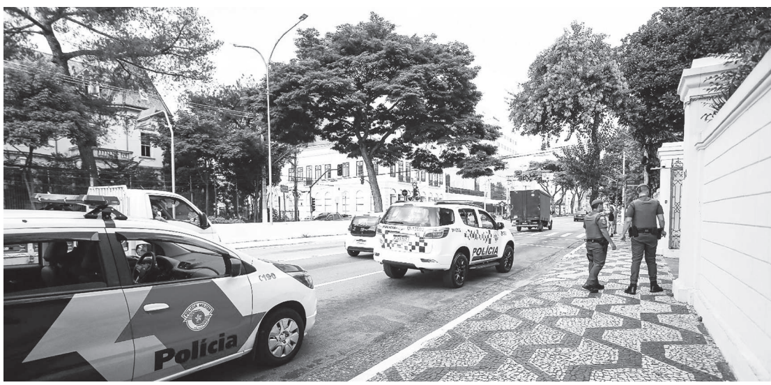
Projeto em andamento prevê que policiais monitorem mais de perto infratores em liberdade

Em comparação com a última semana de março (27 a 2 de abril), os roubos caíram de 190