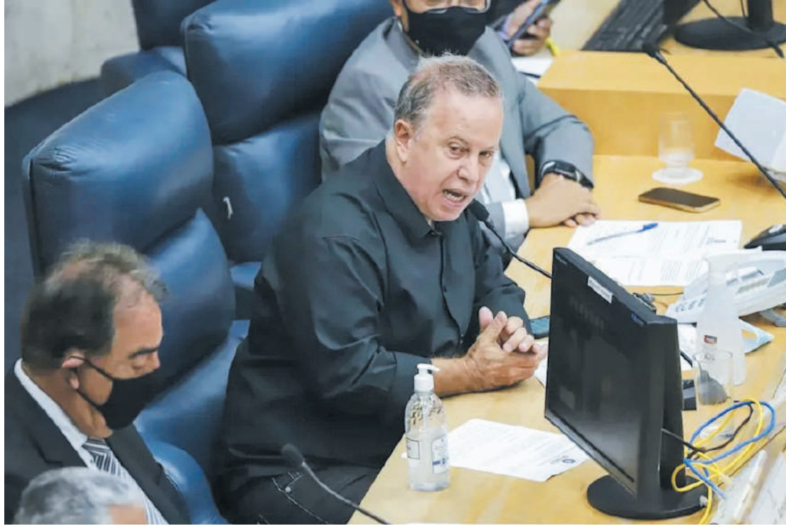
Projeto que pede a cassação do vereador foi apresentado por vereadoras do PSOL