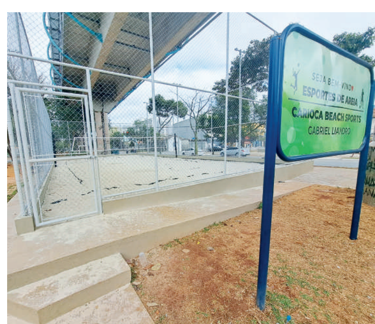
A maioria das quadras espalhadas pelo bairro já estão abertas

Até o momento, estão à disposição dos ipiranguistas, as quadras: da Rua Aída (duas