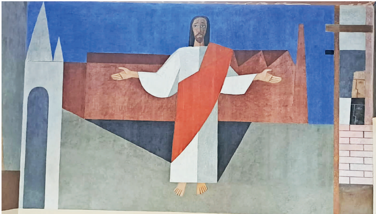
Localizada no Ipiranga, a Capela do Cristo Operário passa por novo restauro. Construída em 1950, ela representa um pouco da história do bairro, surgiu de uma iniciativa do Frei Batista Pereira dos Santos e está vinculada ao movimento Economia e Turismo. PÁGINA 3