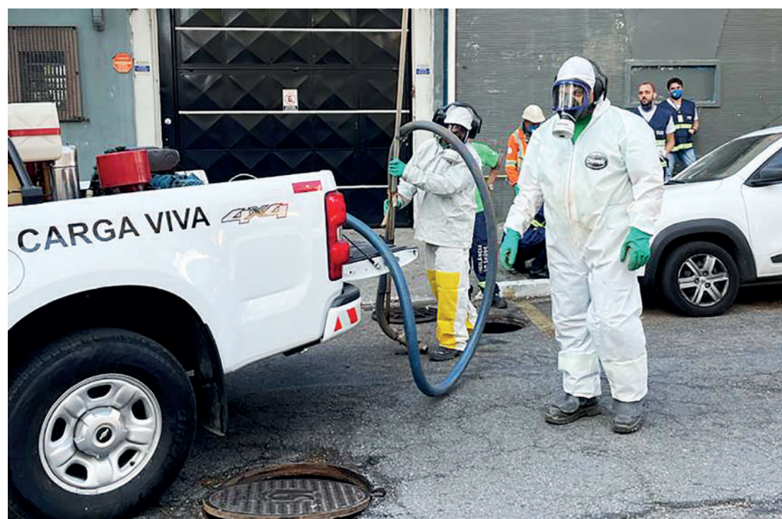
Moradores do bairro aplaudem a ação e pedem que ela seja realizada em outras localidades

A moradora frisou ainda, que os escorpiões "realmente não