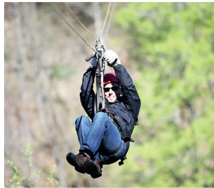
A programação é destinada a variados públicos

Rua Professor Artur Primavera, S/Nº – Parque Bristol