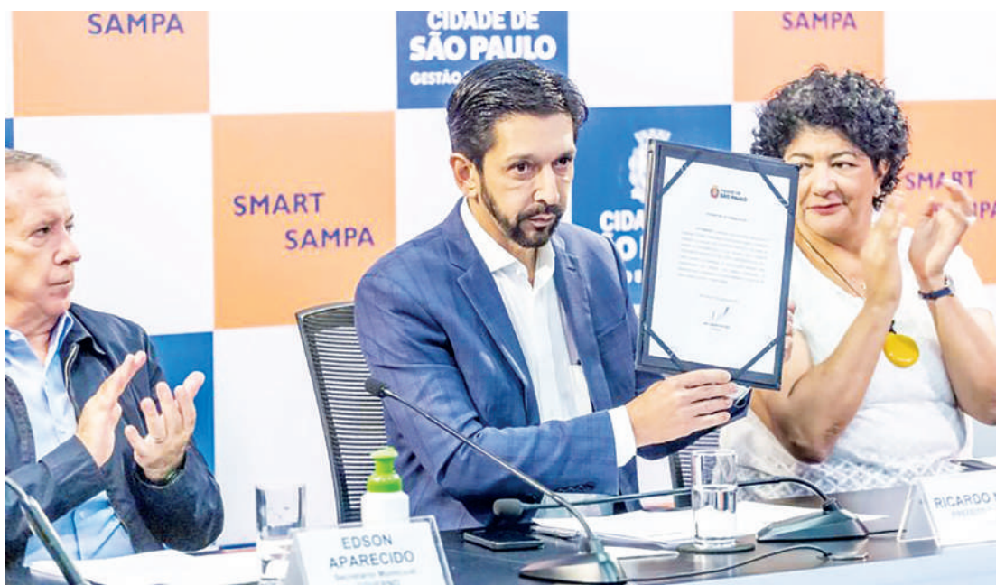
Prefeito anunciou a implantação das câmeras, que custarão R$ 9,8 milhões por mês aos cofres públicos

É também no centro que serão instaladas as primeiras 200 câmeras do projeto, dentro de dois meses. A perspectiva