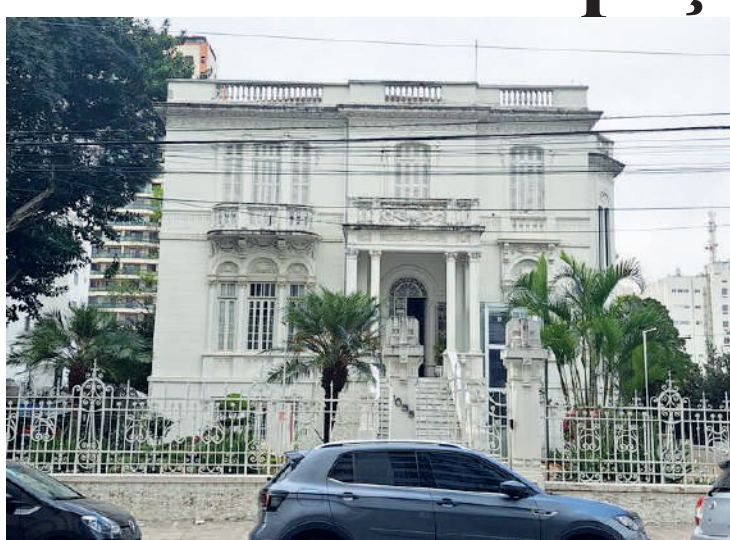
Em 3 de dezembro ocorrerá inauguração exclusiva ao público

“A Casa Zabeu é praticamente uma extensão do Espaço Zabeu, que nós temos aqui na Rua Bom Pastor. E desde criança, eu via os palacetes da família Jafet, e para qualquer criança que vê um imóvel dessas proporções é um mundo. Sempre sonhei em entrar e ter – participar – de um