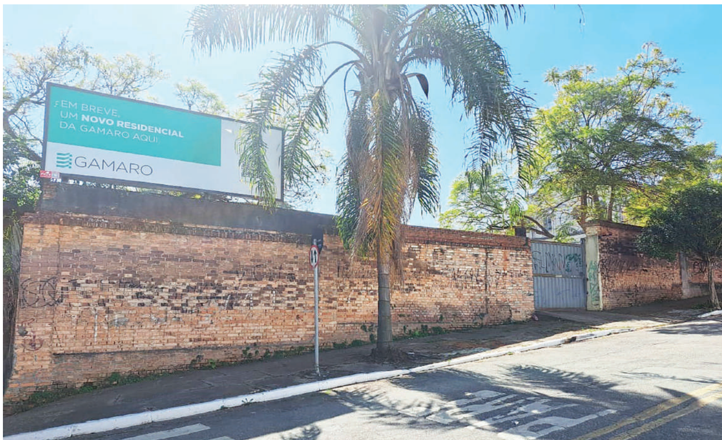
Moradores do Ipiranga iniciaram a coleta de assinatura em um abaixo assinado, para impedir que a construtora Gamaro derrube 64 árvores de várias espécies existente em um terreno da rua Dom Luis Lasanha, no entorno do Noviciado Nossa Senhora das Graças Irmãs Salesianas. A população promete fazer virgília permanente no local contra a motosserra da construtora, sob a alegação de que o legal pode ser imoral e destruir o patrimônio já desgastado do histórico bairro do Ipiranga. PÁGINA 3