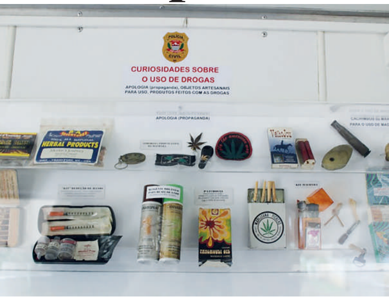
Visitação objetiva que a população conheça um pouco mais sobre o trabalho da polícia, além de curiosidades de crimes famosos

A Polícia Civil de São Paulo possui três museus com entrada gratuita para que os visitantes possam conhecer um pouco mais sobre o trabalho e a história da polícia e, ainda, descobrir curiosidades sobre os crimes mais famosos e antigos no Estado de São Paulo.