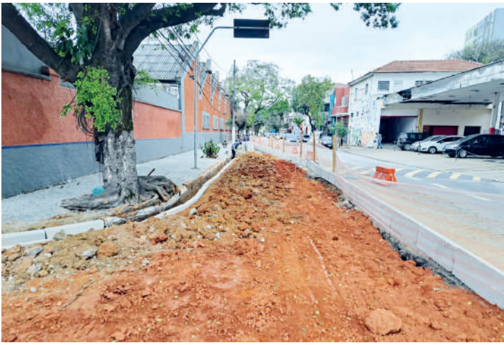
As esquinas da rua do Manifesto (foto) com rua Leais Paulistanos vai ganhar uma área denominada Praça de Chuva e tem quatro meses para sua conclusão. PÁGINA 6