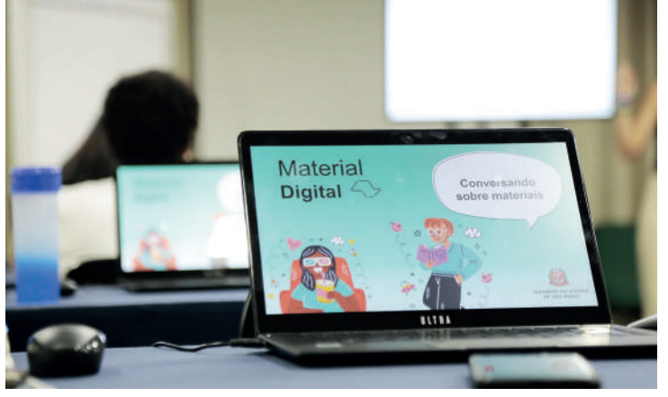
Novo material já conta com 1,4 mil aulas de formação geral

Ainda de acordo com o governo, o Material Digital é resultado de uma construção conjunta com a rede e propõe ao professor um instrumento para a preparação da aula, com o objetivo de empoderá-lo e complementar a dinâmica das