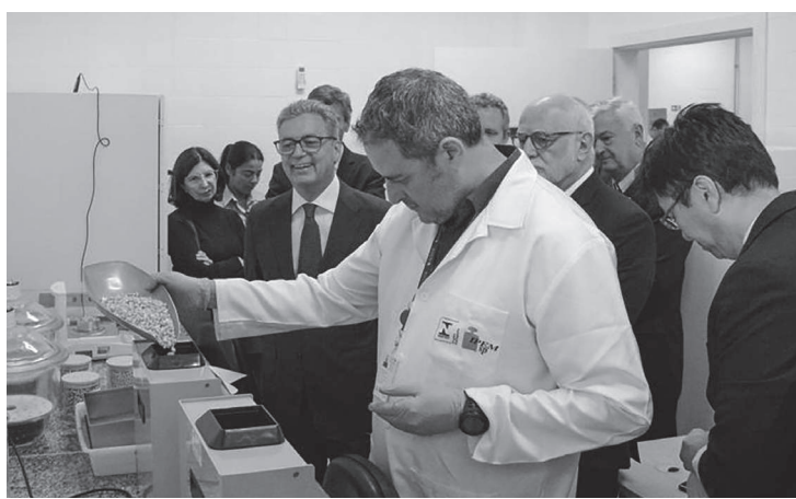
Laboratório ficará na unidade da Rua Muriaé, no Ipiranga

contida internamente nos grãos como soja, milho, café, trigo, feijão, entre outros grãos, uma vez que o teor de umidade do grão é parâmetro importante na definição do peso para comercialização e no seu preço no mercado. A umidade é um dos principais fatores na formação de preço dos grãos e, por isso mesmo, sempre foi um ponto polêmico nas relações comerciais entre produtores, vendedores, compradores e as cooperativas que trabalhavam com medidores universais, sem aprovação de modelo e sem regulamento técnico-metroológico do Inmetro. Impasses em relação às medições divergentes entre as partes, desconhecimento dos erros apresentados pelos instrumentos e até divergências causadas por má fê eram frequentes na comercialização