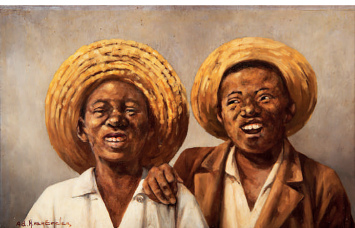
O objetivo é democratizar o acesso às coleções do Museu. Visitantes poderão acessar obras; e pesquisas produzidas no Museu

Pela internet, visitantes poderão conhecer não só as obras, mas também as pesquisas produzidas dentro do museu; objetivo é democratizar o acesso às coleções