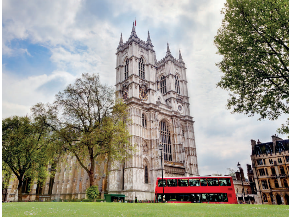
Igreja histórica é considerada a mais importante de Londres e de toda a Inglaterra

O primeiro lugar de culto no local onde hoje se encontra a Abadia de Westminster foi no ano 616 após um pescador do Rio Tamisa ter tido uma visão de São Pedro. Na década de 970, São Dunstan da Cantuária fundou no local