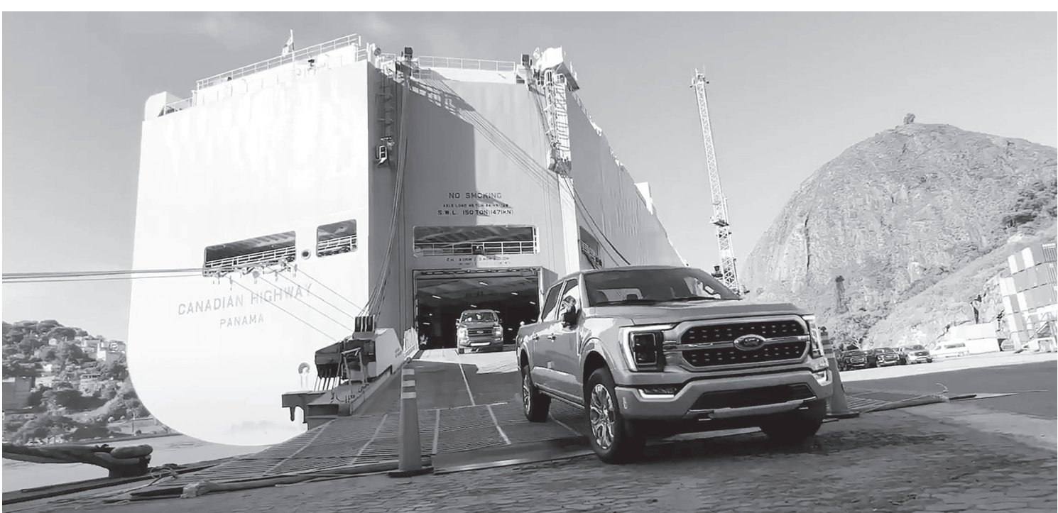
Inicialmente, modelo foi oferecido para clientes da marca, em uma ação de relacionamento, e depois aberto à todo o público

A caçamba de 1.370 litros é dotada de tampa com acionamento elétrico, escada de acesso, iluminação em LED, tomada de 110 V e revestimento protetor especial. A F-150 também é capaz de rebocar 3.515 kg e já vem com preparação para engate, controle de freio e de oscilação de reboque, além de assistente de manobras.