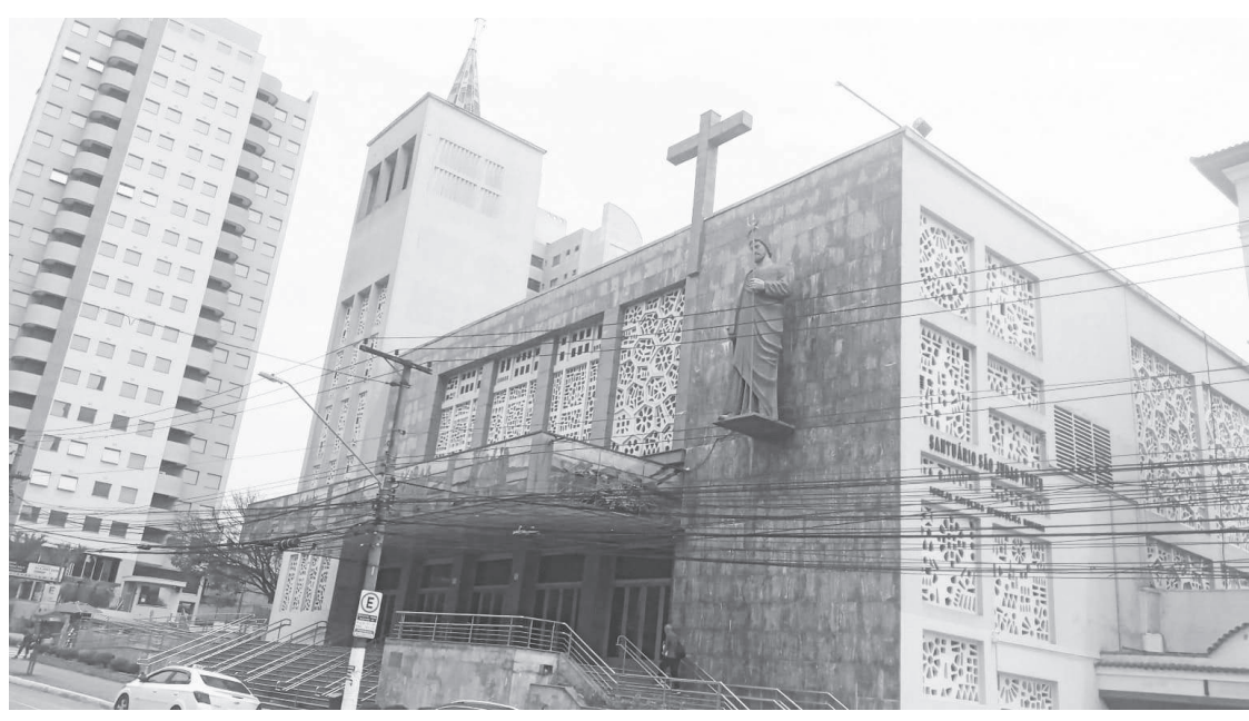
Após dois anos sem acontecer, por conta da pandemia, ocorrerá a tão esperada procissão de São Judas