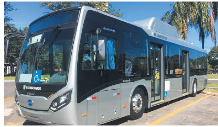
Medida permite que São Paulo avance na melhoria da qualidade do ar

A SPTrans, visando o cumprimento da Lei de Mudanças Climáticas e a redução da emissão de poluentes na cidade de São Paulo, determinou que somente ônibus movidos a tecnologias sustentáveis poderão ser incluídos para operar no sistema de transportes da cidade. A medida está valendo desde o dia 17.