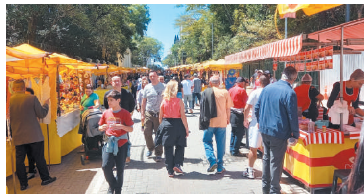
A feira funciona todos os domingos e feriados das 9 às 18hs

e moradores do entorno, tem-nos sido gratificante, uma vez que sempre recebemos elogios pela grandiosidade, variedade e qualidade dos trabalhos expostos e comercializados”, disse Vieira. “Com todo esse crescimento, estamos conseguindo a cada dia, nos tornar um evento mais organizado, e reconhecido, agregando ainda mais visitantes e consumidores ao bairro do Ipiranga”, completou.