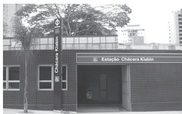
Com isso, 11 novas viagens serão oferecidas durante o dia

A ViaMobilidade, concessionária que opera a Linha 5-Lilás de metrô, anunciou a mudança na operação da estação Chácara Klabin a partir desta segunda-feira, 3 de outubro. Segundo a empresa, os passageiros passarão a embarcar e desembarcar nos trens pela mesma plataforma.