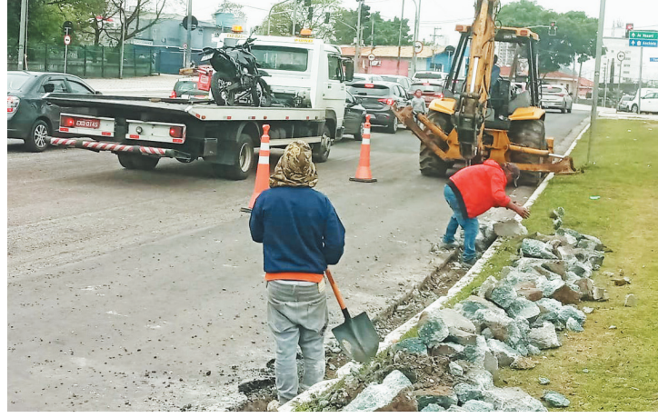
Programa já atingiu 1,5 milhão de metros quadrados em SP

Na região da Subprefeitura Vila Mariana, tem previsão de término de execução dos serviços em janeiro. É o maior trecho com cerca de 104 mil metros quadrados.