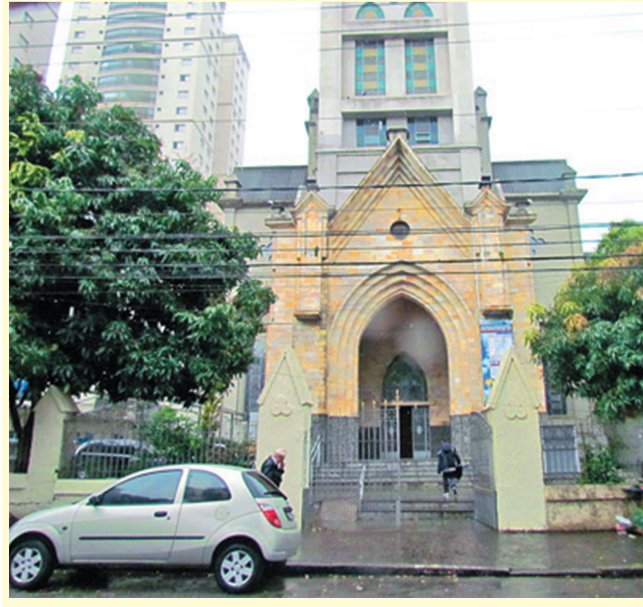
Os fiéis também poderão participar de Missas o dia inteiro

Após dois anos pandêmicos, a Igreja de Nossa Senhora Aparecida do Ipiranga, localizada na R. Labatut, 781, voltará a realizar a procissão no dia 12 de outubro, às 17 horas, em comemoração ao dia da Padroeira do Brasil.