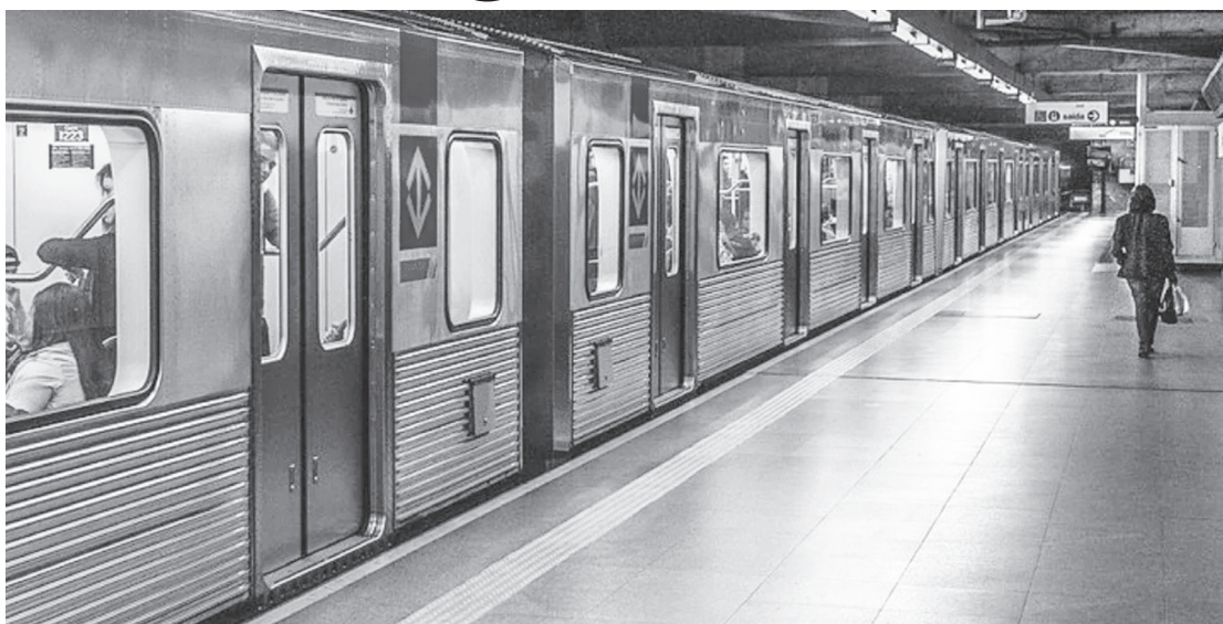
Parceria começa a valer em outubro deste ano e durará 15 dias, podendo ser prorrogada

"Teremos policiais fardados, armados e com comunicação externa para solicitar apoio policial da área (externa), se necessário", disse Álvaro Batista