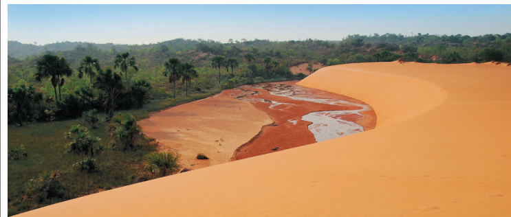
A partida da viagem acontece em Palmas, no Tocantins

Se você quer uma viagem com muita aventura e emoção, conhecendo as maravilhas da natureza e o melhor, sem sair do país, o destino é o Jalapão. A localização se dá no coração do Brasil. Região conhecida por rios de águas cristalinas, praias, deserto, vegetação do cerrado, pelas joias de capim dourado e por nome Jalapão. A partida da viagem acontece em Palmas, capital do Tocantins, mas é no município de Ponte Alta, a 187 km da capital tocantinense, conhecido como o portal de entrada do Jalapão, que os turistas entram no clima de safári ecológico, afastando-se dos locais mais povoados.