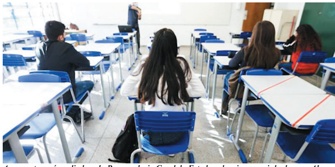
A proposta será avaliada pela Procuradoria Geral do Estado e depois encaminhada para Alesp

#estudantes semaula#ipiranganews#escolapública#teremosaula