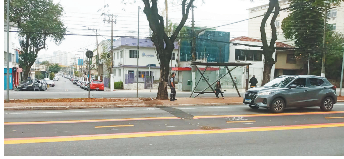
Valeta gera incomodo nos moradores e motoristas que trafegam pela Avenida Dom Pedro I

Porém, uma valeta localizada bem em frente à UBS Dr. Oswaldo Marasca Júnior, está preocupando. A Prefeitura chegou a recapá-la, mas se o serviço não for finalizado, acidentes podem ocorrer tanto para quem estiver ao volante, quanto para pedestres.