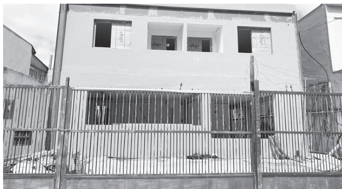
Clube manterá suas atividades em novo endereço; destino do antigo prédio está em segredo

No prédio onde funcionava o Cisplatina, o seu destino é mantido em segredo