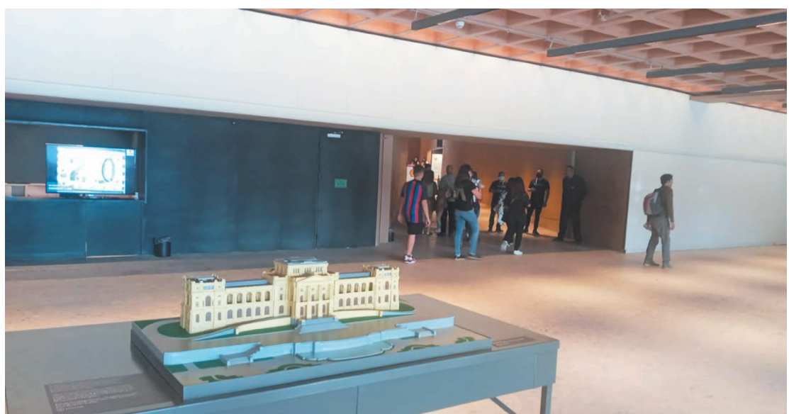
Visitação começa pelo lado de fora com a apreciação dos jardins e termina no mirante

Entrando pelo novo anexo, que ganhará em breve um auditório e um café – construído embaixo do Museu – as pessoas caminharão até uma escada rolante, que irá leva-las até o piso térreo, onde o pé-direito alto, as colunas e a escadaria imponente mostram que o prédio por si só