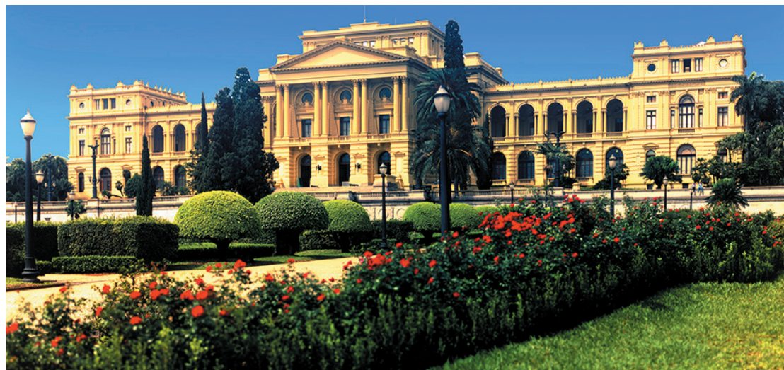
A antecipação da inauguração do museu é para evitar manifestações políticas

Na opinião de Sérgio Sá Leitão, o museu e a independência são de todo os brasileiros, e