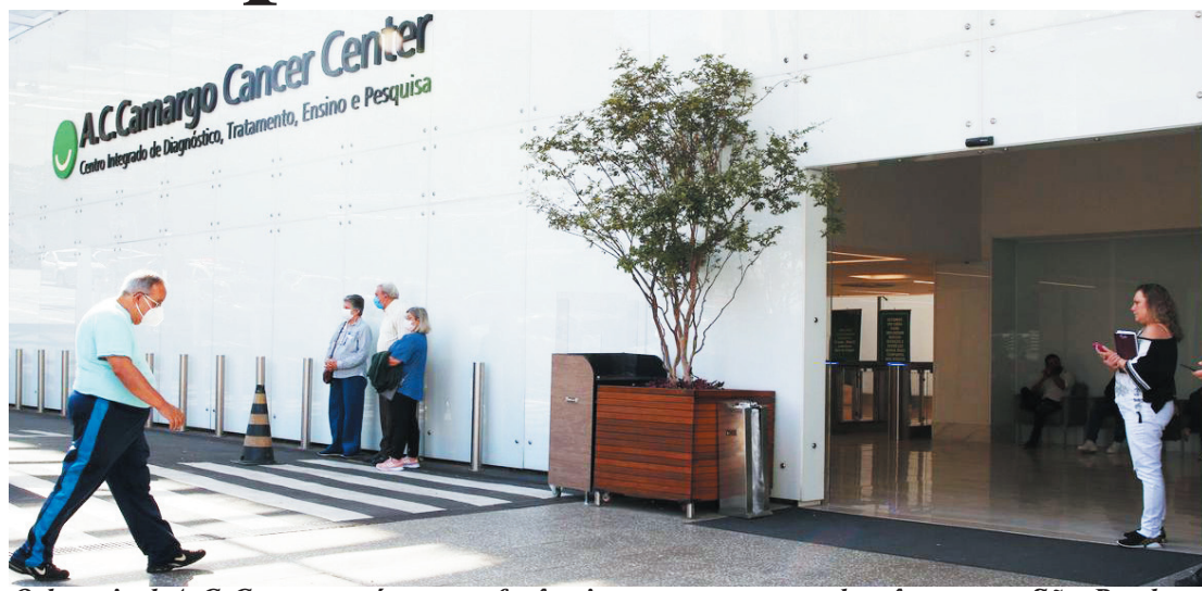
O hospital A.C. Camargo é uma referência no tratamento do câncer em São Paulo

Uma das razões apontadas para o fim desse tipo de atendimento é a defasagem na tabela do SUS. “Essa readequação do