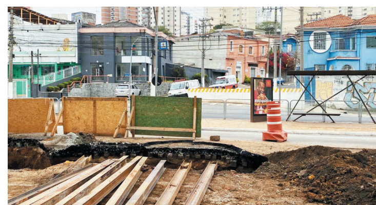
As obras na avenida Dom Pedro interditaram grande parte da via

As obras em torno do Monumento da Independência também preocupa, pois todo piso em seu entorno foi retirado para colocação de um novo, o Jardim Francês, cuja obra está sob responsabilidade do Estado, e que fica literalmente em frente ao prédio monumental do Museu, não é problema, pois as obras estão bem adiantadas e já está em contagem regressiva para a abertura. O terreno tem cerca de 10 mil metros e foi recoberto por grama.