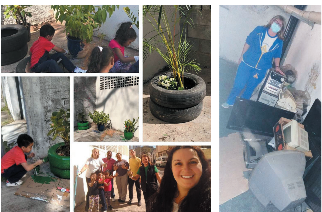
Essa ação teve como consequência a eliminação de dois pontos viciados de descartes no bairro

A ação desenvolvida por um grupo de moradores da Vila Gumercindo que, inicialmente, tinha por objetivo buscar melhorias da zeladoria para o bairro em 2019, cresceu e se transformou em ONG. Hoje diversas escolas estão envolvidas no projeto obtendo ótimos resultados.