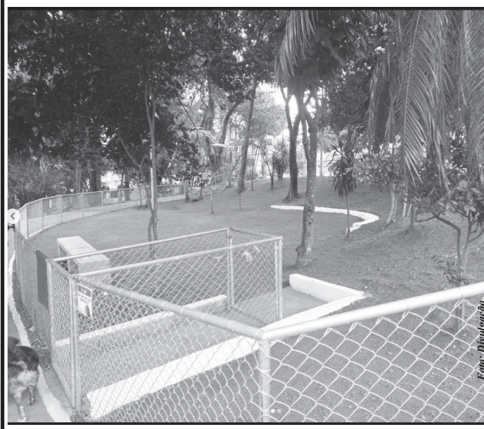
Cachorros podem ficar soltos e em segurança no local