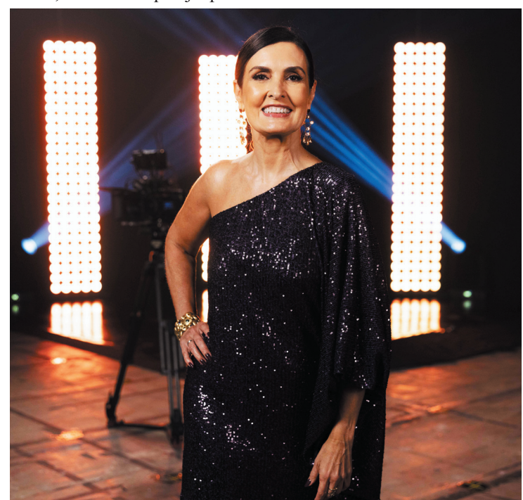
Fátima Bernardes terá novo desafio na carreira dentro da Globo

cipou do "The Voice Brasil" em 2013, como técnica assistente de Lulu Santos na fase das batalhas, e foi técnica da edição de 2021 do "The Voice Kids".