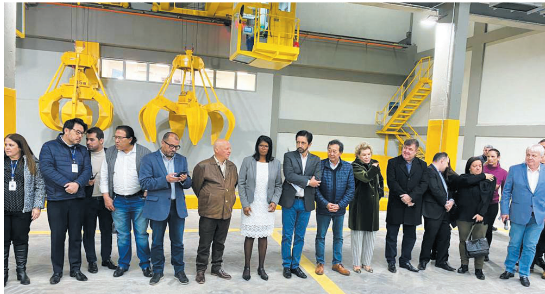
Prefeito Ricardo Nunes (MDB) participou da cerimônia de inauguração junto com o vereador Aurélio Nomura e da secretária de relações internacionais Marta Suplicy

desde outubro de 2004 é responsável pela coleta de 7 mil toneladas de lixo na região sul e leste da cidade, também é quem vai gerenciar a operação da Estação Vergueiro. Para lá serão transferidos diariamente 1.500 toneladas de resíduos recolhidos no Ipiranga, Vila Prudente, Vila Mariana e Jabaquara.