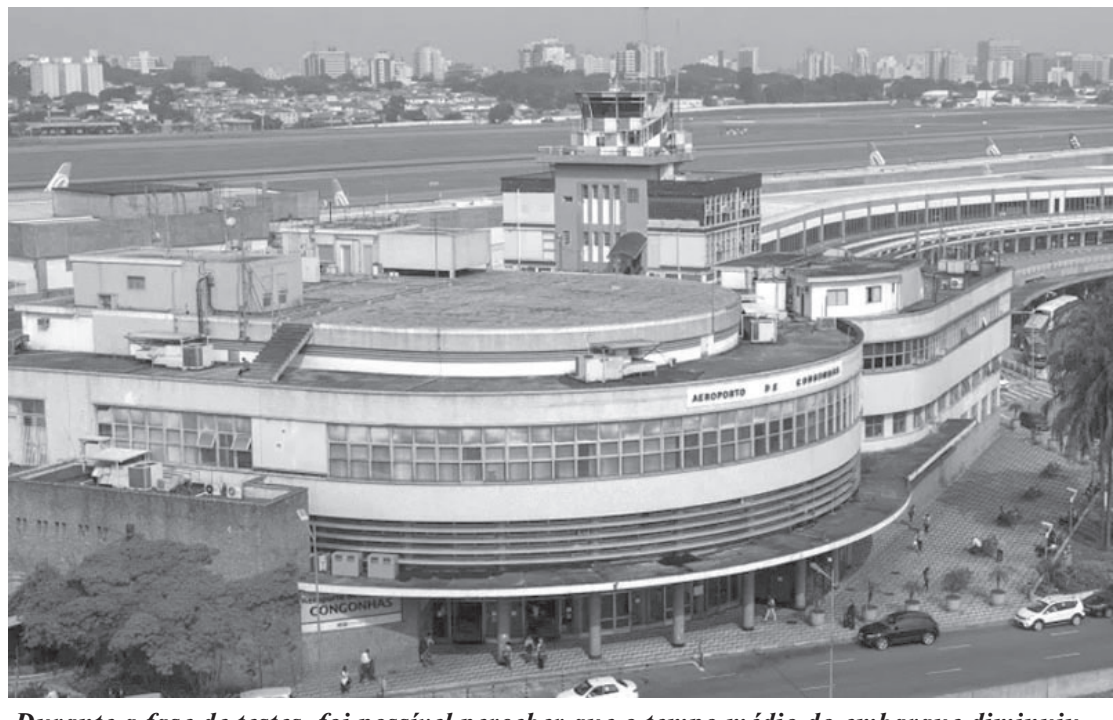
Durante a fase de testes, foi possível perceber que o tempo médio do embarque diminuiu

Nesta terça-feira (9) o ministro da Infraestrutura, Marcelo Sampaio, esteve em Congonhas para testar o equipamento implantado. De acordo com o Ministério da Infraestrutura (Minfra), o processo de implantação definitiva da tecnologia já está em andamento e acontece gradual e simultaneamente nos dois aeroportos, com previsão de conclusão neste mês. Quando a funcionalidade estiver disponível, os viajantes que estiverem em voos com embarques biométricos e optarem pelo uso da tecnologia só precisarão da imagem de seus rostos para fazer check-in e acessarem salas de embarque e aeronaves. “No caso de comissários de bordo e pilotos da aviação regular, a solução inclui o acesso a áreas restritas dos dois terminais aéreos. A iniciativa tem o objetivo de tornar mais eficiente, ágil e seguro o processamento de passageiros e tripulantes, tendo por premissa a segurança no tratamento e a proteção dos dados pessoais dos usuários contra uso indevido ou não autorizado”, explica o Minfra. Segundo o Minfra, cada empresa aérea que opere em um dos dois terminais poderá adotar