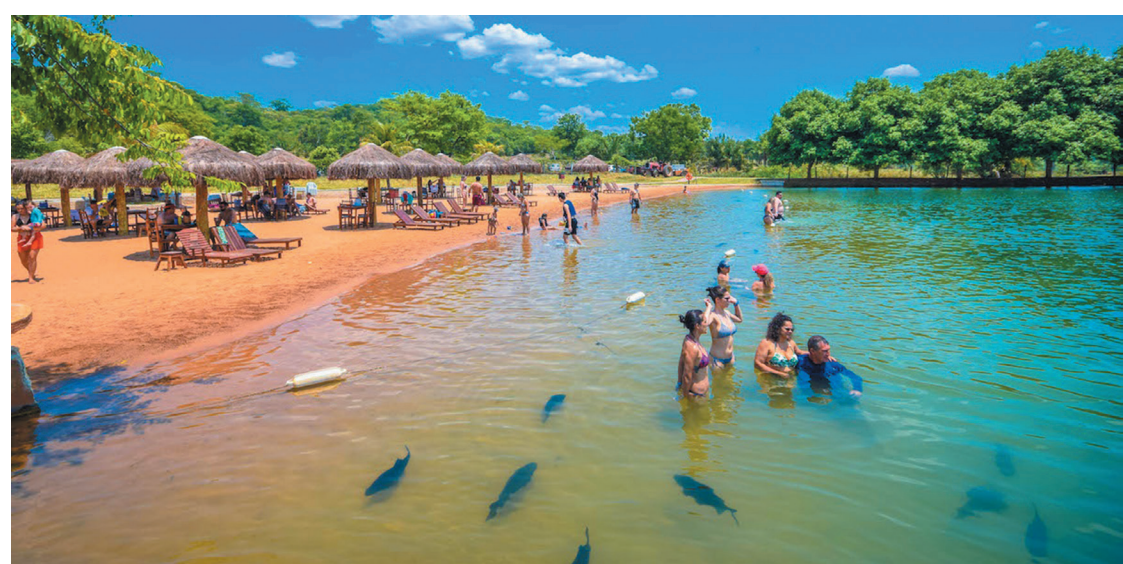
Em Bonito cardumes de peixes nadam ao lado dos banhistas nos rios do município

O turismo em Bonito é muito organizado e tudo é feito com a