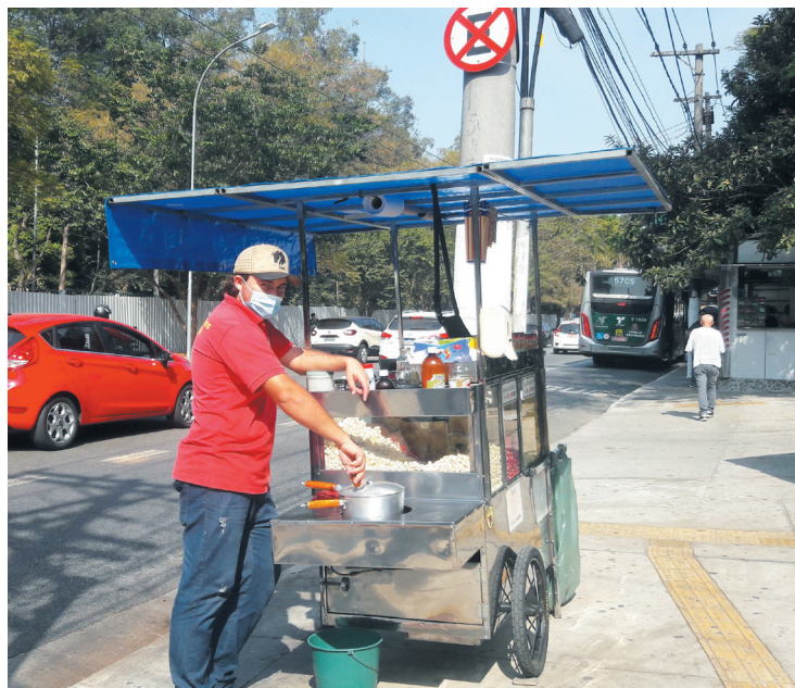
Jeniell acredita que a obra não estará pronta até reabertura do Museu

A empresa afirma que “toda a rede de energia já está subterrânea” nas ruas Leais Paulistanos (entre Praça do Monumento e Rua Bom Pastor), Sorocabanos (entre Praça do Monumento e Bom Pastor), avenida Nazaré (entre Pouso Alegre e Padre Marchetti), Patriotas (entre