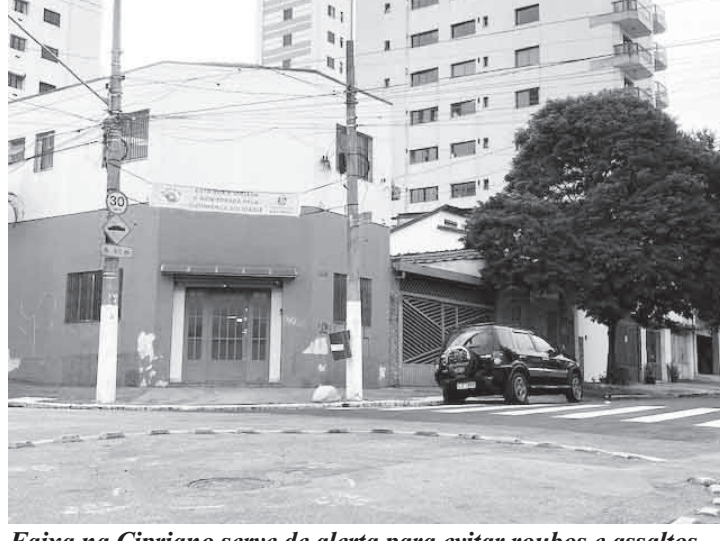
Faixa na Cipriano serve de alerta para evitar roubos e assaltos

Cansados com o número cada vez mais crescente de assaltos na região, os moradores da rua Cipriano Barata e Lima e Silva, passaram a se organizar, e adotaram a chamada vigilância comunitária. Essa ação consiste na troca de número de telefone e endereço dos moradores e, a partir dessa troca de informação, todos passam a serem “vigilantes” de qualquer movimentação suspeita na região. “Foi a alternativa que encontramos para nos proteger”, diz uma moradora que participa do grupo. Ela que mora na rua Cipriano Barata, quase esquina com a Lima e Silva, afirma que