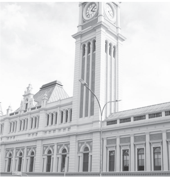
O Museu da Língua Portuguesa fica na Estação da Luz

O Museu da Língua Portuguesa, esta com uma intensa programação no mês das férias de julho. Além da exposição principal, o Museu promove atividades exclusivas para o público infantil, além da quinta edição do Sarau Língua Afia-da, mais uma apresentação do projeto Plataforma Conexões e visitas mediadas pelo Núcleo Educativo.