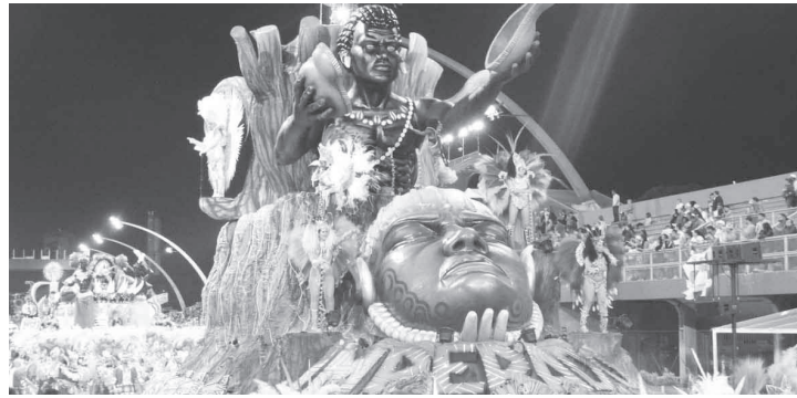
Imperador do Ipiranga desfila no Grupo de Acesso II

Todos os anos, o público aguarda ansioso pelo Desfile das Escolas de Samba no Sambódromo do Anhembi. Em 2022, devido à pandemia da Covid-19, o evento aconteceu em abril. A partir de 2023, o calendário volta ao normal, com os desfiles sendo realizados durante o feriado de Carnaval, entre 17 e 19 de fevereiro, sendo o Desfile das Campeãs no fim de semana seguinte, dia 25. Os interessados em conferir o desfile ao vivo já podem adquirir seus ingressos. Sob a organização da Liga das Escolas de Samba de São Paulo, a venda é feita pelo site a compra pelo site https://www.clubedoingresso.com/ “O Carnaval é um evento estratégico para a cidade de São Paulo, uma grande festa que traz alegria e retorno positivo como visibilidade e grande impacto econômico”, afirma o secretário municipal de Turismo, Rodolfo Marinho. “Durante o feriado, todo o trade é impactado: res-