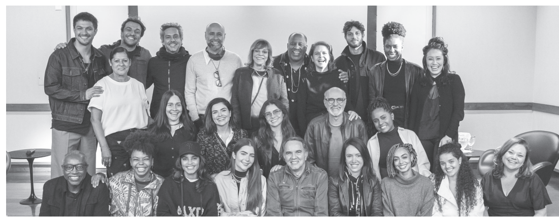
Elenco da novela Travessia de Glória Peres, já começou a gravar os primeiros capítulos

O elenco participou de workshops, atividades indivi-