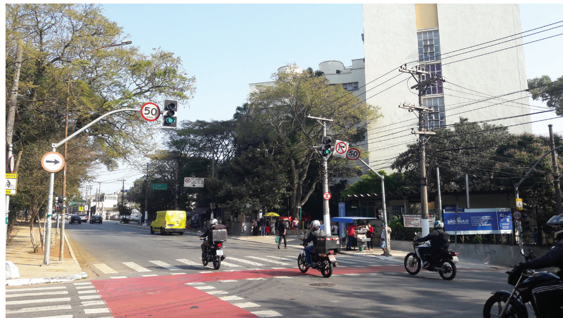
A Enel afirma que já aterrou sua rede, mas em muitos pontos da Nazaré ela permanece visível nos postes

“Vi recentemente escavações da Enel nas proximidades do