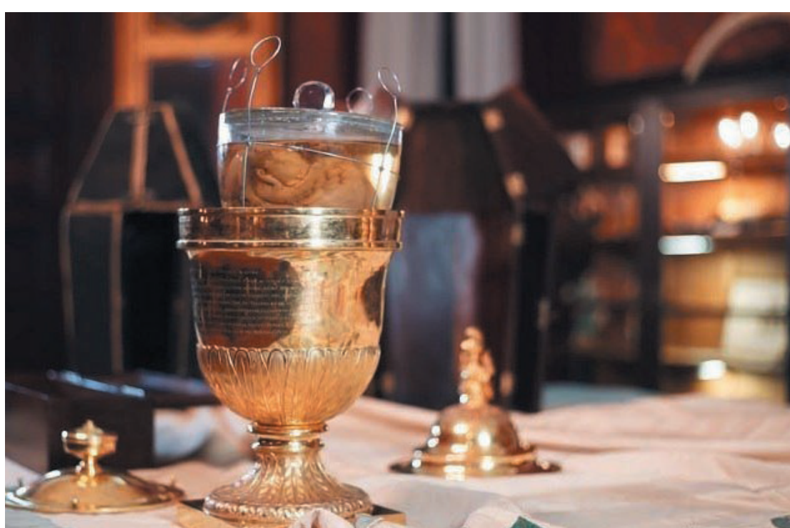
O coração de D. Pedro I virá ao Brasil como parte dos festejos do Bicentenário da Independência

"Estas preocupações foram por mim ouvidas", afirmou Rui Moreira, que disse ter entrado