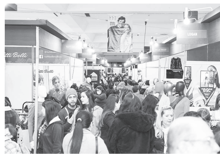
Feira da Moda Inverno - é feita por famílias e para famílias

Entre as peças comercializadas estão blusas e cardigans de tricô, saias, vestido trend coach, jaquetas de couro, casacos e acessórios variados como luvas, toucas e cachecóis com preços de fábrica. É possível sair do Centro de Eventos São