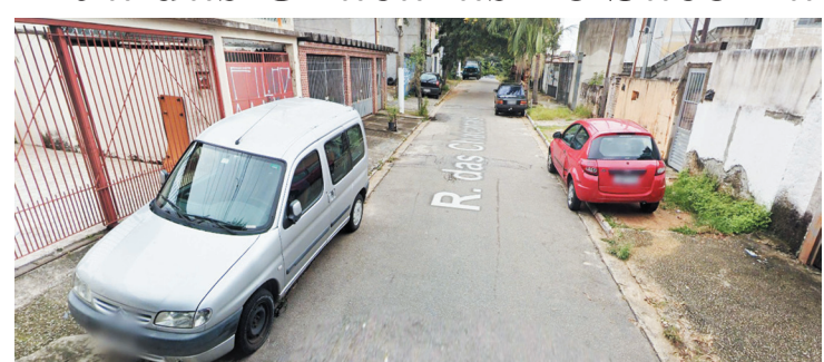
A mudança segundo o CET vai facilitar o trânsito da região

A Companhia de Engenharia de Tráfego (CET) vai implantar mão única de direção na Rua das Chácaras, no sentido da Rua Belgrado para a Rua Regino Aragão, no Sacomã, a partir de sábado (25). A medida tem como objetivo melhorar as condições de segurança de pedestres e de fluidez no trânsito local.