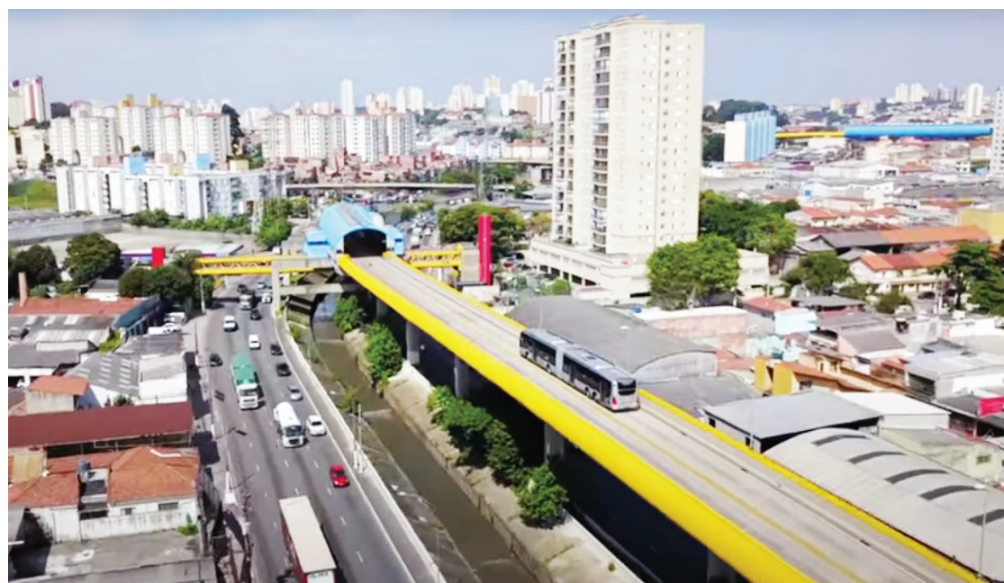
O Expresso Tiradentes tem 9,7 km entre o Sacomã, Vila Prudente e Terminal Mercado

A escolha da empresa para a execução do serviço será feita em agosto e não há data para começar a obra. Ao Jornal SP TV da TV Globo, a SPTrans disse que, na margem esquerda do Rio Tamanduaí, perto de onde passam os ônibus, têm uma teia de redes de drenagem, além de emissários de esgoto da Sabesp, e até uma linha de alta tensão,