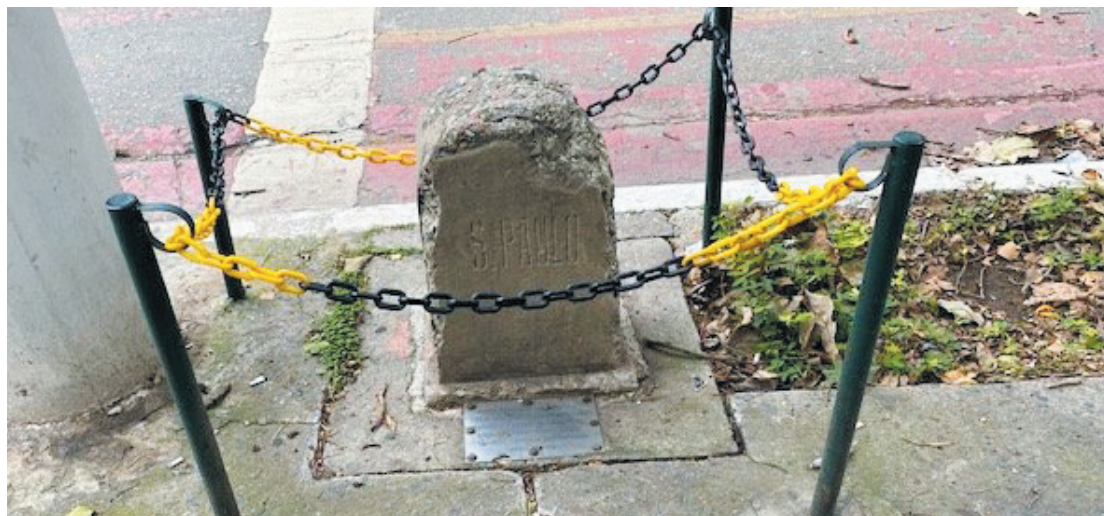
O marco da Rua França Pinto, na Vila Mariana, está abandonado pelo poder público

Os Marcos Quilométricos eram indicadores para as estradas municipais instituídos no município de São Paulo na gestão do Prefeito Washington Luís Pereira