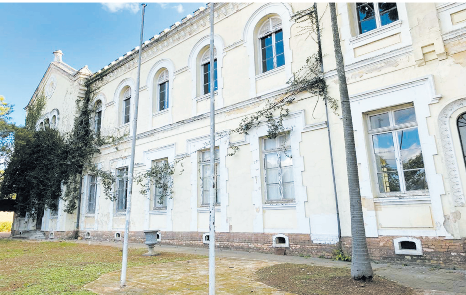
A construtora Alfa garante que o casarão considerado um patrimônio histórico do Ipiranga será preservado. População está de olho

A realização de obras emergenciais de recuperação é, por ora, a única intervenção prevista para o antigo edifício do Novíssimo Nossa Senhora das Graças das Irmãs Salesianas, o número 130 da Rua Clóvis Bueno de Azevedo, paralela à Avenida Nazaré. Apesar de materiais publicitários distribuídos na região terem anunciado que o imóvel abrigaria estabelecimentos comerciais e que prédios de alto padrão de até 10 metros de altura seriam construídos no seu lote – uma área de aproximadamente 10 mil m 2 que ocupa o quarteirão entre as ruas Moreira Costa, Dom Luís Lasanha e a Gama Lobo – não há nenhum projeto definido para a área.