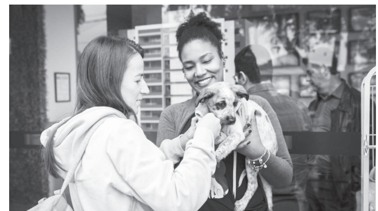
Várias pessoas compareceram ao evento promovido pela MBigucci

O evento contou ainda com uma feira de adoção em parceria com a O grupo Barthô de proteção animal, sessão de foto profissional para os pets, adestrador dando dicas de como treinar e cuidar dos animais, cuidados de higiene com a Bell Pet, consulta com a veterinária Stefany Dalonso, além recreação e brindes caninos. Os influencers Nu-