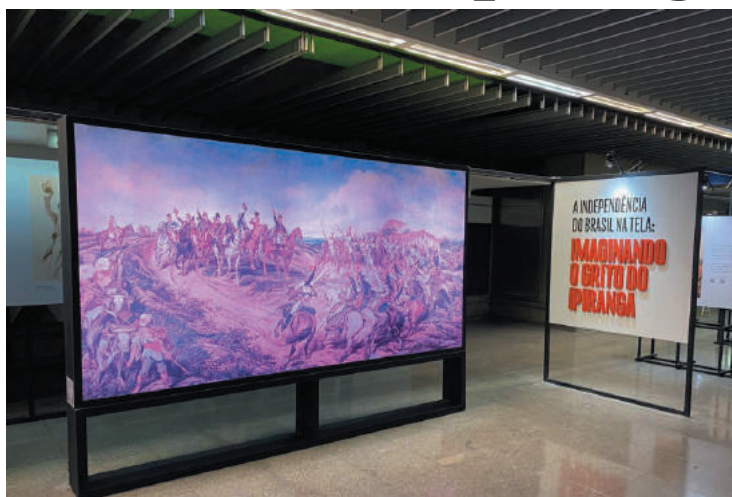
Quadro estará presente em uma reprodução de 3m x 1,70m.