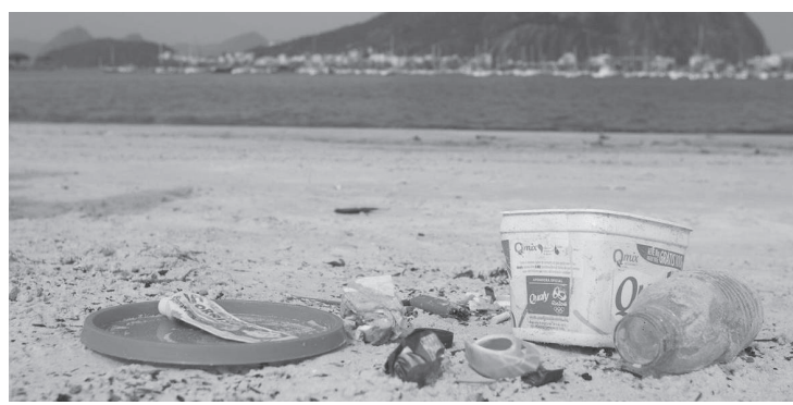
A Mostra de Cinema exibirá, na Biblioteca Parque Villa-Lobos

Até o domingo, dia 5 de junho, acontece no Parque Villa-Lobos, na zona oeste, a primeira edição da Bienal do Lixo de São Paulo, projeto cultural que reúne obras de arte feitas a partir de material de descarte, intervenções artísticas, oficinas, mostra de cinema, palestras e painéis sobre o tema. O evento tem por objetivo estimular o diálogo sobre as relações do homem com o meio ambiente.