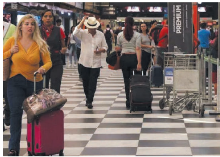
O aeroporto de Congonhas é considerado a jóia da coroa

O Tribunal de Contas da União (TCU), aprovou por unanimidade nesta quarta-feira (1º) a concessão de Congonhas, considerado o mais importante e valioso terminal de passageiros do Brasil. Congonhas é considerado a “jóia da coroa”. Outros quatorze aeroportos, também foram liberados pelo TCU para serem privatizados. O TCU liberou, assim, a realização da sétima rodada de leilão de aeroportos, e o governo corre contra o tempo para realizar o certame em agosto, tentando fugir do auge do período eleitoral.