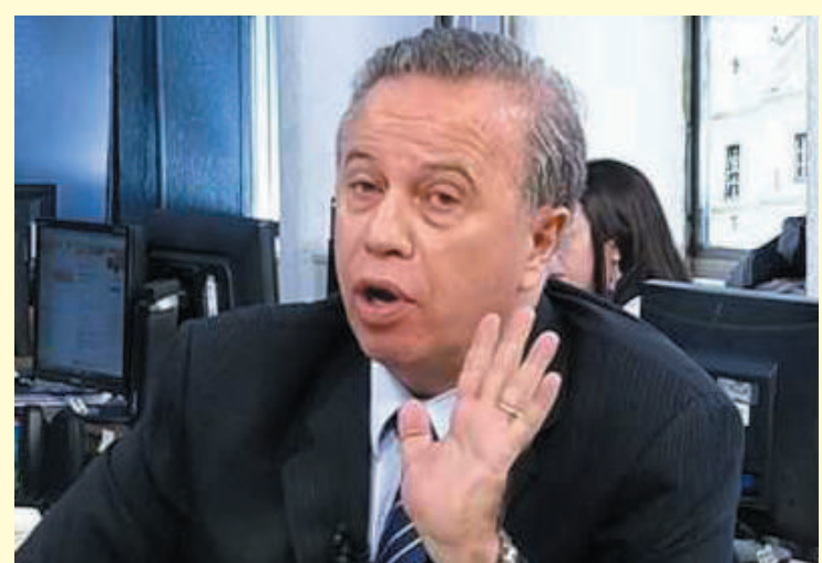
O vereador declarou à Folha que seu patrimônio tem origem lícita