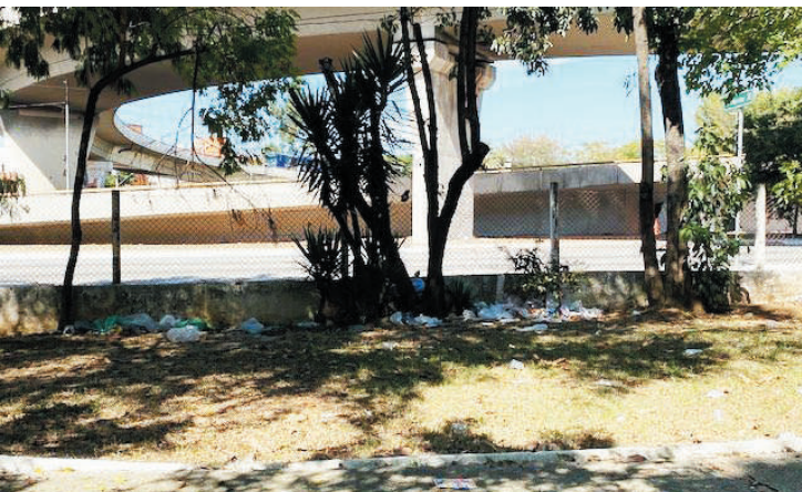
O mato alto e o lixo já fazem parte do cenário da praça