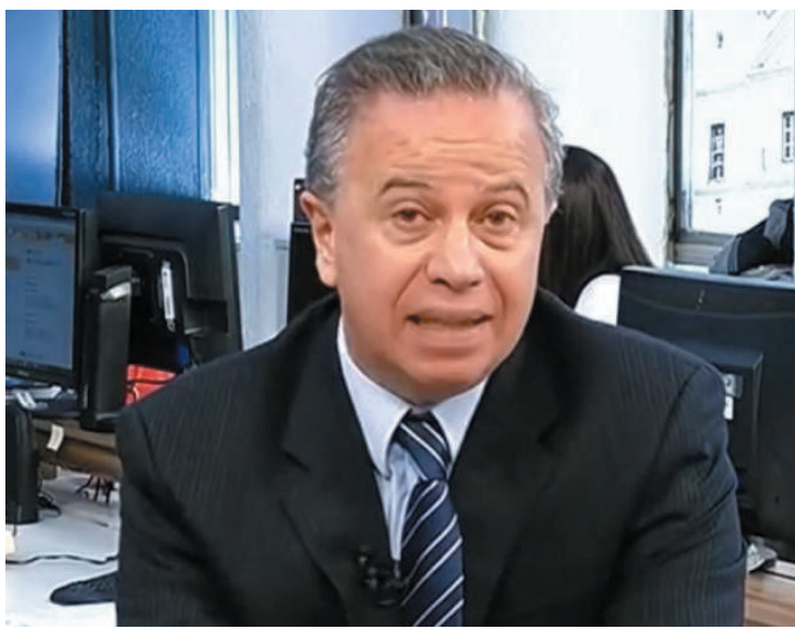
Presidente da câmara municipal diz que situação do vereador é difícil

“Um erro... cometi um erro... Eu peço desculpas a toda população negra por esse episódio que destrói toda minha construção política na busca de garantia