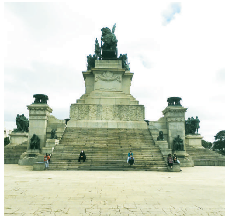
Ossadas de D. Pedro I estão na cripta do Monumento Ipiranga

Os restos mortais de D. Pedro I estão na Cripta do Monumento à Independência e foram doados ao Brasil em 1972.