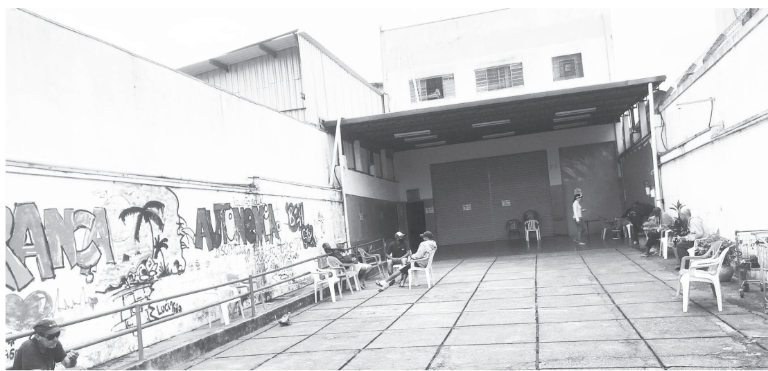
Abrigo Bem Estar, no Sacomã, tem vagas para 80 pessoas do sexo masculino e 20 feminino

Esse centro de acolhimento de adultos, chamado de "Estação Bem Estar" tem 100 vagas no total, sendo 80 para homens e