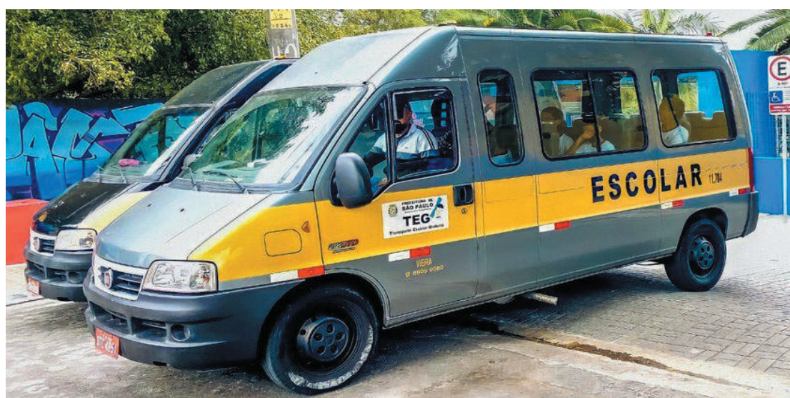
Ampliação da frota faz parte do Programa de Transporte Escolar Municipal Gratuito (TEG)

Com a mudança, os alunos que moram a partir de um quilômetro e meio da escola em que estão matriculados, passarão a ter direito ao transporte. Hoje, pela legislação em vigor são atendidos