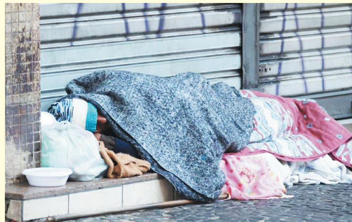
Moradores de rua serão acolhidos em albergues e hotéis

A prefeitura de São Paulo iniciou, nesse segunda-feira (2), a operação Baixas Temperaturas. A partir de agora, pessoas em situação de rua devem ser acolhidas em albergues ou hotéis quando a temperatura atingir 13°C ou menos. A portaria que institui a operação foi publicada no último sábado (30) e tem validade até 30 de setembro.