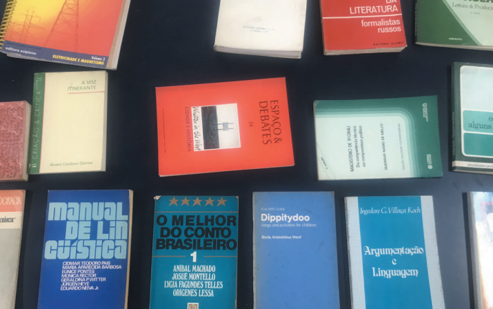
Disponíveis de contos nacionais à autores clássicos russos

A biblioteca Roberto Santos está disponibilizando novos títulos gratuitamente para seus visitantes. A iniciativa faz parte do projeto social “De Mão em Mão”, da secretaria municipal da cultura que prevê a disponibilização de títulos já há algum tempo em quiosques específicos como terminais de ônibus e bibliotecas.