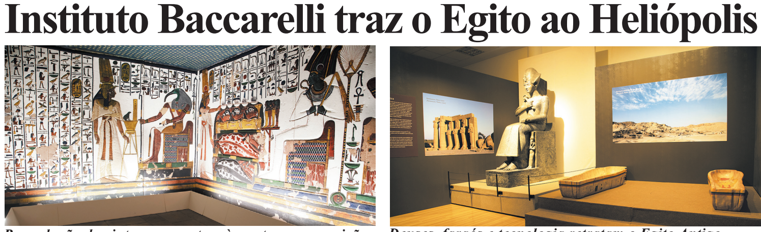
Reprodução de pinturas rupestres à mostra na exposição