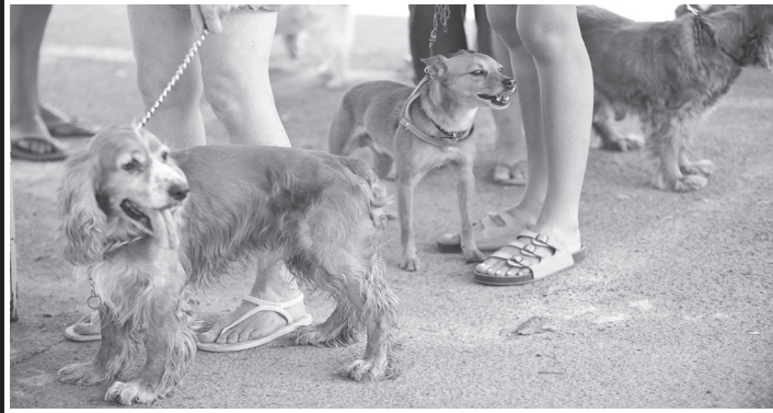
“Amor de Pet” dispõe de 189 cães e 93 gatos para adoção

A Secretaria Municipal da Saúde (SMS), por meio da Coordenadoria de Saúde e Proteção ao Animal Doméstico (Cosap) realiza, no sábado 7 de maio, a festa “Amor de Pet”, para promover a adoção dos mais de 280 animais disponíveis no Centro Municipal de Adoção.