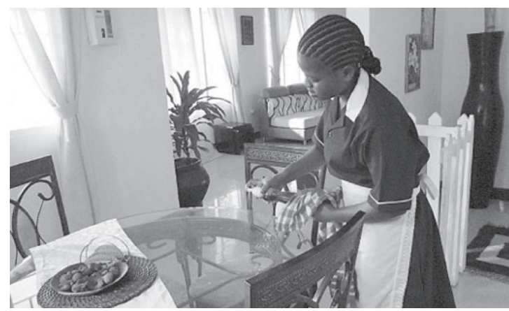
Pais caminha mas ainda mantém desigualdade nas profissões

Renda Ainda segundo os dados do IBGE reunidos pelo Dieese, o rendimento médio mensal das domésticas caiu de R$ 1.016, em 2019, para R$ 930 no ano passado. Segundo a entidade, houve queda em todas as ra-