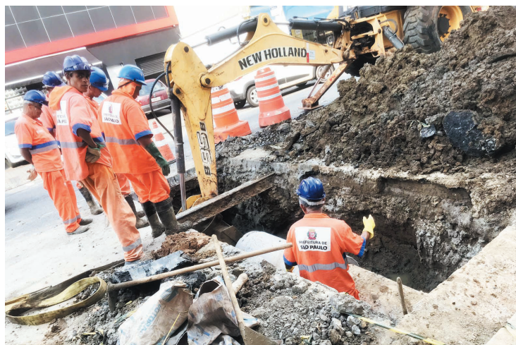
Funcionários da prefeitura trabalham na Rua Silva Bueno

Dois caminhões e cerca de dez funcionários estiveram no local para o serviço. Para denunciar problemas e solicitar serviços em via pública, o munícipe deve procurar a prefeitura de São Paulo por meio do telefone 156 ou através do portal capital.sp.gov.br/solicitacao.