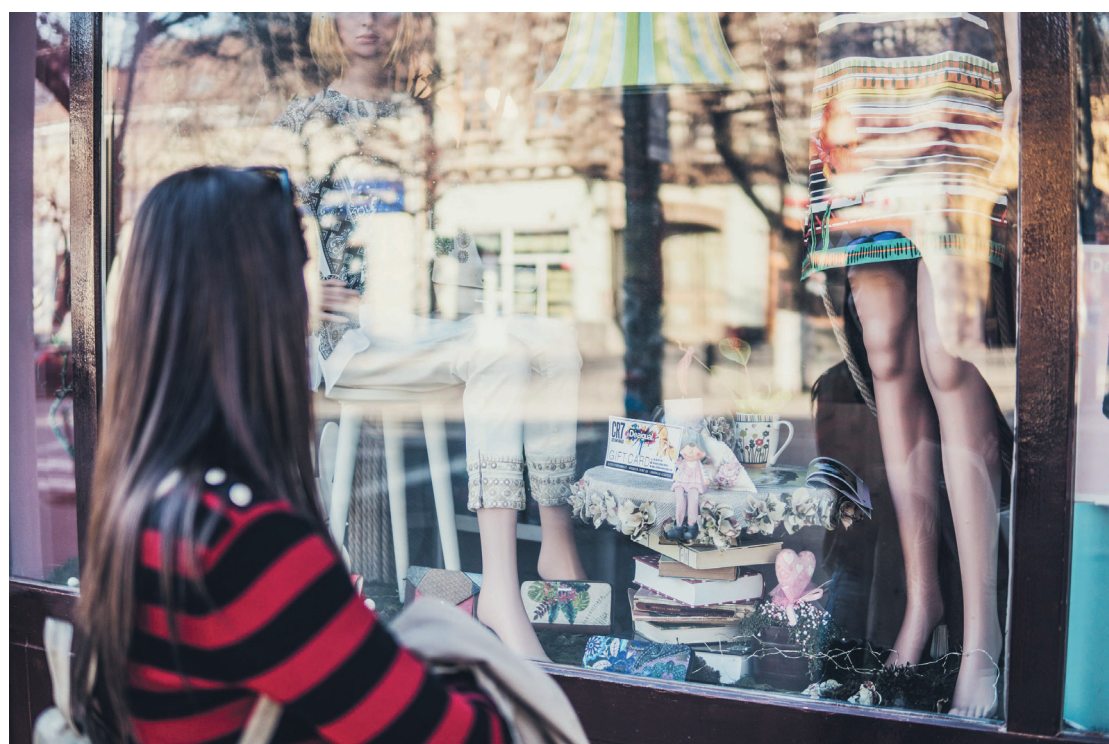
Ipiranguista confere as ofertas em loja de roupas: comerciantes estão mais otimistas

Os comerciantes da região estão mais animados. Não como habitualmente sem pandemia, pois o calendário esse ano não foi tão favorável para os eles; o quinto dia útil do mês é só sexta-