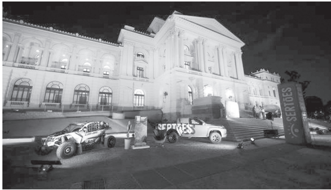
A prova desse ano é uma homenagem a data histórica do bicentenário da independência do país

A largada será na Foz do Iguaçu (PR), que abriga as Cataratas, que em 1986 foi instituída como Sítio do Patrimônio Mundial Natural pela UNESCO, e chega ao mar de Salinópolis (PA), após 7.216km, dos quais 4.811km de trechos cronometrados, cruzando vários estados brasileiros.