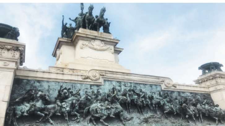
Pisos esburacados, paredes descascadas e ferrugem tomaram conta das edificações que marcam a independência do Brasil

A prefeitura de São Paulo publicou em edital no último sábado (9) a abertura de licitação que prevê a reforma e manutenção do Monumento e da Casa do Grito, ambos localizados no Parque da Independência.