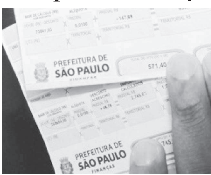
Imposto atrasado já começa a gerar cobrança judicial

A parcela ou as parcelas do Imposto Predial e Territorial Urbano (IPTU) que ficaram em aberto no ano de 2021 foram inscritas em dívida ativa. Isso acontece quando alguém deixa de pagar seu débito com a Prefeitura de São Paulo no prazo de vencimento. Esse débito é inscrito em dívida ativa e a cobrança é feita pela Procuradoria Geral do Município. A cobrança pode ser feita por processo judicial, chamado execução fiscal, e que pode levar ao bloqueio de bens, inclusive dinheiro em conta e mesmo a penhora do imóvel ou também por meios extrajudiciais como o envio de cartas de cobrança. A regularização pode ser feita pelo portal da dívida ativa, sem qualquer necessidade de atendimento presencial. Basta acessar a página dividaativa.prefeitura.sp.gov.br, clicar na opção “consulta e pagamento” e selecione o critério IPTU - a consulta é feita pelo número do contribuinte que aparece no carnê do IPTU. Os débitos até R$ 171 mil podem ser parcelados em até 36 vezes, desde que o valor mínimo da parcela seja de R$158,00. Já débitos acima de R$ 171 mil podem ser parcelados em até 60 vezes, desde que o valor mínimo da parcela seja de R$4.600,00.