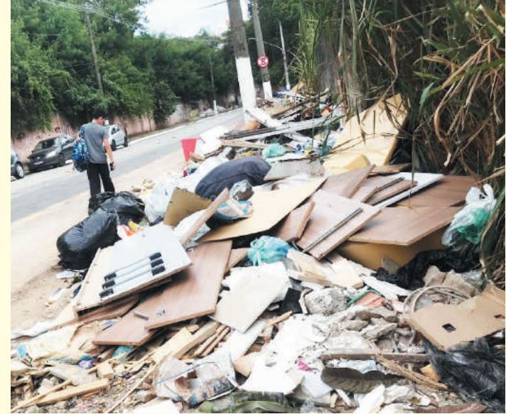
Aproximadamente 30 metros de lixo em calçada de terreno

Um terreno baldio localizado na Avenida Carioca, próximo ao barracão da escola de samba Imperador do Ipiranga, na Vila Carioca, virou ponto de descarte irregular de lixo. A quantidade de detritos já ocupa cerca de 30 metros do calçamento do terreno.