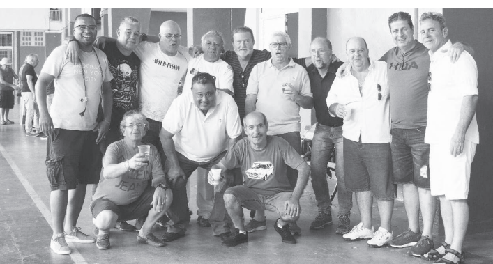
Reencontro da galera do ginásio dos anos 1960 e 1970