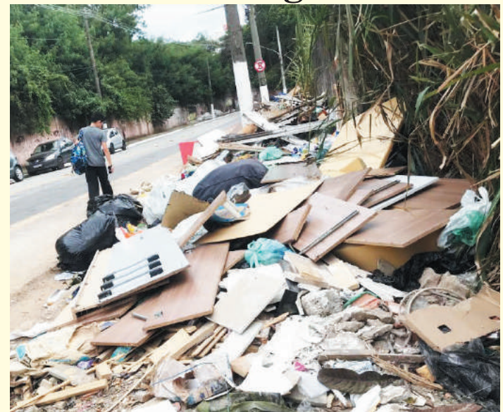
Lixo é despejado na calçada a 500 metros do Ecoponto. PÁGINA 6