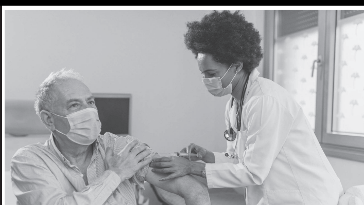
Vacina contra a Covid 19 para idosos acima dos 60