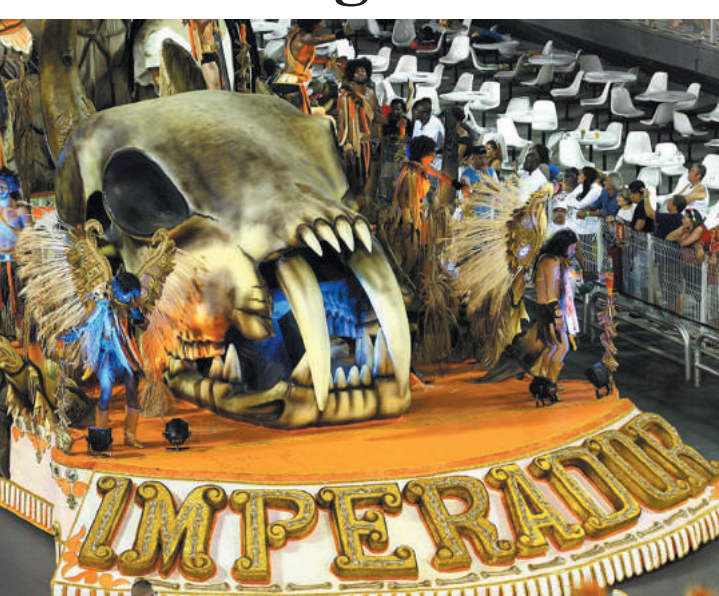
A agremiação fala dos atuais problemas da humanidade. PÁGINA 3