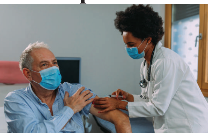
Combate a gripe, sarampo, covid 19 e poliomielite nos postos. PÁGINA 2