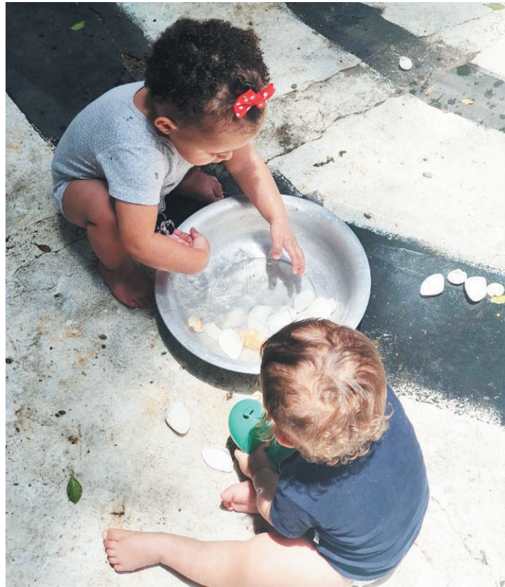
Programa visa desenvolver a linguagem e a diversidade