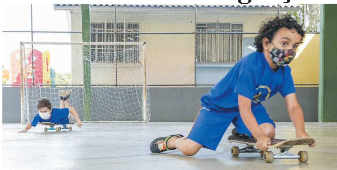
Crianças em aulas de skate desenvolvendo novas habilidades por meio do esporte

O CEU Meninos, no São João Clímaco, em parceria com a ONG Skate Solidário tem aulas de skate para jovens entre 6 e 16 anos. Mais de 300 crianças e adolescentes serão contempladas com aulas em Centros Educacionais Unificados (CEUs). A prática também pode ser realizada nas demais escolas por meio do repasse de Programa de Transferência de Recursos Financeiro (PTRF) e colaboração com os profissionais de educação física.