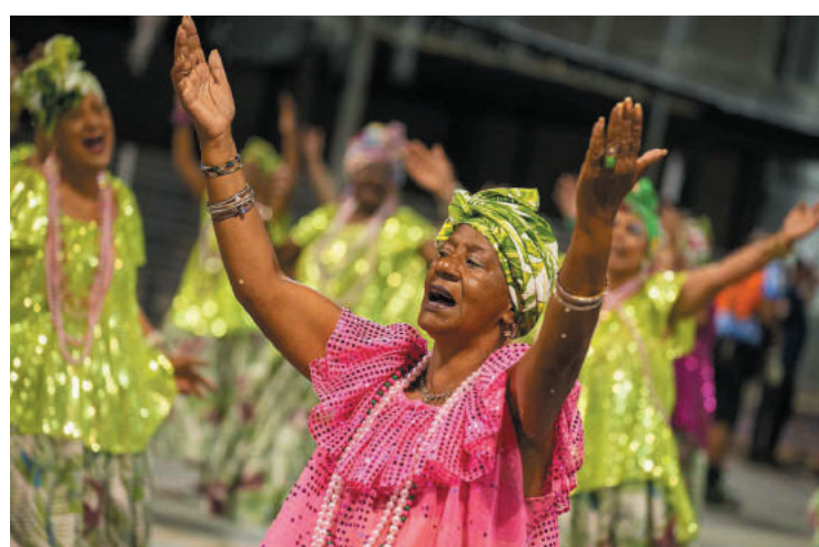
Carnavalesca da ala das baianas em ensaio técnico pela escola