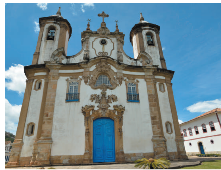
Originais de Aleijadinho na Nossa Senhora do Carmo (acima)

Em 1698, o ouro começou a ser explorado, e ao redor das minas surgiu um arraial que, em 08 de julho de 1711, foi elevado à vila e, em 1823, a cidade imperial e capital da Província de