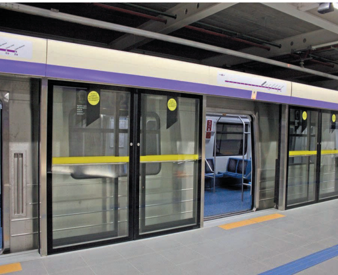
As portas de contenção foram instaladas em todas as 17 estações da linha Lilás do metrô

Finalmente todas as estações da linha 5-Lilás estão com portas nas plataformas. Depois de sucessivos atrasos na entrega e implantação pela canadense Bombardier (atualmente parte da Alstom), a partir deste domingo, 20, o equipamento está em operação em todas as 17 estações, meta que deveria ter sido atingida em 2021.