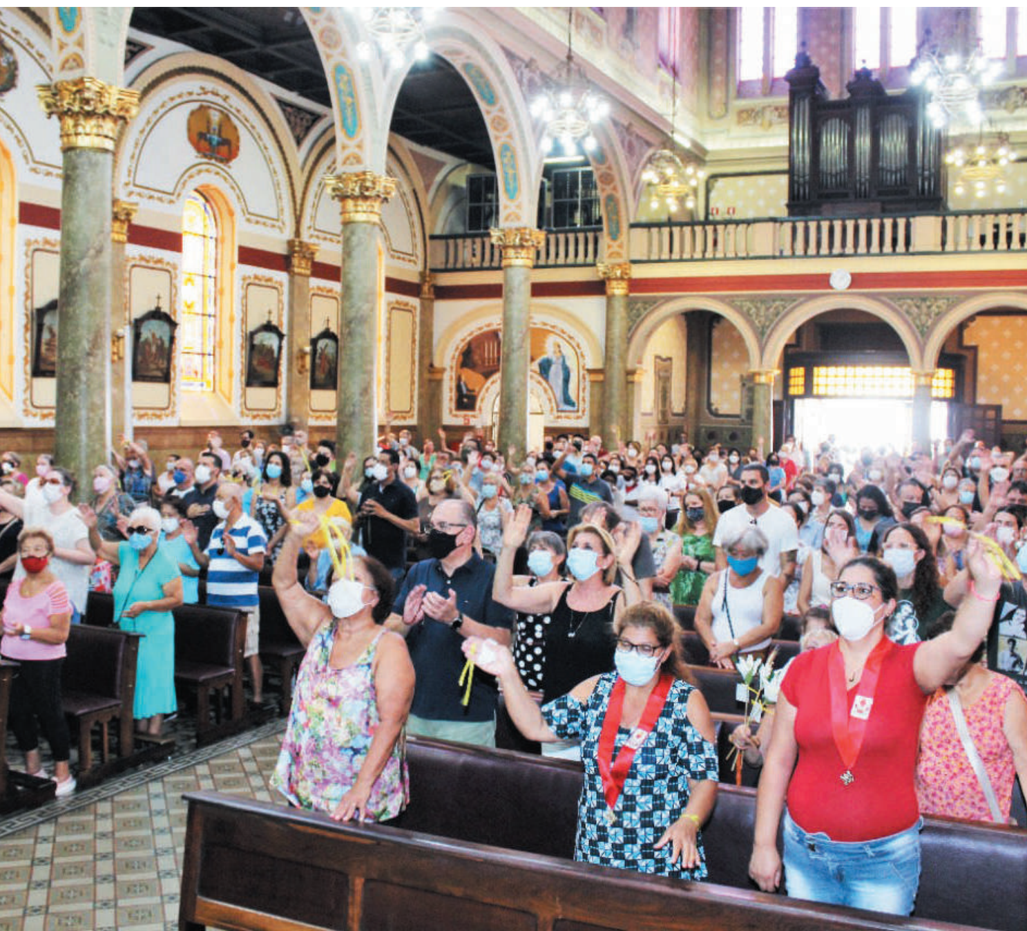
Pandemia afastou os fiéis de São José por dois anos, no sábado, 19, eles voltaram e lotaram a igreja. PÁGINA 3