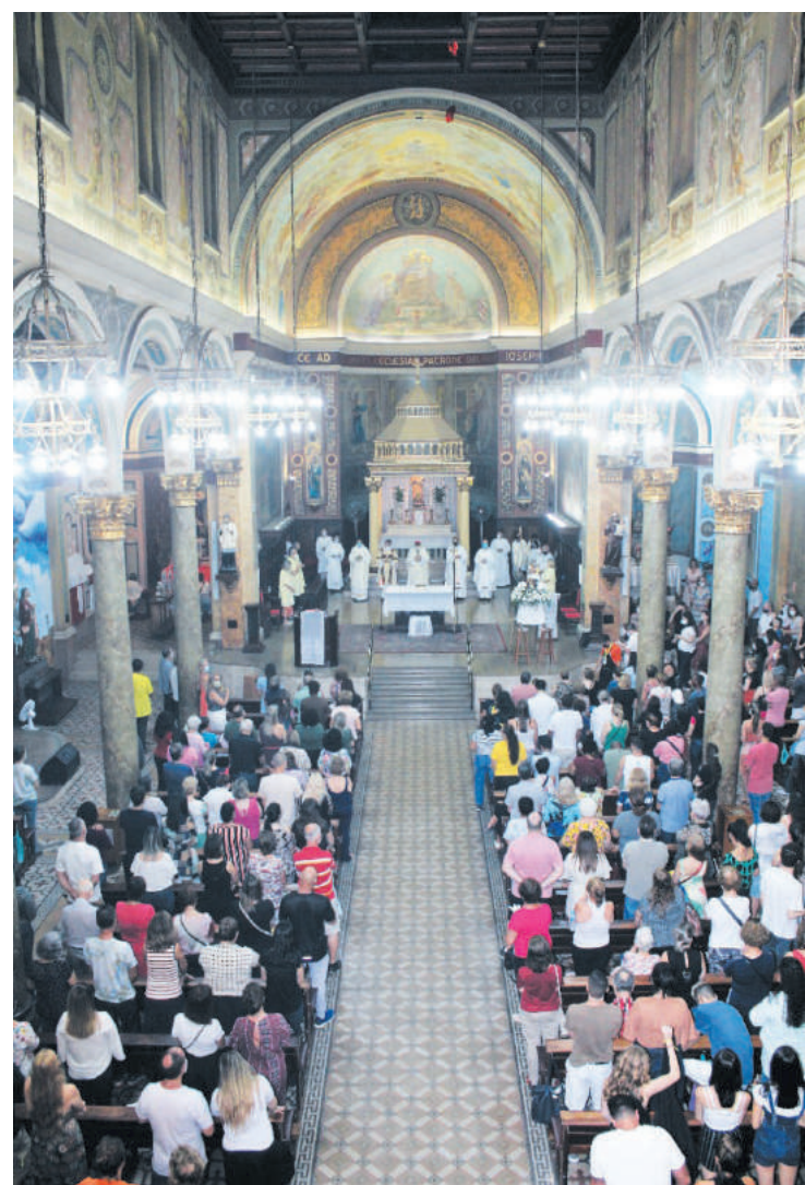
Foram rezadas nove missas ao todo com espaço lotado

A Paroquia São José agora se prepara para a celebração da semana santa em abril e para a festa junina visto que não eram celebradas igualmente há dois anos.