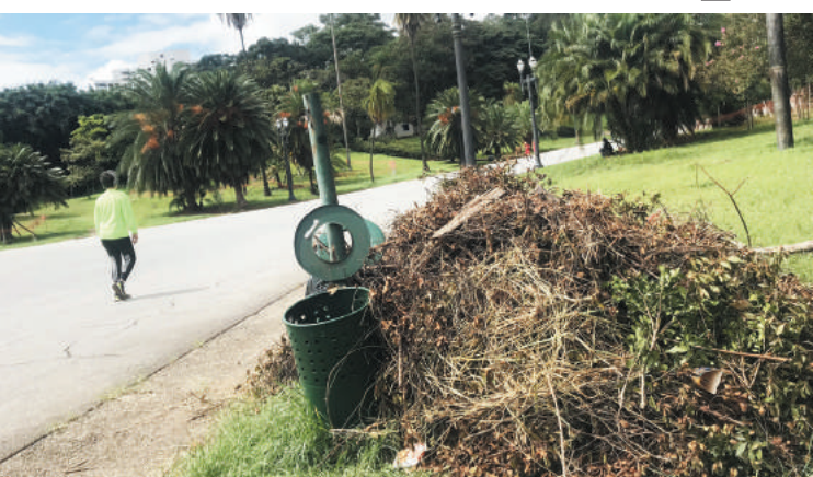
Frequenteros reclamam de acúmulo de sujeira e realizam atividades físicas em meio ao jardim por fazer (ao lado)