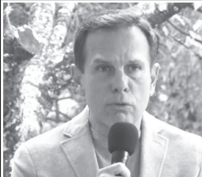
Queda no número de internações flexibiliza uso em ambientes abertos

O Governador de São Paulo João Doria assinou o decreto de flexibilização do uso de máscaras no estado. A partir de agora, o uso em locais abertos não é mais obrigatório. Além dessa medida, Doria confirmou a liberação de 100% da capacidade de público em eventos que sejam realizados em ambientes abertos, como shows e estádios de futebol, entre outros.