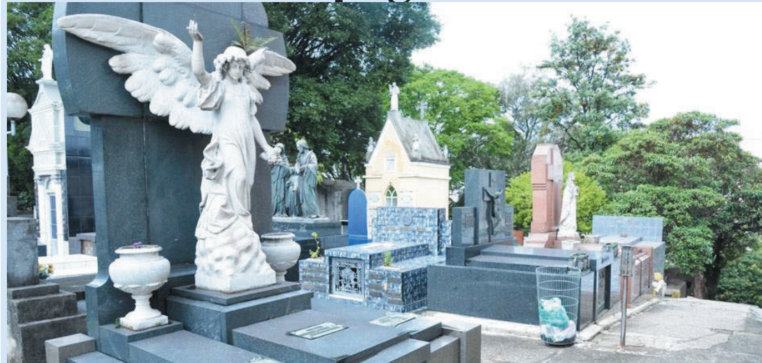
Valor cobrado por uso de espaço em cemitérios depende da região em que se encontra a cova

Morar em São Paulo é caro, por isso proliferam habitações precárias, à beira de córregos, morros e invasões em áreas de mananciais. Consumir nem se fala, pois a cesta básica em São Paulo é uma das mais caras do Brasil. O único custo, até agora, compatível em São Paulo era morrer.