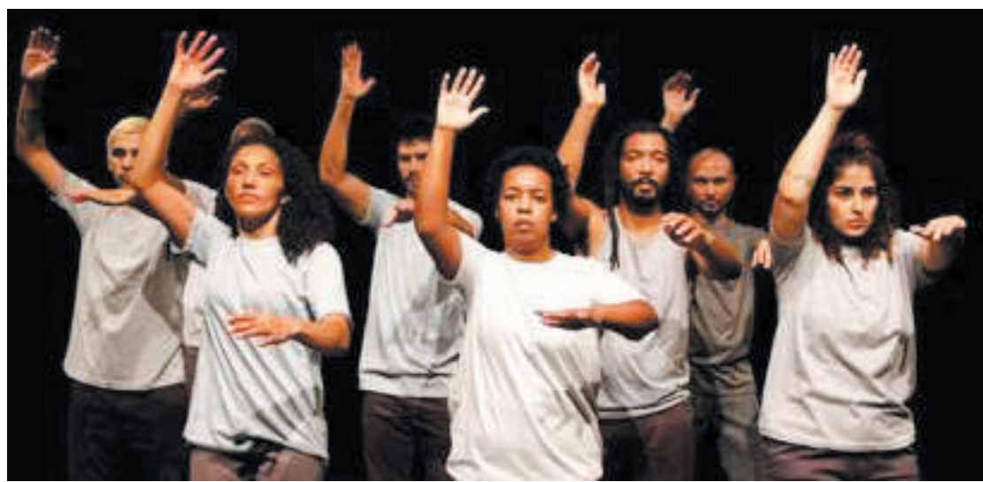
Peça terá início nesse sábado e conta a história de mulheres que vivem sob imposição dos homens

Como já é característico nas encenações da Companhia de Teatro de Heliópolis, o espetáculo explora as ações físicas para construir um discurso poético e expressionista das relações de poder e da situação de cárcere. A música ao vivo potencializa esse discurso nas cenas coreografadas que denunciam e evidenciam o cotidiano em questão. O futebol, a comida, as humilhações, a disciplina imposta são passagens