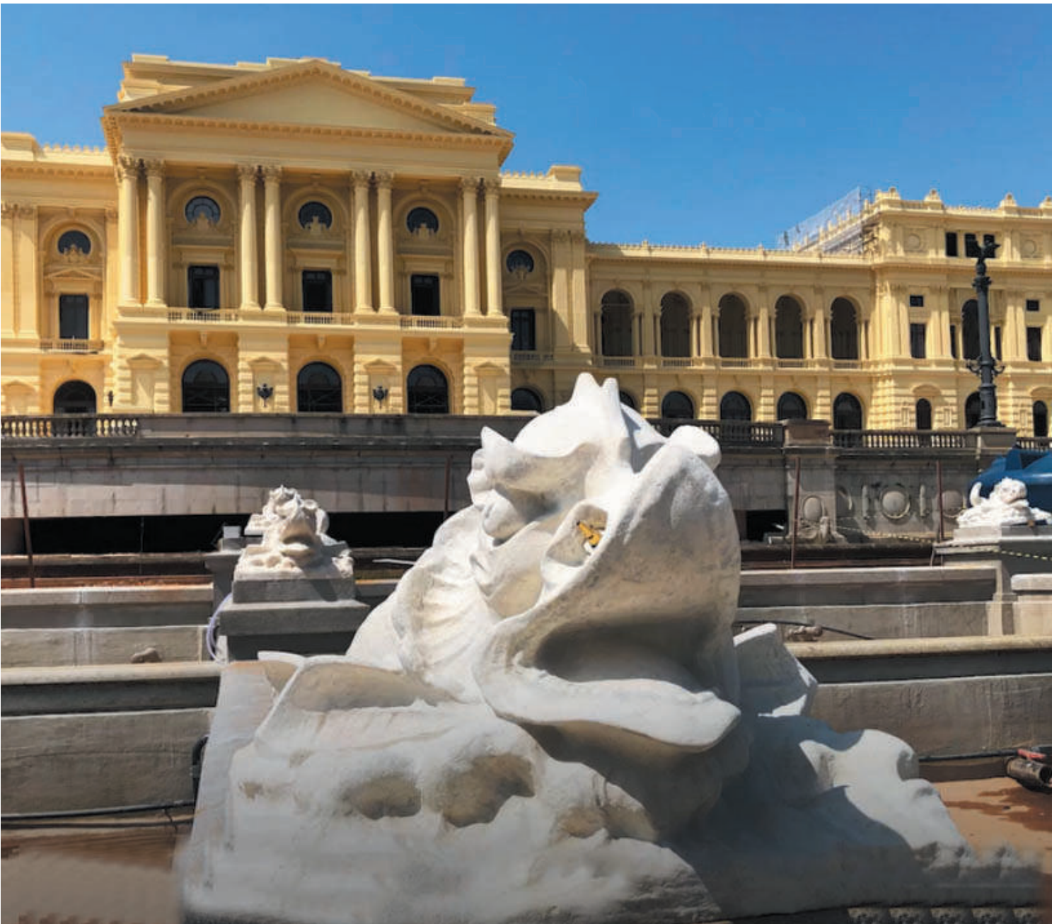
Restauração do Jardim Francês do museu do Ipiranga estão avançadas e serão concluída no prazo. PÁGINA 3