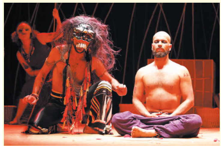
Produção sobre Buda acontece entre os dias 11 a 13 de março

O Sesc Vila Mariana vai apresentar, entre os dias 11 a 13 de março, a aventura do príncipe Sidarta, personagem que alcançou a Iluminação e se tornou Buda, encenada no musical “Buda”, produção da Banda Mirim. O espetáculo explora a figura mítica para exercitar a empatia e o autoconhecimento.