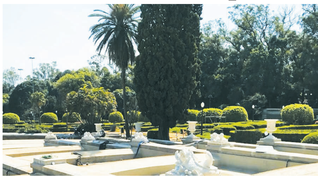
Área passa por restauro bastante expansivo e ganha novo visual, além do aumento da segurança

Na foto é possível notar que parte do jardim com árvores e arbustos e os ornamentos brancos, já estão recuperados. Também é possível verificar os ornamentos, podendo ser identificados como delfins estilizados, e mais ao longe a parte de trás do museu, já com sua fachada recuperada.