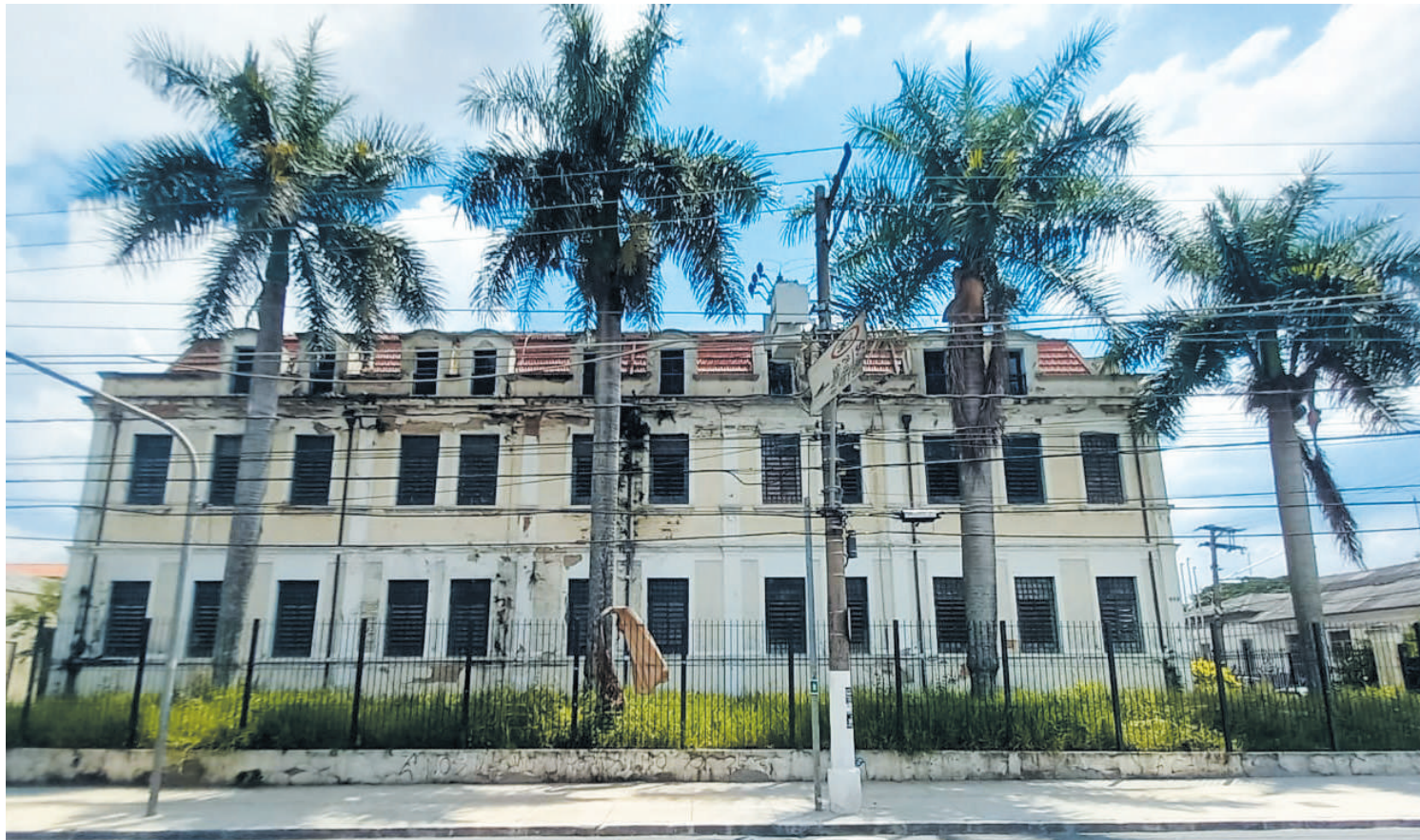
Prédio histórico na Av. Nazaré deve se tornar unidade da Escola Mais. Obras ainda não começaram. PÁGINA 3