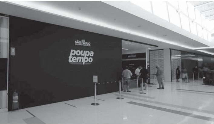
Postos param atividades e voltam a funcionar no 2 de março, ao meio-dia

Os postos do Poupatempo estarão fechados para o atendimento presencial nos dias 28 de fevereiro e 1º de março. A medida atende ao decreto que estabeleceu ponto facultativo nas repartições públicas do Estado na segunda e terça-feira de Carnaval, e a retomada do expediente após às 12h da Quarta-Feira de Cinzas.