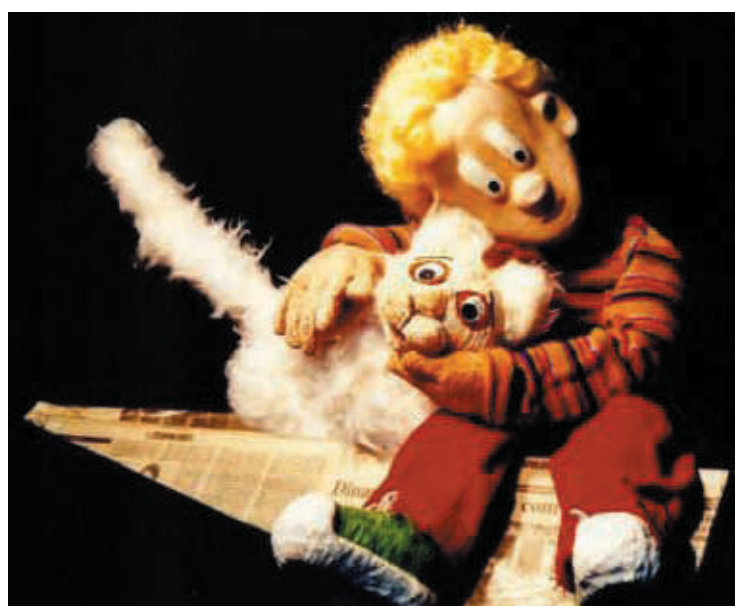
Obra voltada as crianças será apresentada no domingo, às 11h

Criada em 1990, a Cia Truks é referência nacional na arte do Teatro de Animação, bem como um dos principais expoentes do teatro para crianças no Brasil. Recebeu os principais prêmios do segmento: Mambembe do MinC, APCA, Coca Cola de Teatro Jovem, O Teatro Cidadão, da Prefeitura de São Paulo, e o Estímulo da Secretaria de Estado da Cultura de São Paulo, entre outros. Coordenou o Centro de Estudos e Práticas do Teatro de Animação de São Paulo, espaço de referências desta linguagem artística, em