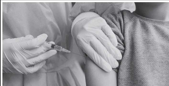
Mais de 70% da população infantil já foi vacinada em São Paulo

A campanha de vacinação contra a Covid-19 da cidade de São Paulo segue ganhando cada vez mais destaque no mundo. Após o início da imunização de crianças de 5 a 11 anos de idade, em janeiro deste ano, a capital paulista já atingiu taxas de cobertura vacinal superiores às de outras grandes cidades como Nova York, nos Estados Unidos, e Toronto, no Canadá.