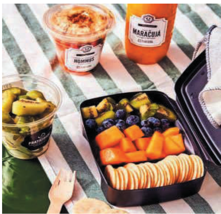
Pais e responsáveis devem ficar atentos a alimentação saudável

Nascido em 2007, a Quitanda é um mercado de produtos frescos de altíssima qualidade muito bem estabelecido no bairro de Pinheiros. O estabelecimento, que pertence ao grupo familiar Raízes, fincou pilares sólidos no universo da gastronomia, da saudabilidade e da sustentabilidade, cativando um público fiel e atendendo atualmente cerca de 60 mil clientes ao mês.