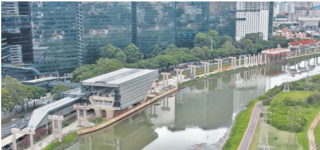
A proposta para instalação elétrica do ramal da Linha Ouro foi alterado para o dia 15 de março

A implantação da Linha 17-Ouro, de monorail, tem sido a mais problemática da história do Metrô de São Paulo. As obras estão perto de completar 10 anos sem que exista uma previsão segura sobre a inauguração do trecho prioritário.