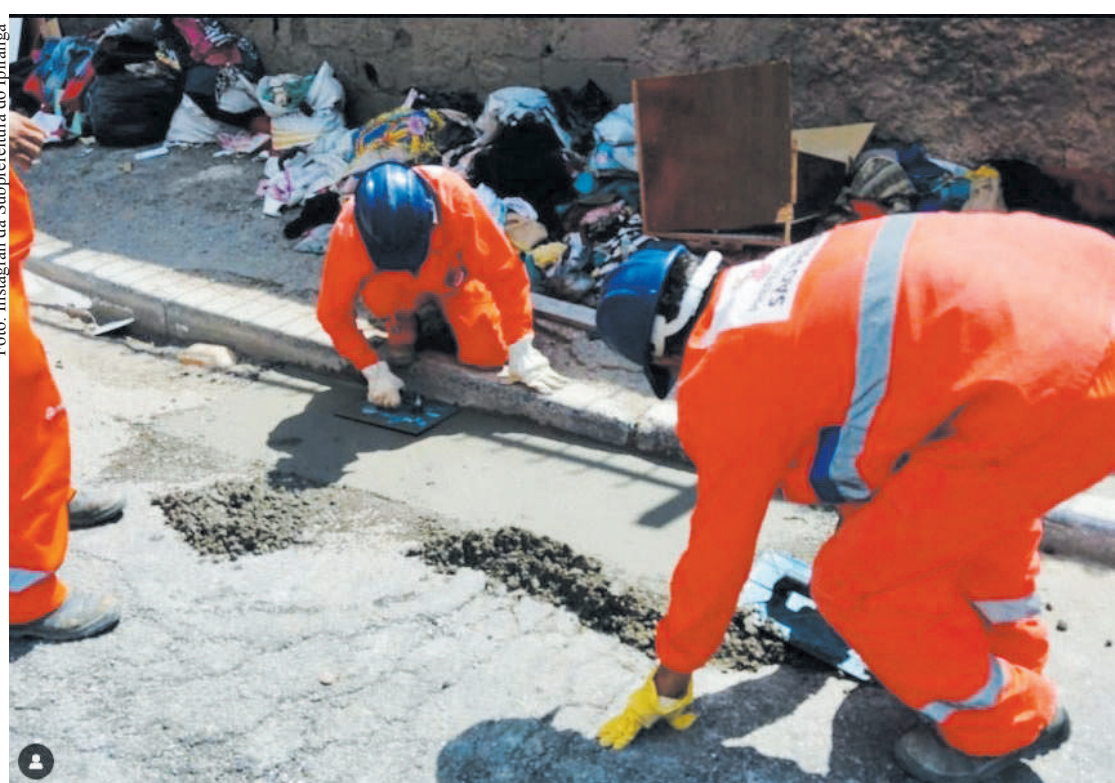
Subprefeitura mostra concretagem de 2m de sarjetão e revela um lixão na Avenida do Cursino

A foto acima, publicada no Instagram da Subprefeitura do Ipiranga, é uma clara demonstração do abandono em que se encontram as ruas do bairro.