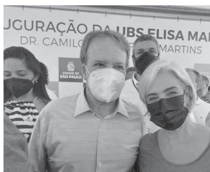
Boato sobre o fim das atividades foi desmentido pelo secretário

"Como vereadora escolhida por você, morador da