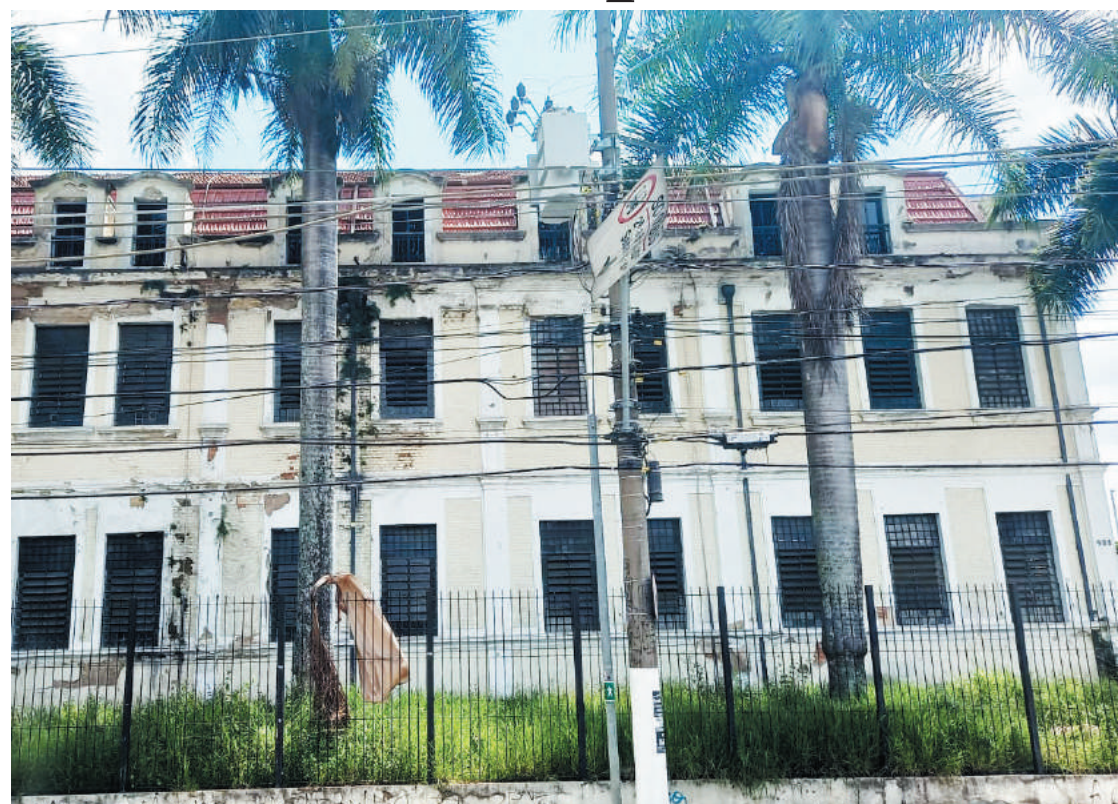
Edifício deve manter fachada histórica e passar por reforma interna para abrigar lar estudantil

Embora não seja uma exigência da fundação dona do local, a preferência da Funsai é que no imóvel venha a funcionar uma entidade de ensino. A fundação foi procurada por empresários de diversos ramos, que tinham a intenção de transformar o espaço em outro tipo de comércio, mas a vontade de seus proprietários está voltada para