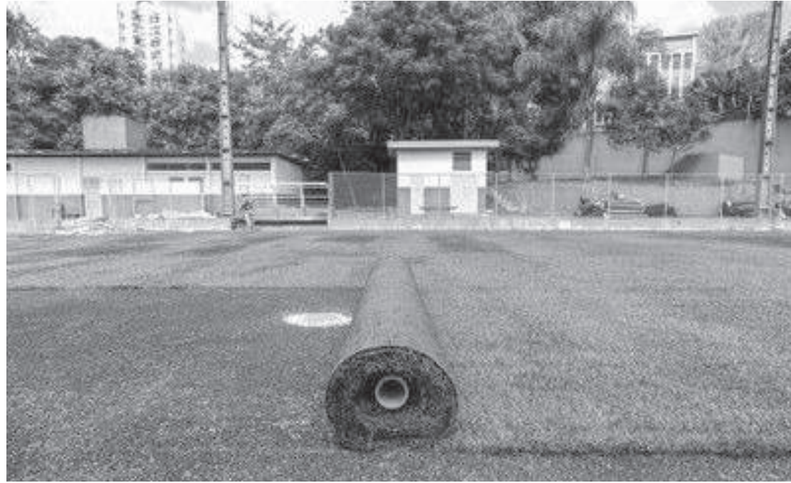
Sonho antigo dos moradores da região, campo de futebol terá novo gramado para atender aos esportistas

O Centro Esportivo Vila Guarani, está passando por ampla reforma em seu campo. A reforma está em fase final e a previsão é de que até o dia 25 de fevereiro os usuários ganhem um novo campo de grama sintética.