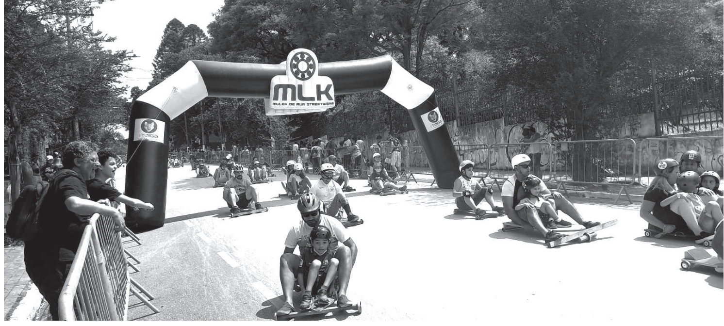
Muitas famílias participaram da Descida Carrinho de Rolimã, evento realizado na Rua Bom Pastor, na Virada Esportiva do bairro

A alegria tomou conta das ruas do Ipiranga na tarde de domingo (5). Pais, mães, filhos, netos, pessoas de todas as gerações participaram da Descida Carrinho de Rolimã Mulek de Rua, evento realizado na Rua Bom Pastor. Parte da via se tornou uma verdadeira pista para a prática de carrinhos de rolimã e trouxe diversão para os moradores e visitantes do bairro.