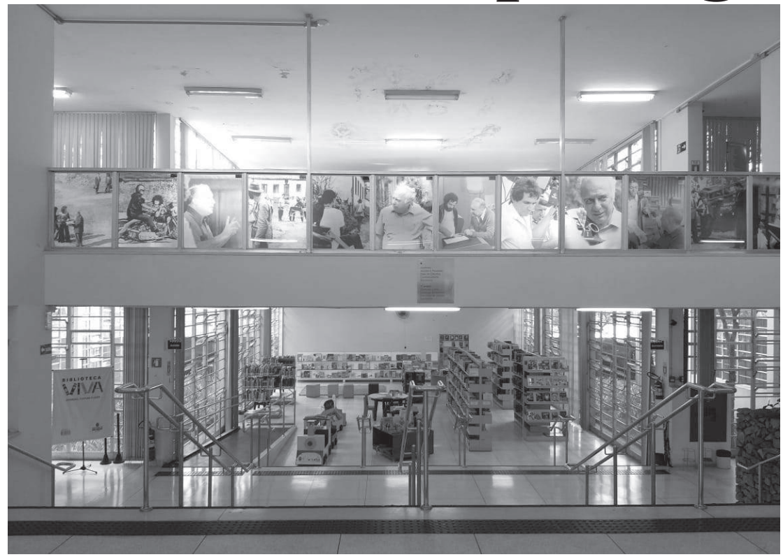
Edição do Festival acontecerá nos dias 10 a 17 e terá parte presencial na Biblioteca Roberto Santos

Os filmes brasileiros trazem um olhar diferente que visibilizam a pluralidade do cinema nacional. Alguns títulos serão exibidos pela primeira vez numa sala de cinema de São Paulo, como o premiado "Carro Rei", de Renata Pinheiro, o documentário "Ossos da Saudade", de Marcos Pimentel, o suspense "As Almas que dançam no escuro", de Marcos DeBrito, o drama "Desterro", de Maria Clara Escobar, inédito em São Paulo, e o híbrido "Alianças Profanas - esquizofrenia", de uma mente fragmen-