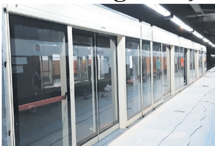
Processo de colocação demorou 35 dias e reduz interferências

Ainda de acordo com o presidente do Metrô, um dos fatores que contribuiu para este resultado foi a modularidade das portas de plataforma, procedimento inédito no Brasil. Os componentes foram fabricados na Coreia do Sul e os módulos foram montados na cidade de Araras, no Interior do Estado. Depois, seguiram