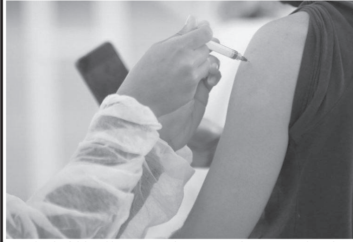
Mais de 800 mil pessoas devem receber a terceira dose

A cidade de São Paulo começa a aplicar nesta quinta-feira (18) as doses de reforço para os maiores de 18 anos que receberam a segunda dose (D2) dos imunizantes Coronavac, Astrazeneca e Pfizer. Na quinta-feira, podem comparecer todos aqueles que receberam a D2 até o dia 27 de abril. Na sexta-feira é a vez dos que tomaram a D2 até o dia 17 de junho. Todos receberão a dose de reforço da Pfizer. Para os dois grupos, são esperadas 800 mil pessoas. De acordo com o secretário municipal da Saúde, Edson Aparecido, com essa iniciativa a capital terá a possibilidade de acelerar ainda mais o processo de vacinação oferecendo mais segurança aos paulistanos. “Nesta terça-feira, a capital ultrapassou a marca de 1 milhão de doses de reforço aplicadas na cidade de São