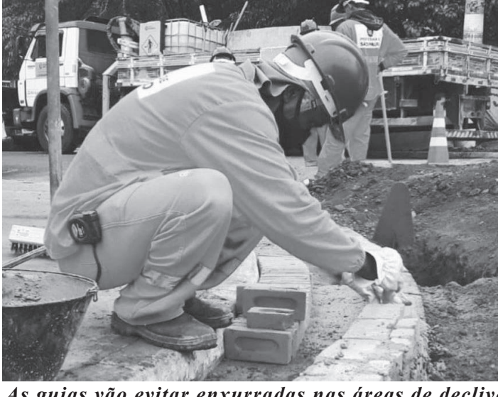
As guias vão evitar enxurradas nas áreas de declive

A subprefeitura de Ipiranga está realizando a construção de pequenos jardins na av do Cursino, em pontos onde exista declive para a captação de água evitado, assim, enxurrada no local. A notícia consta no Instagram da subprefeitura, destacando a medida esta sendo adotada em todas subprefeituras de São Paulo. O objetivo é transformar a paisagem urbana nas diversas regiões da capital ajudando a colocar mais verde nas ruas e