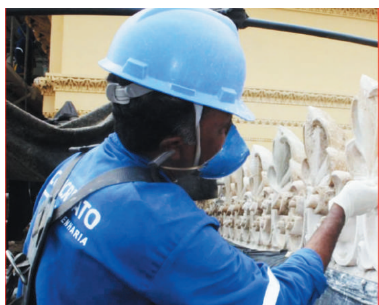
Mais de 70% da reforma está pronto há dez meses do prazo

meses para a festa de comemoração do bicentenário da Independência, em setembro de 2022, segundo os responsáveis pela obra, 70% do trabalho de