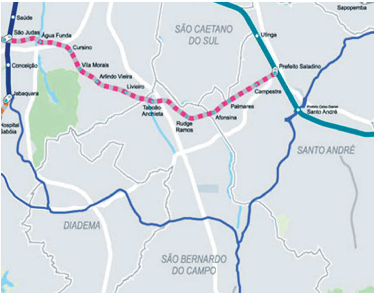
Percurso que vai ligar a Lapa ao ABC terá quatro paradas na região do Ipiranga. PÁGINA 3