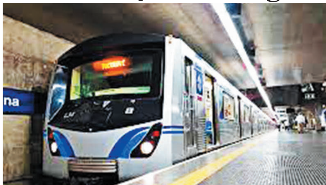
Trajeto vai ligar a Lapa ao ABC paulista e a expectativa é que esteja pronto em 2030

A expectativa é que a nova linha possa atender cerca de 1 milhão de pessoas por dia. Especialistas em transporte público e mobilidade urbana apontam que, se o cronograma for seguido, o projeto pode começar a sair do papel na segunda metade da década para as obras ficarem prontas por volta de 2030.