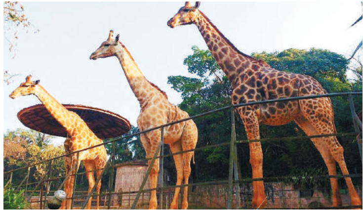
Parque poderá receber novamente a presença do público em outubro visitas monitoradas.

A direção do zoo salienta que diante do cenário atual criado pela pandemia de Covid-19, faz-se necessário que a sociedade crie ou adote estratégias que contribuam para a realização de suas atividades econômicas, sociais, educativas e culturais de forma segura, visando o controle da doença. Por essa razão é que o parque esta tomando todas as precauções e os protocolos sanitários para retomar as