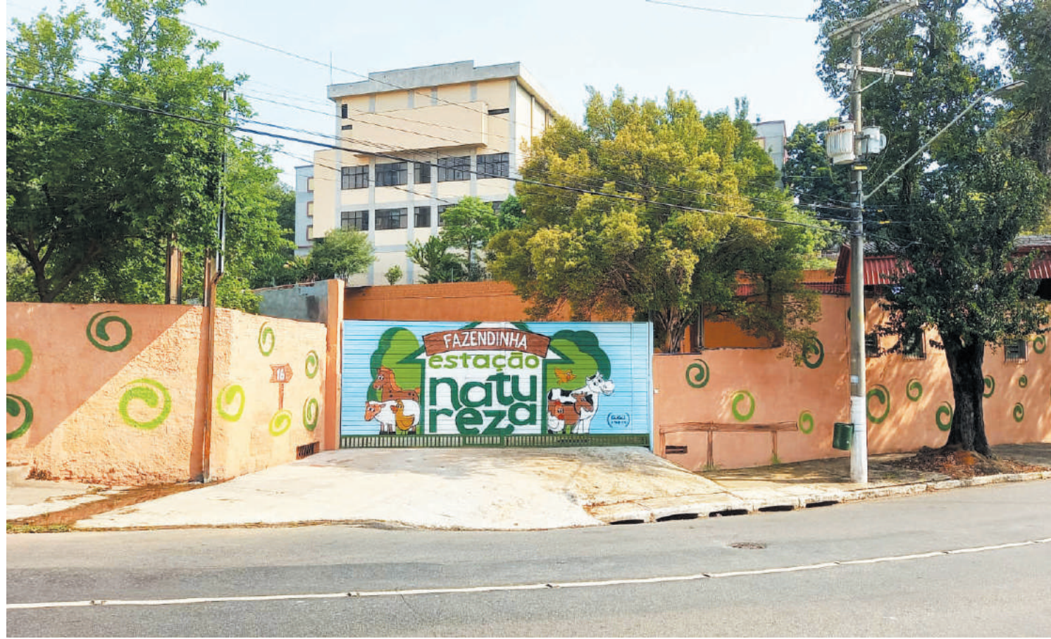
Local na Rua Moreira e Costa traz clima rural para a cidade e será inaugurado no sábado. PÁGINA 4

ReVitali Recuperação Auditiva e Multidisciplinar