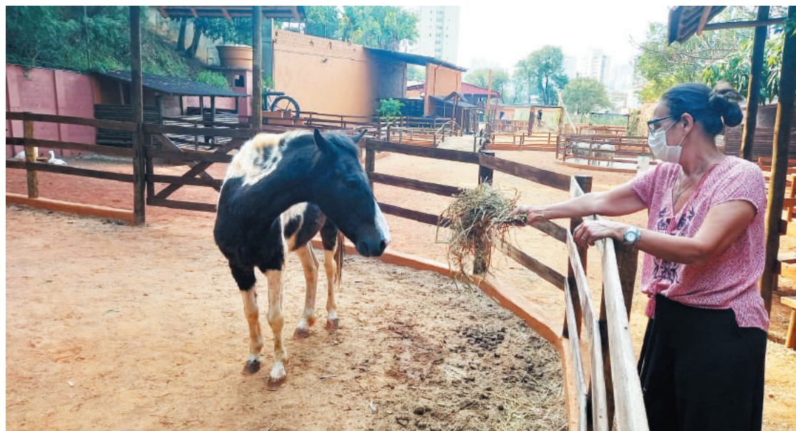
Visitantes terão monitoramento sobre processo de alimentação dos bichos e aulas para a prática do plantio

A Fazendinha, como é carinhosamente chamada, está com as portas abertas ao público apenas aos fins de semana. Porém, no período de férias escolares, as pessoas poderão visitar o local. Nos dias de semana, são permitidas somente as visitas agendadas de escolas.