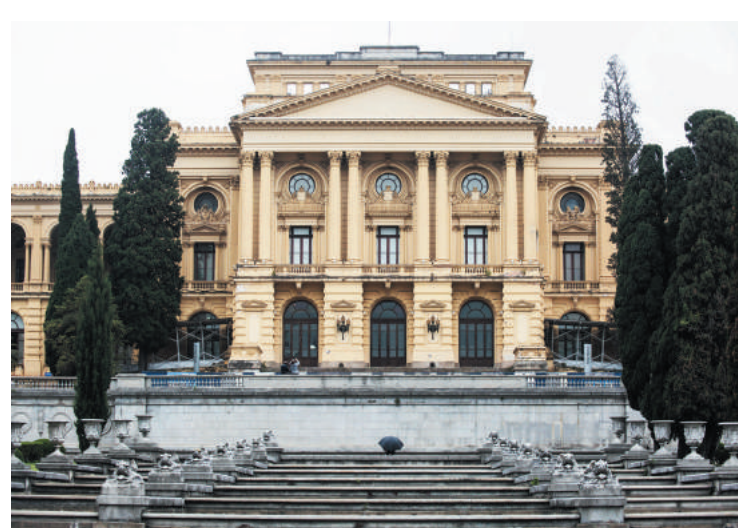
Obras mantêm originalidade e deixam visual mais arrojado e dinâmico

gigante, com 26 metros de largura, por exemplo, vai possibilitar para quem estiver no prédio, ter a sensação de estar também dentro no Jardim Francês. Localizada no eixo das fontes, entre as novas portas de acesso, a grande janela está sendo construída no muro de contenção do desnível, na área de ampliação do Museu. Para garantir sua sustentação, já foi instalada uma viga arrojada, com cerca de 30m de comprimento, de formato triangular, que comporta caixões perdidos (vazios) executados com formas metálicas. O granito existente na amurada será consolidado à viga com a fixação de pinos de aço. Só depois deste delicado pro-