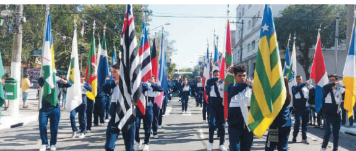
Programação de aniversário do bairro inclui gastronomia e segurança

Nessa segunda-feira, dia 27, o Ipiranga comemora 437 anos. O aniversário, em função da pandemia da covid-19, será bem diferente de todos os outros anos. Não haverá desfile, baile e concursos, mas terá uma programação diversificada. As comemorações em relação a data serão bastante variadas e só terminarão no dia 2 de outubro. Um dos temas tratados é a gastronomia. Restaurantes e lanchonetes do bairro que fazem parte do projeto dos festejos realizam promoções com fins voltados à solidariedade.