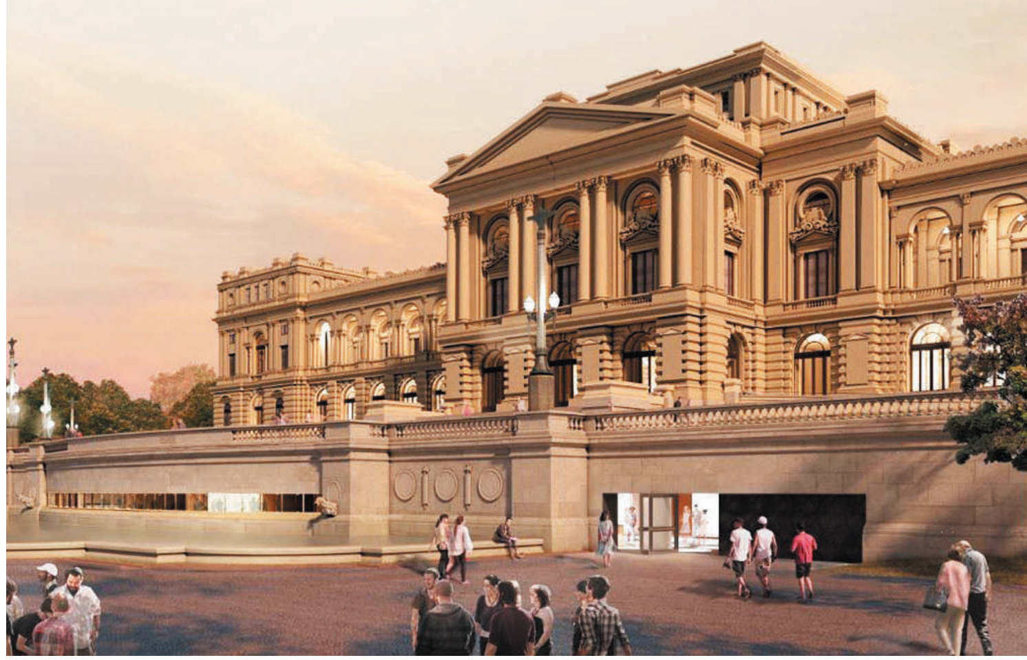
Novas instalações deixam marco da independência com uma nova identidade visual. PÁGINA 3