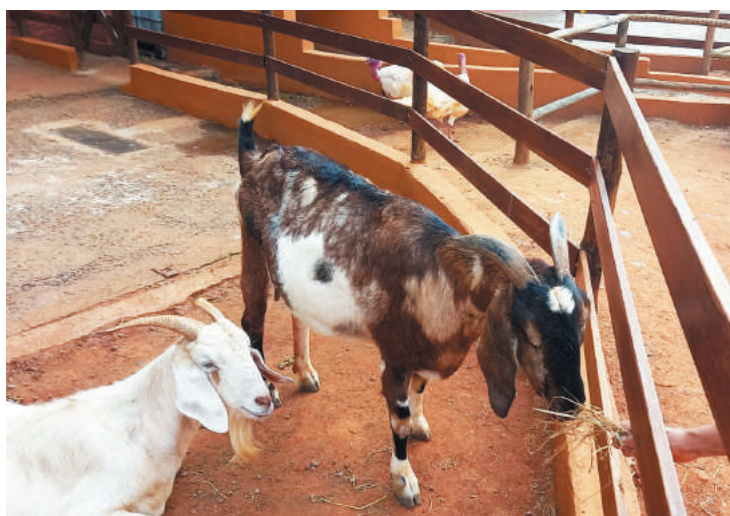
Espaço será inaugurado no sábado e permite aproximação com animais

O Ipiranga vai ganhar um espaço rural totalmente dedicado a natureza e aos animais, focado no convívio com o público infantil. No sábado, dia 25, será inaugurada a Fazendinha Estação Natureza. O projeto iniciado em 1995 e que já passou pelos bairros de Santo Amaro e Brooklin, agora está em novo lugar, na Rua Moreira e Costa, número 16. A mini fazenda possui diversas atrações, como visitas aos animais, o conhecimento de suas características, plantio, entre outras diversas atividades ligadas a natureza. O espaço estará aberto a visitação do público somente aos fins de semana, das 10 às 17h, pelo valor de R$ 60. As visitas devem ser obrigatoriamente agendadas anteriormente pelo site ( www.estacaonatureza.com.br ), ou pelos telefones 5034-2728 / 5034-0937 / 96928-6055 (whatsapp). Crianças com menos de dois anos de idade e idosos acima dos 65 anos, não pagam. O estacionamento custa R$ 18. O local onde será a Fazendinha Estação Natureza é de propriedade do Instituto São