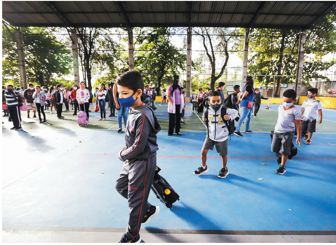
Processo de continuidade nas instituições estudantis é digital e pode ser feito também por aplicativo

Também é possível fazer a rematrícula pela aplicativo Minha Escola SP. E presencialmente