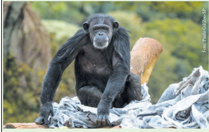
Primatas precisam de cuidados específicos durante o frio

Para quem visitar o parque durante essa época do ano, a dica é realizar o passeio nos horários mais quentes do dia, pois os animais irão procurar se expor ao sol para se aquecerem e, dessa maneira, será mais fácil visualizá-los nestes momentos.