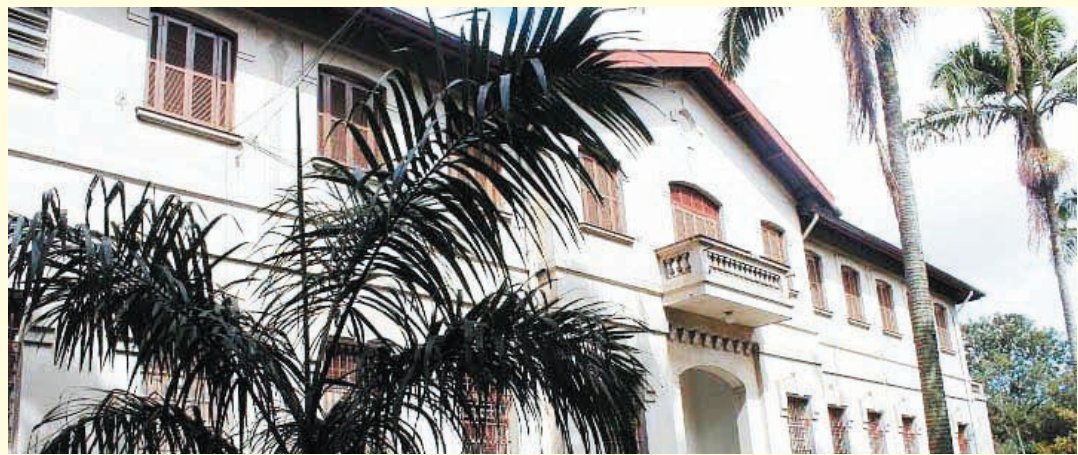
Caminhada passará no dia 11 por edifícios tombados historicamente no bairro