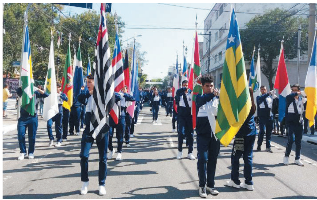
Desfiles cívicos vão dar lugar a apresentações virtuais no aniversário do Ipiranga