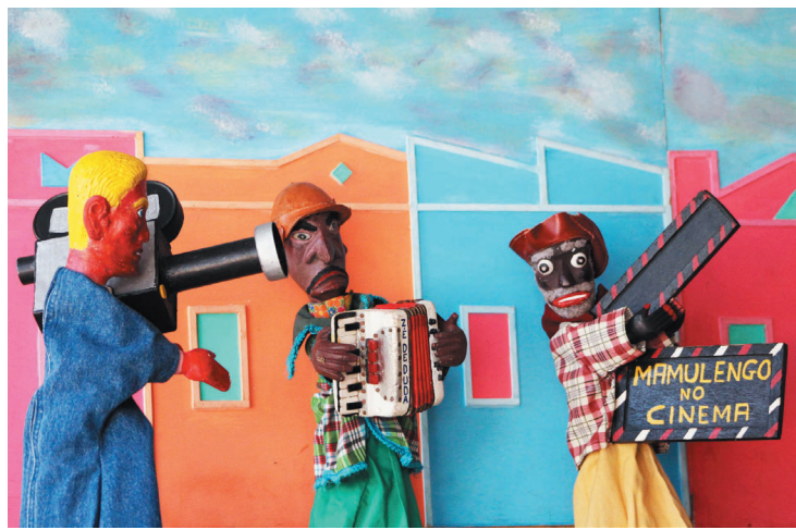
Mamulengo será exibido nesse fim de semana na Mooca

E para celebrar os 38 anos de carreira, qual o melhor lugar para se comemorar essa festa, se não, indo ao encontro do povo, levando seu trabalho para apreciação, alegria e encantamento?