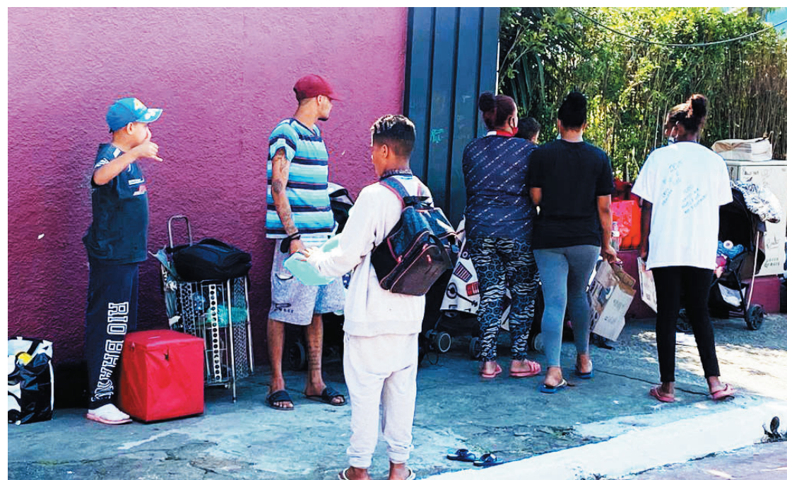
Mesmo em momentos difíceis, até o fato de pedir comida é compartilhado por moradores de rua

O desemprego já chega a 14 milhões de brasileiros (população maior que Portugal), a fome está presente em milhares de famílias e as ruas se transformaram em lar para aqueles que perderam seus lares. O Brasil já é um País com milhares de miseráveis, graças a pandemia do covid-19. Essa é uma triste realidade. Mas a solidariedade, nessas horas, fala mais alto, no compartilhamento da dor, da fome e da miséria. Alguém pode questionar se a fome pode ser compartilhada, no entanto basta olhar com mais atenção a legião de pessoas nos faróis pedindo alimentos, pois de maneira organizada, eles se dividem para pedirem comida. No farol da rua Rodrigo Vieira esquina com Ricardo Jafet, no Ipiranga, essa cena é uma