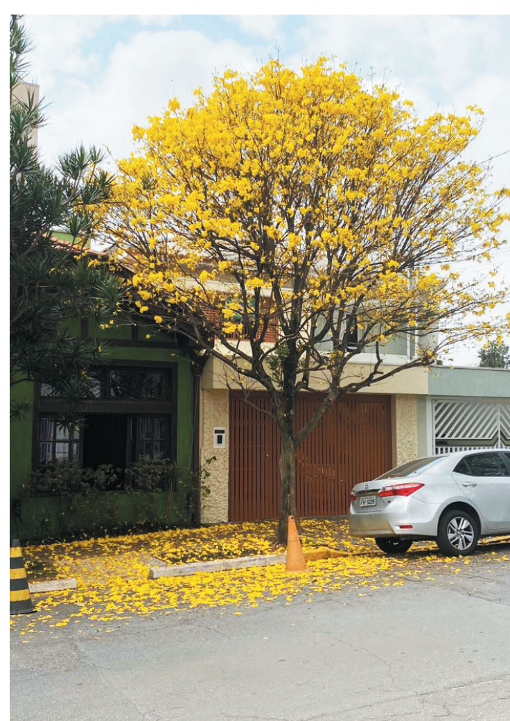
Ruas do bairro ganharam tom amarelado nos últimos dias

O clima frio e seco tem ajudado as ruas do Ipiranga a ganharem um tom amarelo. É que essa mistura de temperatura favorece a florada dos Ipês, árvore típica do cerrado, mas foi trazida as dezenas para as ruas de São Paulo e, notadamente, do Ipiranga. Isso tem transformado o dia-a-dia das pessoas, melhorado o humor e, ampliado os cliques com celular, para registrar a bela florada dos Ipês, principalmente porque eles não têm folhas e as flores chamam mais a atenção. No Ipiranga eles estão presentes em diversas ruas, em maior ou menor proporção, mas a presença chama sempre a atenção das pessoas, principalmente porque em seu entorno o chão fica coberto de flores amarelas. Andando pelas ruas do miolo do Ipiranga encontramos diversos Ipês, mas um dos mais florados e que chama a atenção fica na rua Vicente da Costa, em frente ao número 150, bem ao lado do Bar do Nico. Se você que fazer uma selfie, corra porque a florada vai durar mais alguns dias, pois a polinização cai e da lugar ao desenvolvimento dos frutos e das sementes.