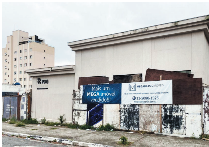
Sede da Catedral Nikkyoji será na Rua Vicente da Costa

No local onde existe esse terreno, anteriormente, havia a intenção de se construir um prédio. O anúncio oficial foi feito em 2014, mas pouco tempo depois já não existia mais tal anúncio, nem mesmo a empresa responsável pela obra deu sequência ao trabalho. A mudança do templo do Klabin para o Ipiranga gerou reivindicações por parte de fiéis que entraram até mesmo na justiça reivindicando a continuidade