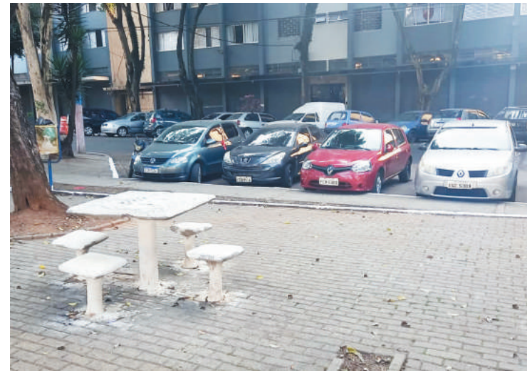
Local passou por mudanças após visita do Ipiranga News

No sábado (21), cinco dias depois que a matéria a respeito do abandono da Praça Manoel Buchalla foi publicada no Facebook do Jornal e dois dias que