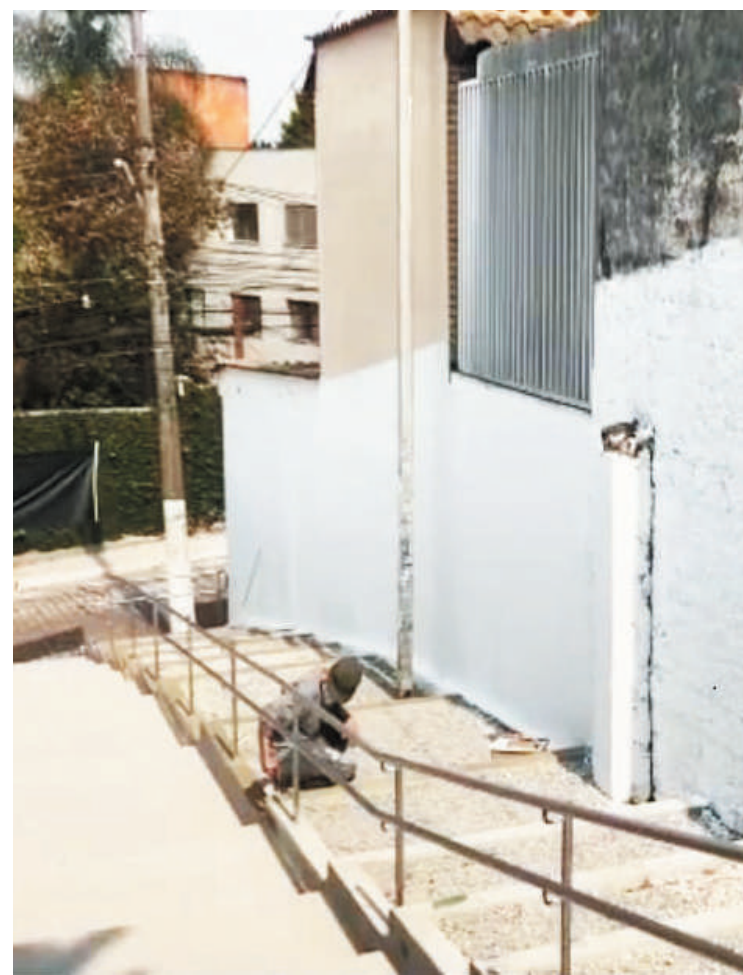
Espaço tem estrutura para facilitar escoamento em dias de chuvas

O escadão também recebeu novos corrimões, que passam por toda a extensão do local. Outra novidade anunciada pela subprefeitura é que os muros que ficam ao lado desse escadão vão receber pinturas de grafite, elaboradas por artistas da região.