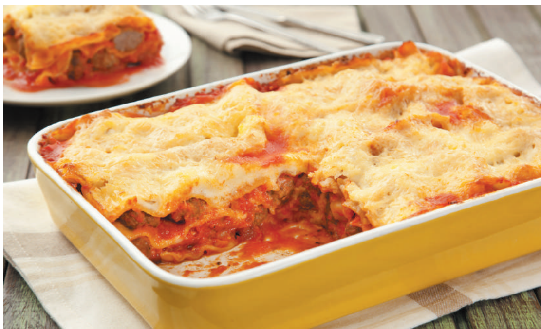
Massa italiana é uma ótima sugestão para os almoços em família e fácil de ser preparada

Ingredientes: Porpetas: 1 quilo de carne moída; ½ cebola ralada; 2 dentes de alho picados; 1 ovo pequeno; 6 colheres (sopa) de farinha de rosca; 2 colheres (sopa) de salsinha picada; sal e pimenta-do-reino a gosto; óleo para fritar. Lasanha: 500 gramas de massa de lasanha pré-cozida; 3 litros de molho de tomate; 400 gramas de queijo tipo Muçarela fatiado; 250 gramas de requeijão cremoso; ½ xícara (chá) de queijo tipo Parmesão ralado. Modo de Preparo: Porpetas: Numa tigela, coloque a carne moída, junte a cebola, o alho e o ovo. Mexa bem a carne, amassando com as mãos. Acrescente a farinha de rosca, a salsinha picada e tempere com sal e pimenta. Amasse bem para ficar homogêneo. Molde cerca de 120 porpetinhas, no diâmetro de uma moeda. Numa panela média, aqueça o óleo e frite as porpetinhas e escorra em papel toalha para que fiquem bem sequinhas. Reserve. Lasanha: Em uma assadeira retangular (30 cm x 45 cm x 7 cm de altura) espalhe um pouco de molho. Acomode uma camada de massa, fatias de queijo Muçarela e metade das porpetinhas. Repita o processo com o restante da