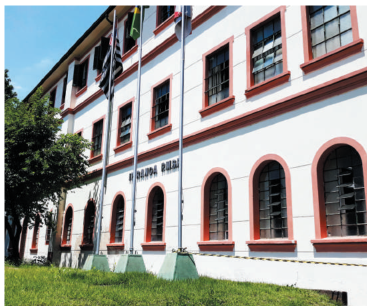
A subprefeitura do Ipiranga já está fazendo atendimento presencial

Demais serviços estão disponíveis de forma online pelo SP156 e podem ser solicitados pelo site