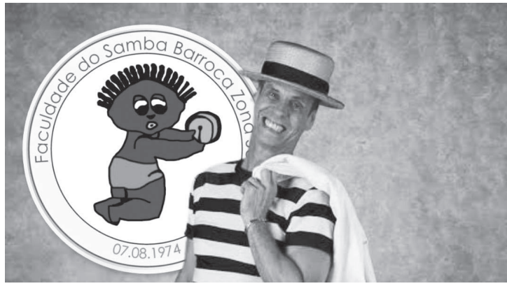
Ator e bailarino estreia pela Verde e Rosa no carnaval paulista

A Faculdade do Samba Barroca Zona Sul está no Grupo Especial das escolas de samba de São Paulo e sua quadra fica localizada na Av. Barro Branco, nº 3284, na Vila do Encontro. A Verde e Rosa ocupou a décima colocação no último desfile, realizado em 2020. Embora algumas agremiações já estejam realizando atividades visando o