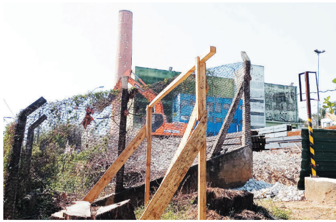
Após anos de espera, reforma promete trazer bem estar aos moradores da região até maio de 2022