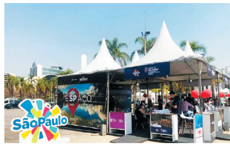
Todos os resultados obtidos na feira teste foram satisfatórios

Seguindo os protocolos de saúde pública preventivos contra a pandemia do Covid-19, o evento adotou medidas de proteção à saúde dos expositores e do público visitante, realizando testes rápidos do Covid-19 antes de entrarem no espaço da feira. Expositores e visitantes serão monitorados mesmo depois do evento, por 14 dias, a partir do cadastro que preencheram no local da entrada.