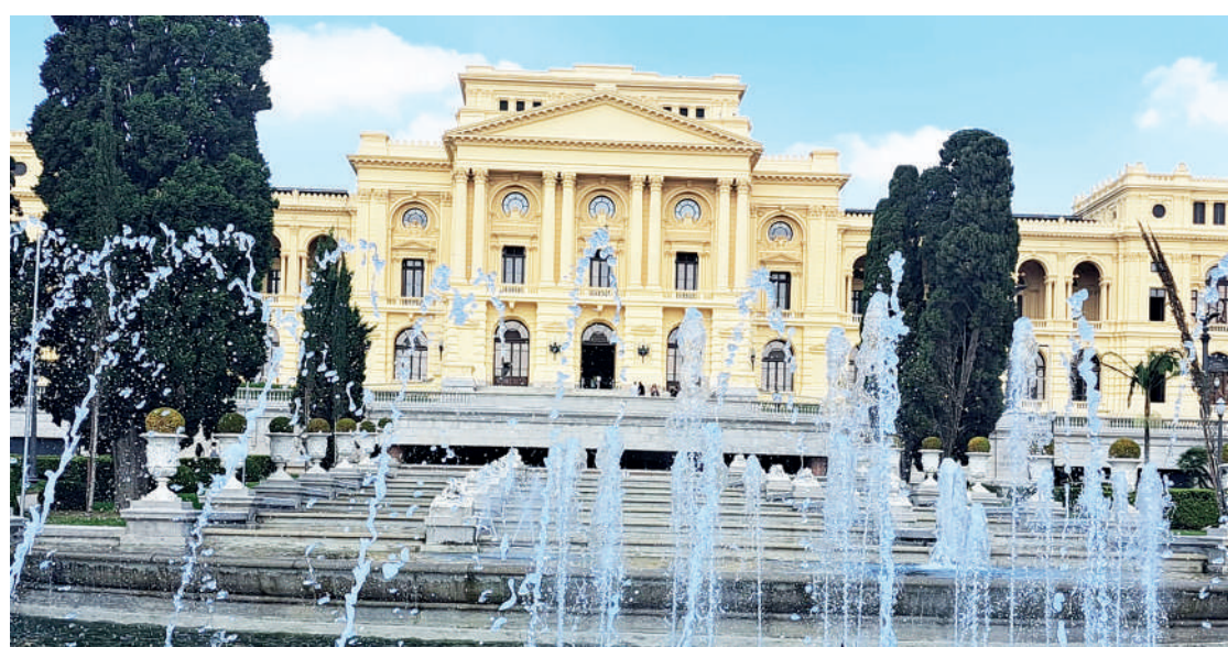
A indicação foi feita através de pesquisa do Datafolha. Ícone do Ipiranga ficou em primeiro

O Museu do Ipiranga, querido da população do bairro, agora também é o queridinho da população de São Paulo.