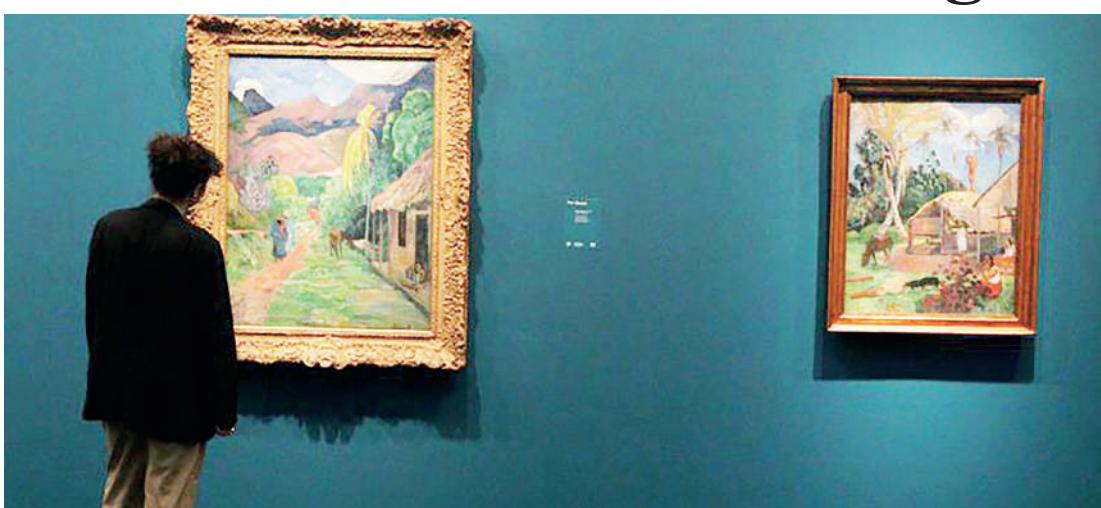
Mostra apresenta 40 obras em pinturas, xilogravuras, litografias e monotipias de Paul Gauguin

“A particularidade dessa mostra é que ela foi feita pelo Masp para