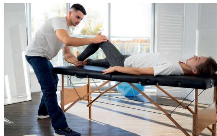
Exercícios proporcionam o alongamento e fortalecimento dos músculos

paciente tem as zonas de seu corpo – cervical, ombros, dorsal, lombar, bacias, joelhos e pés – observadas nos mínimos detalhes. A partir de então, o profissional planeja seu trabalho em cima de oito posturas que serão executadas pelo paciente. Cada uma das posturas está focada em determinadas cadeias musculares e o objetivo é alongar os músculos que estão muito rígidos e fortalecer os que se encontram flácidos.