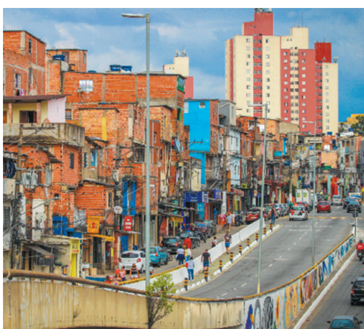
Virada acontecerá nos dias 27 (sábado) e 28 (domingo) de maio

Mais informações sobre a grande festa cultural estarão disponíveis em breve.