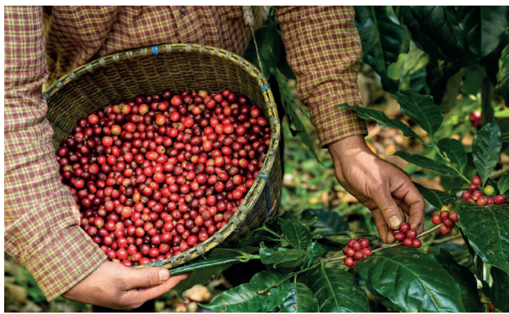
Sabor da Colheita será realizado no dia 27 de maio (sábado)

“Esse é um evento emblemático, pois todo paulista nasce com um pé no cafezal. O café é a cultura mais nobre que temos no Estado de São Paulo”, comentou Antônio Julio Junqueira, secretário de Agricultura de São Paulo, lembrando que a comunidade aguarda com ansiedade esse momento para conhecer o cafezal do Biológico. O evento, que está em sua 16ª edição, é parte das comemorações do Dia Nacional do Café, celebrado no dia 24 de maio. Nesta data, haverá um encontro técnico envolvendo pesquisado-