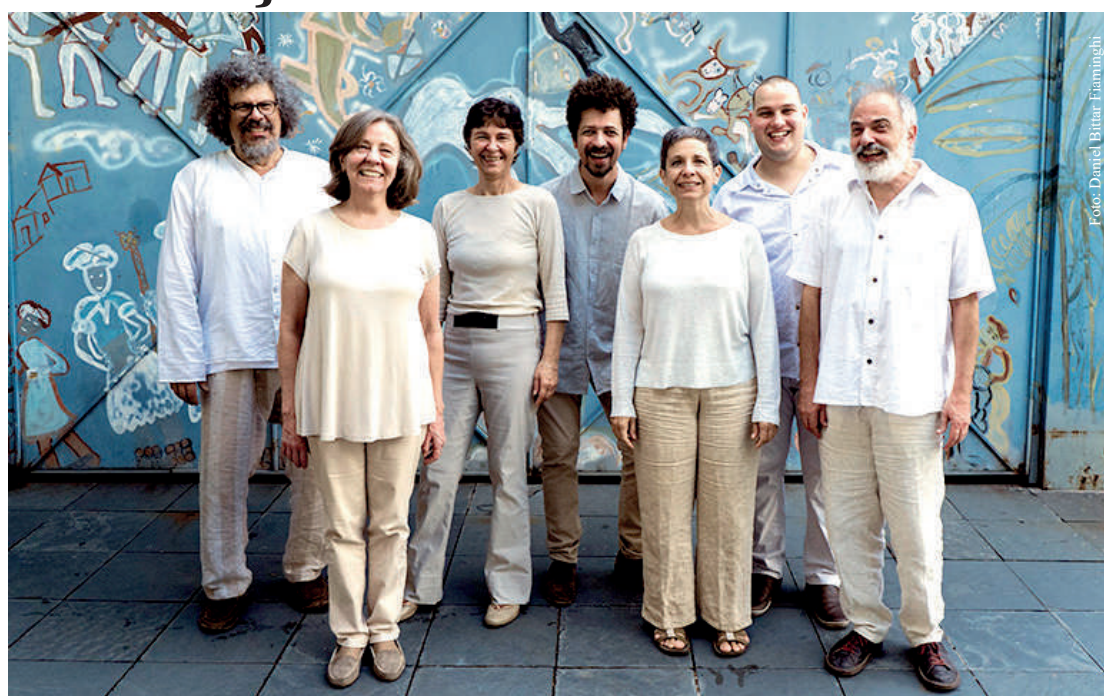
“Grupo Anima” se apresenta no Sesc Vila Mariana na sexta-feira (2) e também participa de bate-papo

Na sexta-feira (2), às 21h, acontecerá, no Teatro Antunes Filho, do Sesc Vila Mariana, um show do “Grupo Anima”, com o repertório do disco “Mar Anterior” (2020), terceiro volume da série iniciada com Donzela Guerreira (2010) e seguida por Encantaria (2017) – realização Selo Sesc São Paulo.