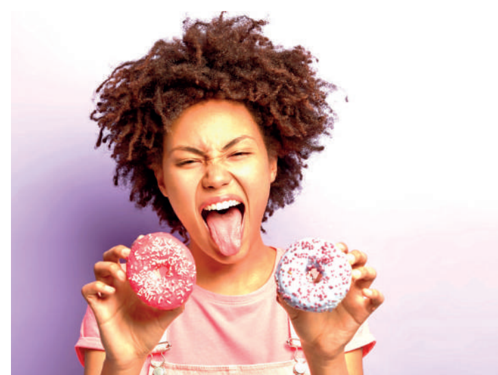
Açúcar é o vilão das dietas se for consumido em excesso

O açúcar mascavo, com sua cor caramelo e sabor semelhante à rapadura, preserva nutrientes como ferro e cálcio, evitando o processo de refinamento. O açúcar demerara, por sua vez,