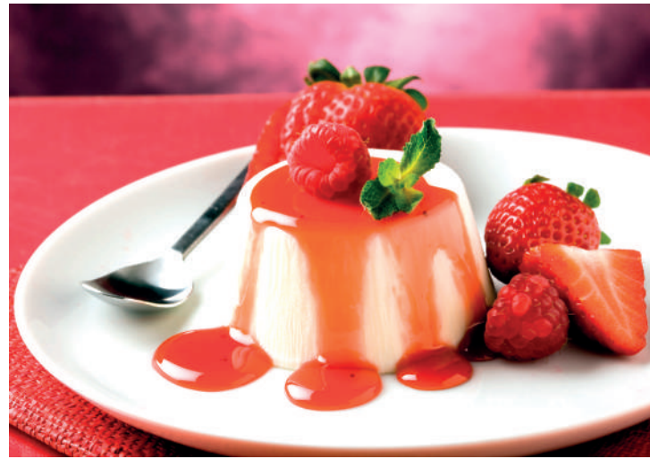
Deve ser servido bem gelado e acompanhado de calda de frutas

claras batidas em neve. Coloque a mousse em tacinhas, cubra-as com papel filme e leve-as à geladeira por 4 horas ou até a mousse endurecer. Decore com fatias de pêssegos em calda e cerejas