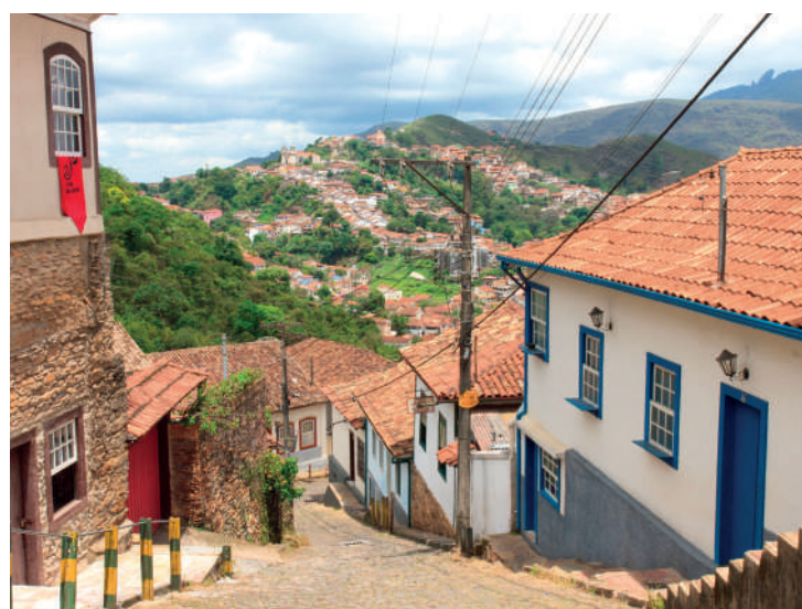
Ouro Preto é um patrimônio arquitetônico e colonial do Brasil

Olinda, no Estado de Pernambuco, também está no roteiro de