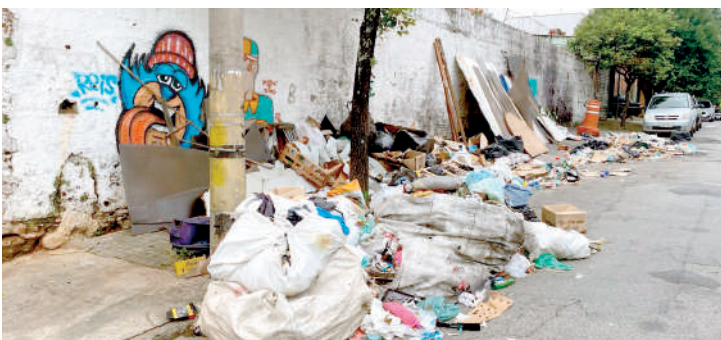
Morador destaca que é comum as pessoas jogarem lixo na rua

O descarte irregular de lixo continua sendo um dos principais problemas enfrentados pelos moradores do Ipiranga. Antes poderia se dizer que alguns locais eram considerados críticos, e tinham uma maior atenção da subprefeitura do Ipiranga. Agora qualquer lugar virou descarte de lixo e restos de material de construção. No Moinho Velho, por exemplo, era uma região onde essa ocorrência era reduzi-