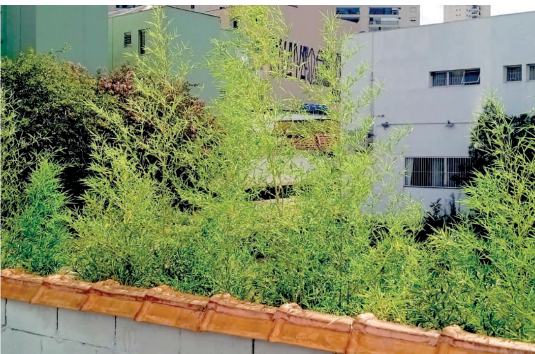
Um morador vizinho ao terreno, que não quer se identificar, enviou esta foto para a reportagem

A falta de cuidados com o mato do terreno onde anos atrás funcionava uma agência do Bradesco, no número 487 da Rua Silva Bueno, vem preocupando os moradores vizinhos. O local onde, antes, era o estacionamento do banco, hoje, encontra-se praticamente tomado pelo mato, que tende a crescer cada vez mais.