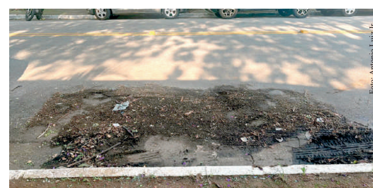
Depois de cinco meses, outros carros podem estacionar no local

A situação preocupava os moradores, pois isso torna o bairro ainda mais atrativo para os bandidos, uma vez