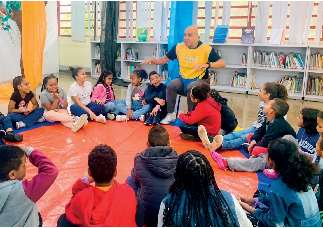
É preciso a presença de familiares dos alunos em qualquer unidade educacional para realizar a inscrição

A partir de agora, estão disponíveis as inscrições para o Programa Recreio nas Férias 2025, que acontecerá durante o período de férias escolares (6 a 24 de janeiro), com atividades e refeições diárias para bebês e crianças de 0 a 14 anos.