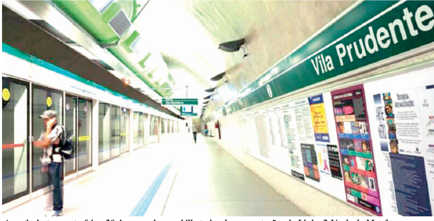
A partir desta quarta-feira, 20 de novembro, as bilheterias de nove estações da Linha 2-Verde do Metrô passaram a funcionar das 6h às 22h. A medida foi adotada considerando o baixo volume de vendas nestes horários. PÁGINA 3