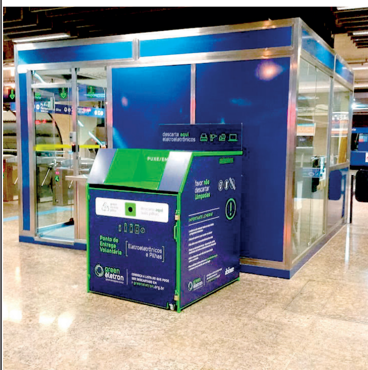
Jabaquara, Saúde e Sacomã são estações que recebem coleta

As estações Jabaquara; Saúde e Sacomã do Metrô estão com pontos de Entrega Voluntária (PEV), para que as pessoas que tenham lixo eletrônico possam descartar os próprios itens eletrônicos, pilhas e baterias sem uso,