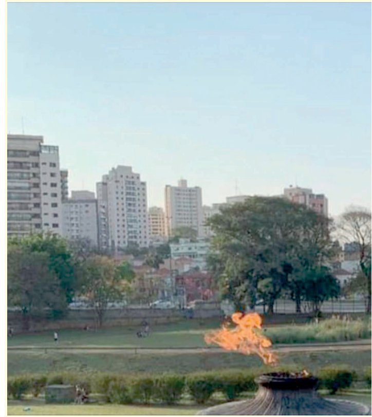
Só é possível se as pessoas usarem as áreas verdes na vizinhança

Pessoas que residem em locais com a maior quantidade de áreas verdes têm menor risco de apresentar obesidade geral, obesidade abdominal e níveis baixos de HDL-colesterol (o colesterol bom). Além disso, têm maior chance de manter a prática de atividade física em intensidade moderada ou vigorosa. Esse é o caso de moradores do Ipiranga, que tem uma imensa área verde no Museu do Ipiranga e também na área que foi anexada recentemente com uma área verde de 25 mil metros quadrados;