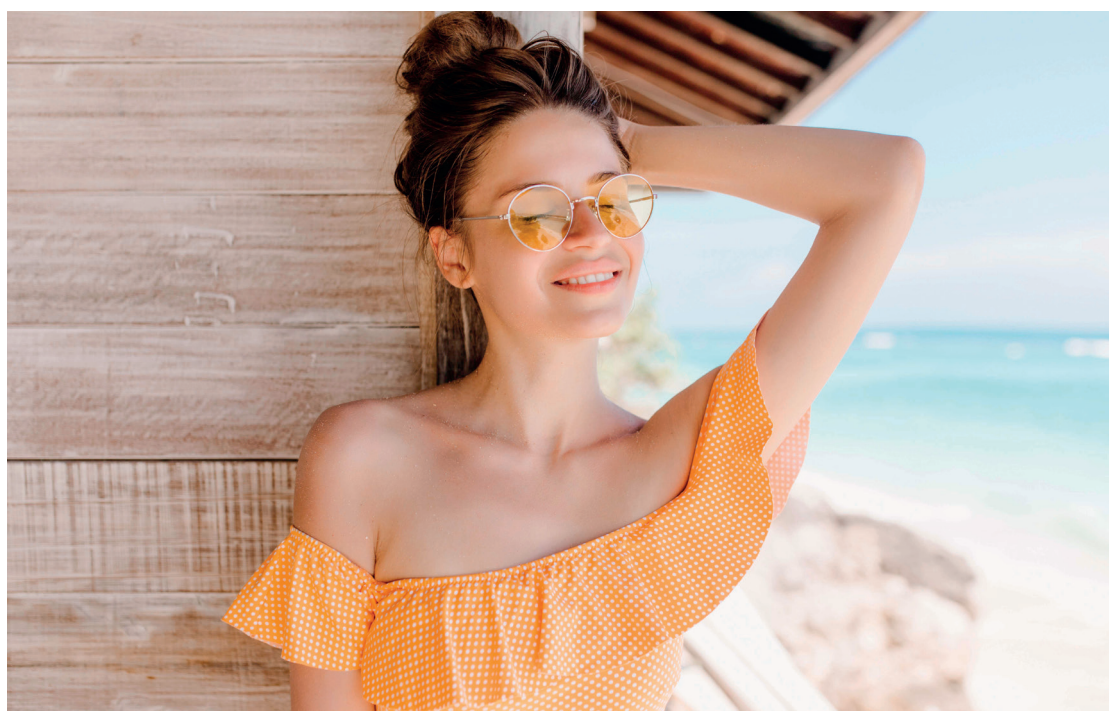
Com a chegada da estação do ano, a busca por uma pele e cabelos saudáveis se intensifica

Usar vários cremes de tratamento simultaneamente pode prejudicar a saúde da pele. O excesso de produtos dificulta a absorção e pode causar o fechamento dos poros, além de reações adversas devido a