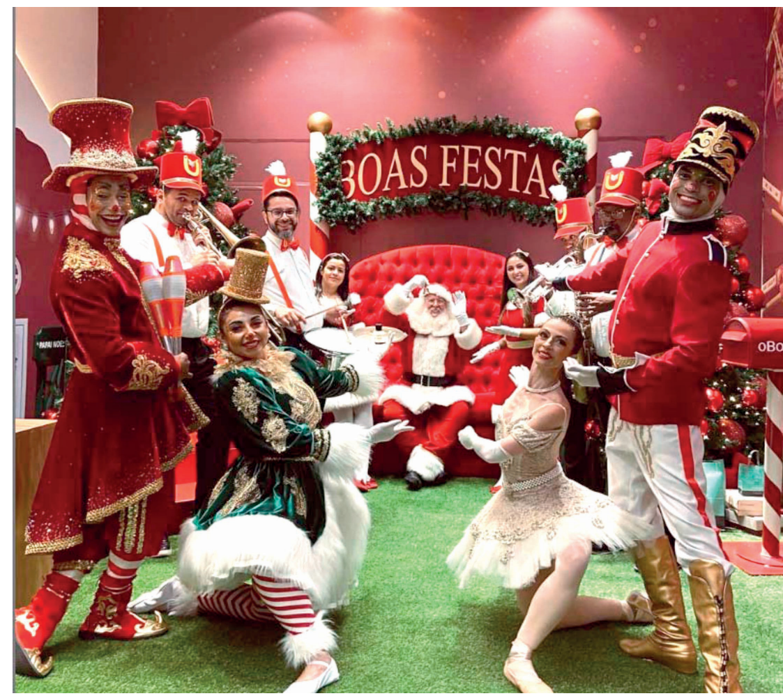
Visitantes poderão fazer fotos e pedidos, inclusive, na presença dos melhores amigos peludos