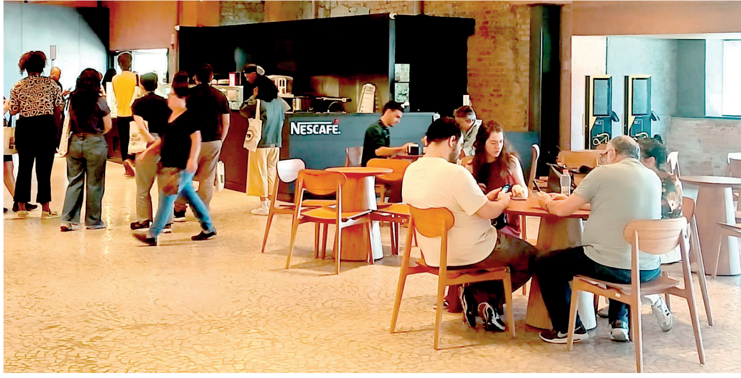
A cafeteria do Museu do Ipiranga foi oficialmente inaugurada. O local, carrega o nome da renomada marca Nescafé, mas pertence à Dolcissimo, renomada em outras localidades do Brasil. PÁGINA 3