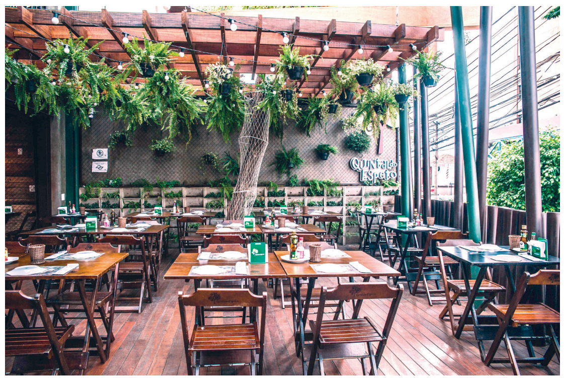
Casa conta com uma rede própria de 10 unidades com máximo conforto e programação musical

Referência em São Paulo, o “Quintal do Espeto” possui nove unidades na cidade (Alto da Lapa, Chácara Santo Antonio, Moema Carinás, Moema Pavão, Perdizes, Santana,