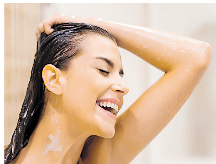
Um gesto simples que faz a diferença no seu ritual de beleza

A aparência dos xampus sólidos lembra a de uma barra de sabonete, mas sua formulação é especificamente desenvol-