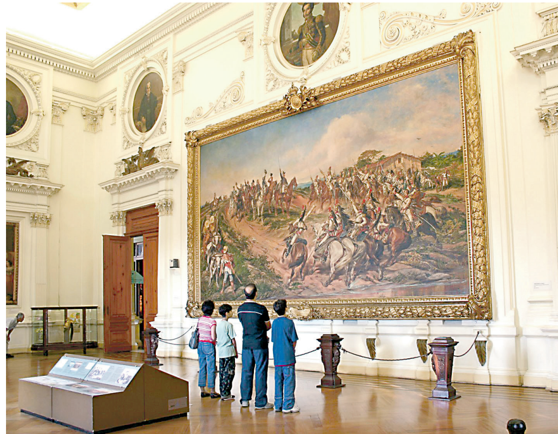
O Museu do Ipiranga é especializado em história e cultural material do povo brasileiro, e com suas 11 exposições de longa duração, é uma ótima opção de passeio nas férias de verão. PÁGINA 3

derrotado, os invasores cometeram vários crimes como envolvimento em associação criminosa armada, dano qualificado, tentativa de Golpe de Estado, abolição violenta do Estado Democrático de Direito e depreação de patrimônio público. Muitos já foram condenados. Mas os brasileiros querem ver punidos os financiadores e organizadores da tentativa de golpe e até o principal ídolo dos manifestantes. NOSSA OPINIÃO PÁGINA 2