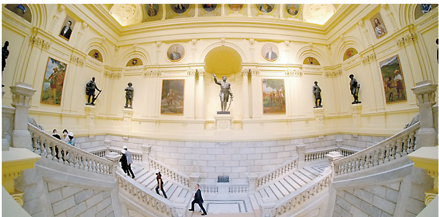
Visitante podem ver imagens icônicas, personagens da história brasileira, além de objetos que representam o cotidiano da sociedade

Esta exposição trata da formação do território brasileiro e dos conflitos entre portugueses, indígenas, espanhóis, franceses e holandeses, durante o processo de colonização.