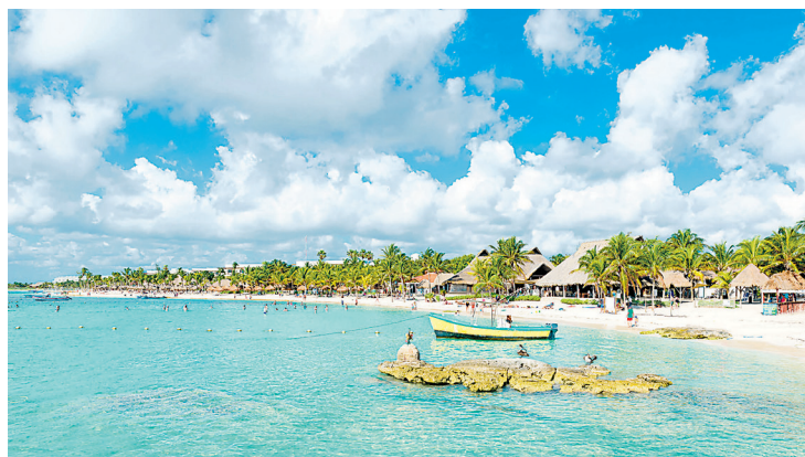
Cada praia tem seu próprio encanto com águas de cor turquesa

imaculadamente brancas que caracterizam Los Cabos, a região é conhecida por seus resorts luxuosos, frequentados por uma clientela exclusiva. A atmosfera de conforto e suntuosidade é acentuada pelo clima ameno, onde o sol parece permanentemente ajustado à temperatura ideal. Nos refinados restaurantes, os cardápios revelam uma fusão de sabores, oferecendo o melhor da cozinha internacional entrelaçado com as autênticas delícias da culinária