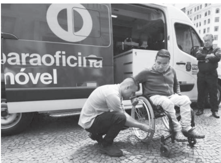
A manutenção de cadeiras de rodas será no Flávio Gianotti

A Paraoficina Móvel estará realizando a manutenção e reparos em cadeiras de rodas, órteses e próteses de forma gratuita para a população em situação de vulnerabilidade social na região do Ipiranga na próxima terça-feira, dia 21, no Centro de Reabilitação Flávio Gianotti, localizado na rua Xavier de Almeida, 210. Os serviços contam com equipamentos específicos e dois técnicos especializados. As visitas são realizadas apenas em dias úteis, das 9h às 17h. A Paraoficina Móvel é uma van adaptada com mobiliário especial que oferece serviços