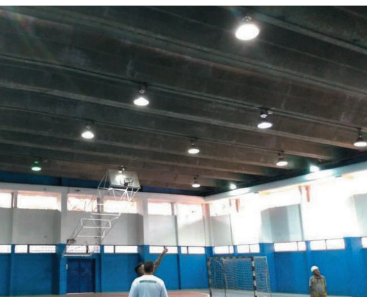
Ginásio na Vila Clementino está com nova aparência

O ginásio poliesportivo do Centro Esportivo Mané Garrincha, na zona sul de São Paulo, recebeu hoje nova iluminação.