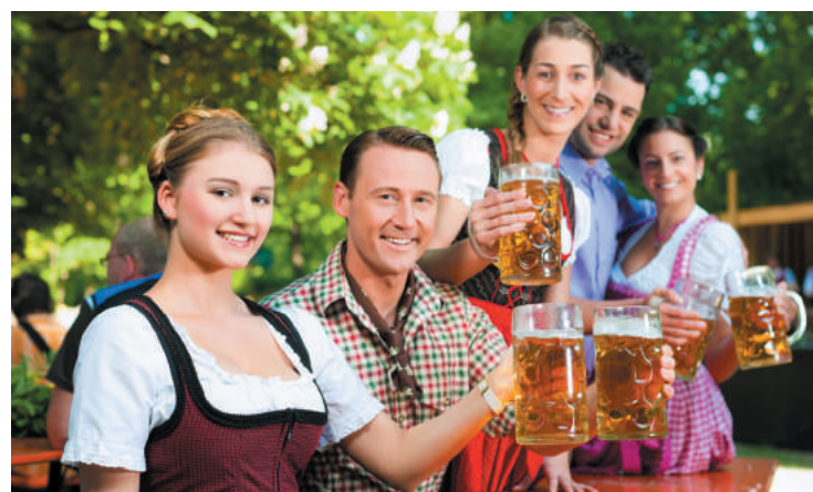
Região possui igrejas, galeria de arte e outros pontos turísticos

A pitoresca cidade de Füssen, no Lago Forggensee, abriga o Castelo de Neuschwanstein, um dos maiores e mais famosos no gênero; foi erguido no Século XIX pelo Rei Ludwig e serviu de inspiração para Walt Disney construir o Castelo da Cinderela. Não é permitido fotografar no interior de Neuschwanstein. Aliás, o Rei Ludwig adorava fazer palácios por isso toda a região próxima a Füssen é pontuada de castelos de contos de fada e por esse motivo foi batizada de “Rota Romântica”, constituindo-se um roteiro turístico à parte, na Baviera.