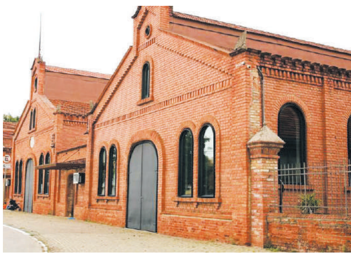
Instituição foi reabsorvida pelo Ministério do Turismo

A Cinemateca foi reabsorvida pelo Ministério do Turismo, à qual a Secretaria Especial da Cultura está vinculada, em agosto de 2020, após um impasse na gestão da Cinemateca na metade do ano passado após a saída da Associação de Comunicação Educativa Roquette