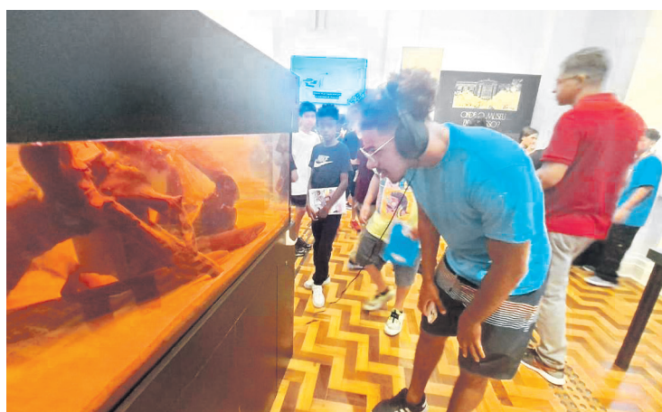
A exposição tem recebido centenas de estudantes da região