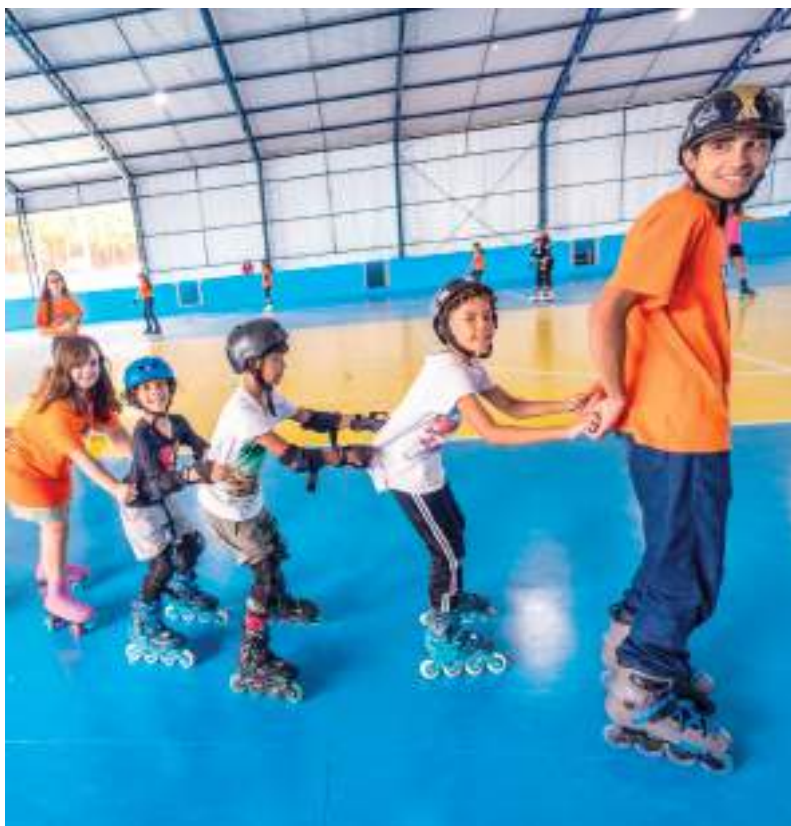
Unidade foi revitalizada por R$ 11,3 milhões, ganhando novas quadras, vestiários, área pet e mais de 30 atividades gratuitas

Com uma média de 2.500 visitantes mensais e até 800 usuários diários, o centro oferece mais de 30 atividades gratuitas, que incluem aulas de zumba, basquete, capoeira, esportes de areia, danças e diversas modalidades de ginástica. A revitalização, que celebra os 50 anos de funcionamento do equipamento, evidencia o papel transformador dos espaços de lazer na promoção da saúde e na melhoria da qualidade de vida dos cidadãos, estimulando o convívio social e afastando os jovens dos riscos das ruas.