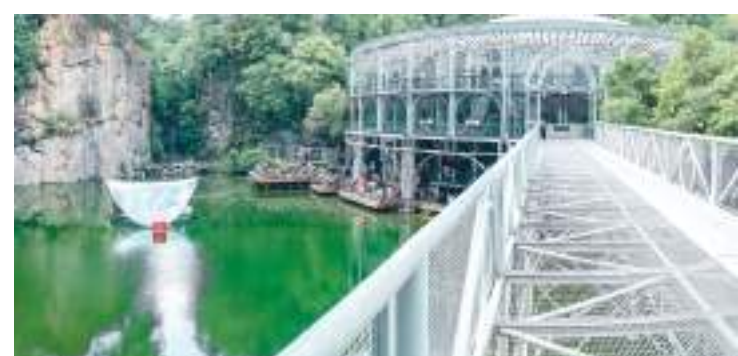
Ópera de Arame fica localizada no Parque das Pedreiras

Outro ícone curitibano é a Ópera de Arame, localizada no Parque das Pedreiras. Construída com estrutura metálica e teto transparente, a casa de espetáculos integra o Espaço Cultural Paulo Leminski, palco de grandes eventos ao ar livre com capacidade para até 20 mil pessoas.