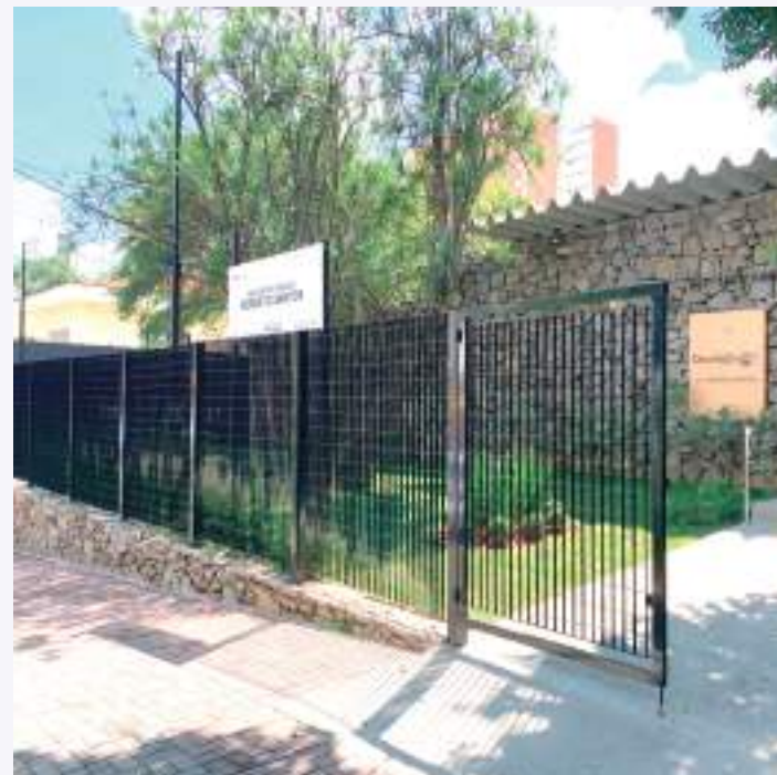
Reforma deixou local mais acessível e confortável aos visitantes

A Biblioteca Roberto Santos, localizada na Rua Cisplatina, nº 505, no Ipiranga, reabriu suas portas nesta segunda-feira (24), após passar por obras de reestruturação que visam proporcionar mais conforto e acessibilidade aos visitantes. A unidade, que se destaca como um importante centro cultural e de conhecimento, agora conta com um espaço renovado para crianças e jardim de inverno, preparado para atender melhor à população local e aos frequentadores habituais.