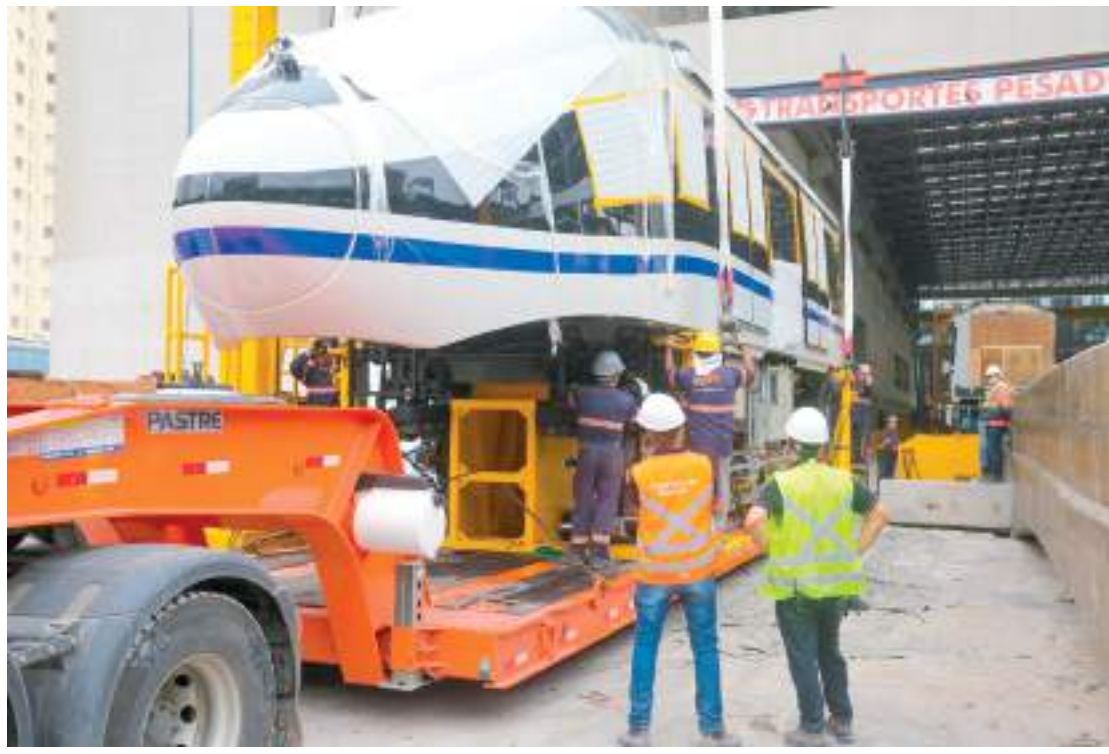
Operação de transporte do trem da BYD de Santos até a Água Espreiada envolveu oito carretas

Skyrail, os trens da Linha 17-Ouro são projetados para operação automatizada, com tecnologias como o Sistema de Controle de Monitoramento de Trens (TCMS) e o sistema de sinalização CBTC, que garantem maior eficiência e segurança. Além disso, os trens possuem intercomunicação com o Centro de Controle Operacional (CCO), câmeras de vigilância,