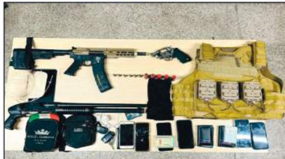
Em sentido horário: assalto a motociclista na Xavier Curado, roubo a professor na Lino Coutinho, arsenal apreendido na Rua Tabor e crime no Alto do Ipiranga

se desenrolou em apenas um minuto, evidenciou o modus operandi do grupo, que utiliza a agilidade das motocicletas para realizar abordagens rápidas e fugir.