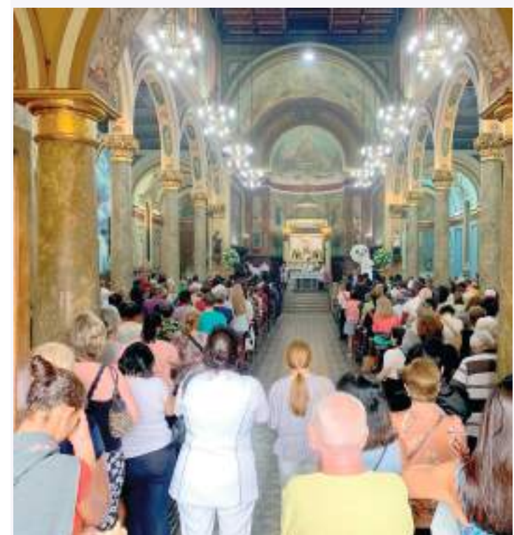
Programação da festa contou com 10 missas ao longo do dia

A Paróquia de São José do Ipiranga fica na Rua Brigadeiro Jordão, 560.