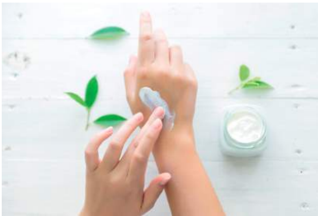
Protetor solar é um item indispensável nos cuidados diários das mãos para evitar manchas

A alimentação tem um papel fundamental na manutenção da saúde da pele das mãos. Alimentos ricos em proteínas magras, colágeno, vitaminas C e E e antioxidantes ajudam a combater os radicais livres, que são responsáveis pelo envelhecimento celular. Grãos integrais, castanhas, legumes, verduras, frutas, ovos e queijos