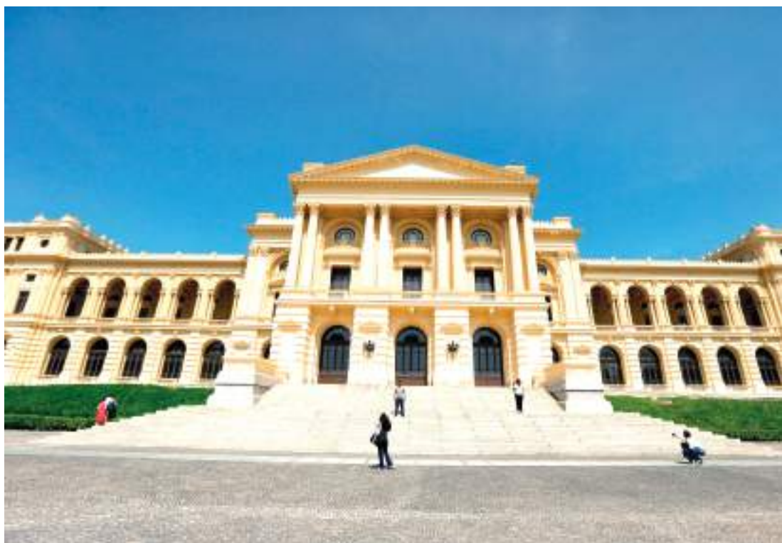
Estreia acontecerá em 5 de abril; após a sessão, cineastas promoverão debate com o público

"Os filmes selecionados para exibição, sejam documentários ou obras de ficção, são e serão aqueles que abrem a possibilidade