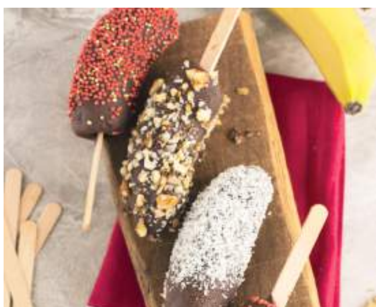
Receita simples deve ser consumida no mesmo dia do preparo

Ingredientes: 6 bananas nanicas maduras; 250 gramas de chocolate ao leite picado; castanha de caju picada. Preparo: Deixe as bananas com casca no freezer durante 3 horas no mínimo. Derreta o chocolate em banho-maria. Deixe esfriar e coloque em copo alto. Retire as bananas do freezer, tire as cascas e corte-as ao meio. Espete palitos de sorvete, banhe-as no chocolate e seguida passe na castanha de caju picada. Coloque-as em um prato e leve a geladeira até firmar. Sirva em seguida. Dica: esta sobremesa deve ser consumida no mesmo dia do preparo. Variação: Se quiser, use chocolate granulado, chocolate branco picado, confeitos coloridos ou outro tipo de castanha para finalizar.