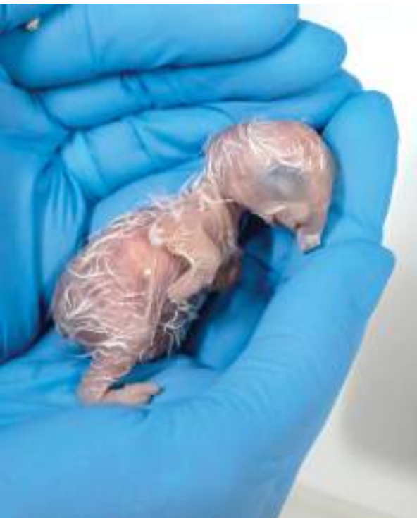
Arara-azul-de-lear está ameaçada de extinção; ainda não é possível determinar o sexo dos filhotes nascidos no Zoológico de SP