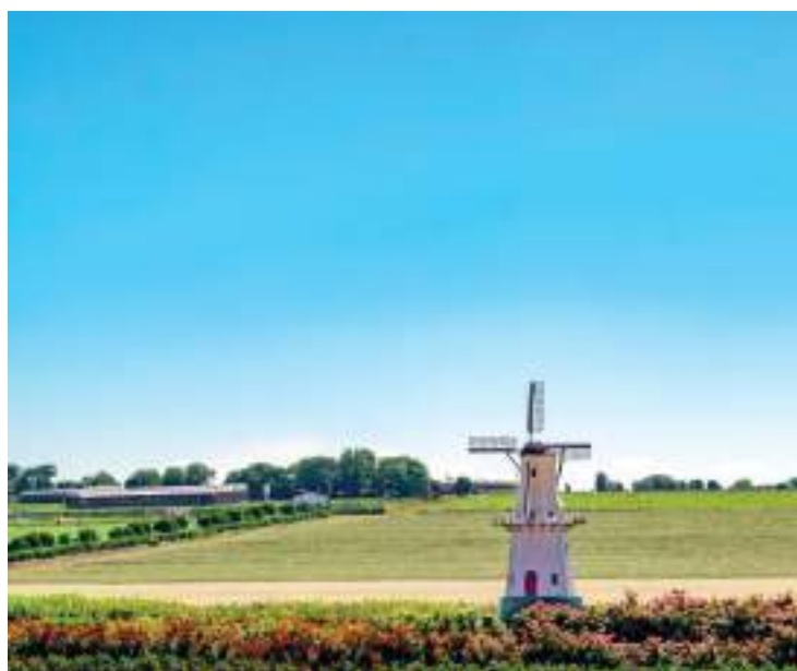
Maior moinho holandês da América Latina fica em Holambra

Com sua beleza natural, cultura rica e história fascinante, Holambra é um destino completo para quem busca um passeio inesquecível.