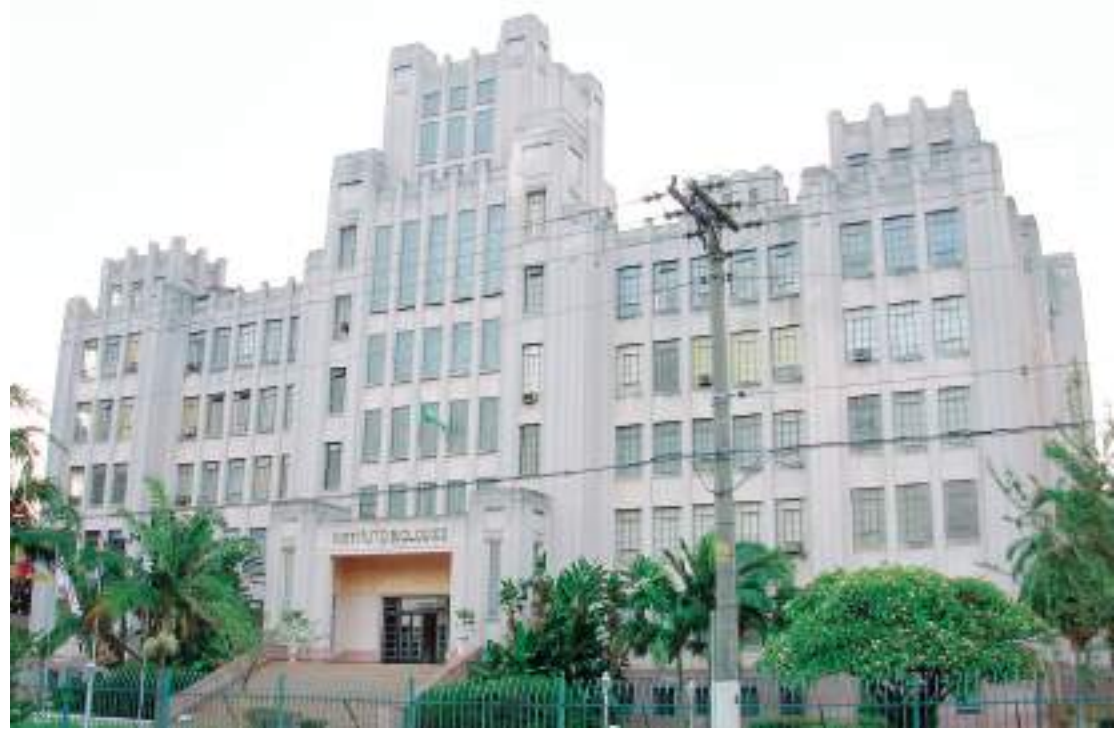
Festa no Instituto Biológico contará com uma série de atividades para todos os gostos e idades

Para quem deseja entender o cultivo do cacau, a Visita Técnica ao Cacaal será uma